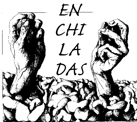
Dibujo de Günter Grass (Alemania, 1979).

Magnífico síntoma no pertenecer a ningún grupo.