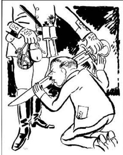
George Grosz (Alemania) Los socialistas bajo el mando militar; dibujo de 1925

Ha perdido el buen humor y las notas de la canción que viene silbando se diluyen entre el ruido de las bocinas, las imprecaciones de los automovilistas y las consignas de los manifestantes que caminan sobre Reforma. Comprende que el embotellamiento va durar largo rato y decide poner una cinta. Tamborilea suavemente sobre el mullido tablero de su auto último modelo y, por un reflejo mecánico, observa el reloj: las manecillas, como una boca socarrona, contabilizan quince minutos de retardo. “Dos de octubre”, piensa, “debí preverlo”. En un bar lo están esperando los compañeros de su generación. La fecha lo hace retroceder a ese lejano y comentado 1968.