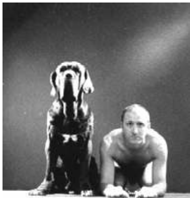
Kulik, Familia de futuro, 1997 (fotografía).

El tránsito se agiliza, Ricardo vuelve a su automóvil. Revisa, reflejados en los cristales de un edificio, la caída de su traje, el nudo impecable de su corbata y la línea europea de su coche. Después de todo, él representa el buen éxito de su generación.