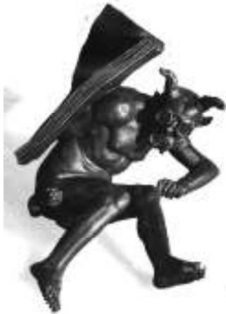
Demonio sapiente, Siglo XVI, escultura.