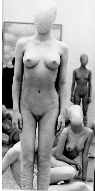
Sin título ni autor. Tomado de la revista italiana "Flash Art" No. 233.

Vislumbrando sólo ya la imagen de sus hijos sobreviviendo bajo el cielo de esta tierra azul y blanca, que se desangra con ella.