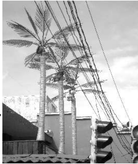
"Tropical trees" (Proyecto de restauración del Casco Histórico de León).