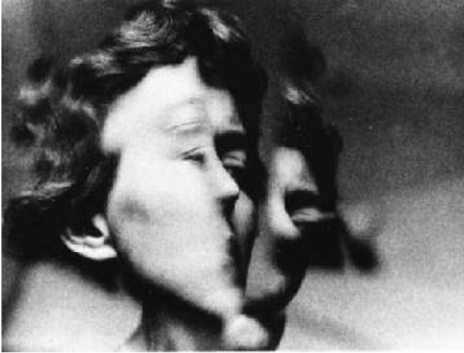
Zdzistaw Beksinski (Polonia) Fotografía