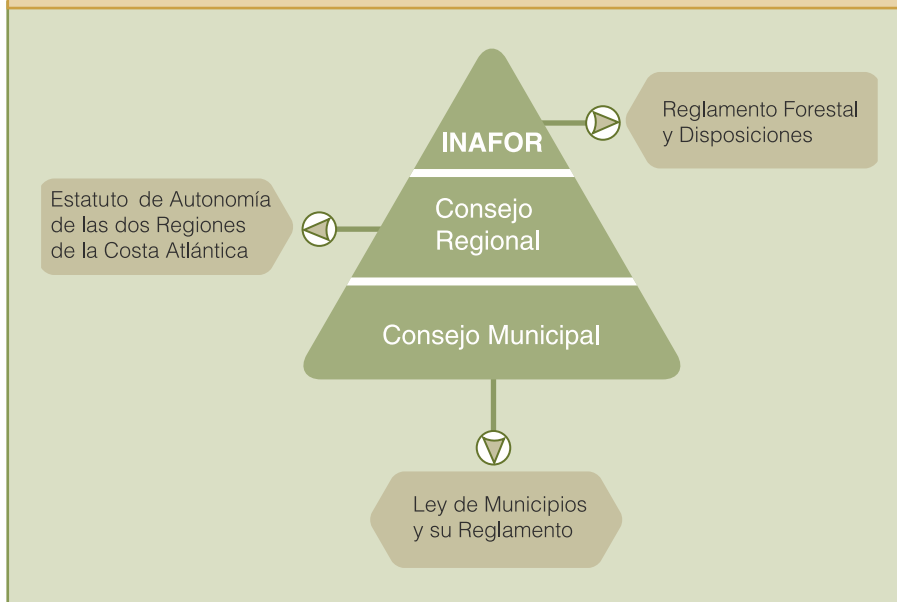
Figura 1. Pirámide de responsabilidades institucionales en la RAAN

Tiene la responsabilidad de autorizar el manejo forestal, así como monitorear y planificar el uso más adecuado de los recursos naturales que se encuentran en su jurisdicción. Aunque tiene otras facultades, su participación se limita a autorizar el manejo y el cobro de tasas por el aval donde autoriza la elaboración del PGM y el aval donde autoriza el POA para el aprovechamiento.