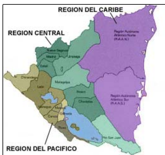
Fig. 1. Distribución de Nicaragua por Regiones y Departamentos

Nicaragua es el país más grande de América Central, con una extensión territorial de 129.494 km 2 y una población de 5.482.340 habitantes, siendo un país eminentemente agropecuario, lo que determina el 28.1% del Producto Interno Bruto, el 15.9% de las exportaciones totales y el 42.6 % del empleo nacional aportados por el sector (ver tabla 1).