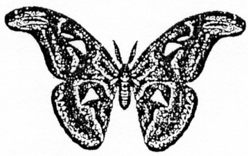
Adulto de la familia Saturniidae y detalle de una antena.