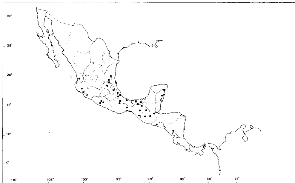
MAPA 1. Área de Distribución de las subespecies de Consul electra . Los triángulos corresponden a C. e. electra , las estrellas son de C. e. castanea Llorente y Luis ssp. nov.

Variación estacional y geográfica. Consul electra es una especie que se distribuye a lo largo de ambas costas en México, desde Chiapas a Nayarit por el Pacífico y desde Chiapas a Tamaulipas por el Golfo (Apéndice 1), además de ocupar Centroamérica hasta Panamá, como se observa en el Mapa. Ocupa un intervalo