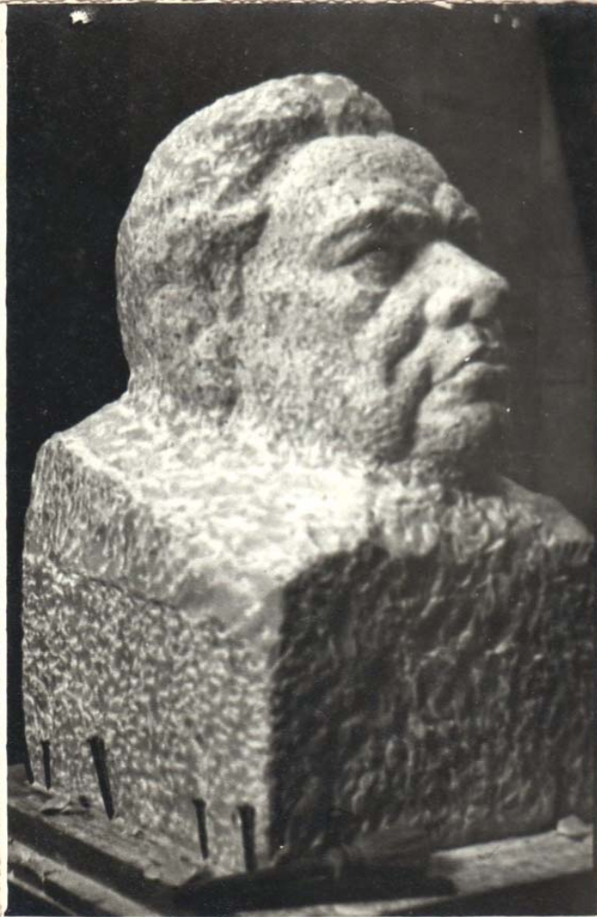
Cabeza de Dario en su comienzo