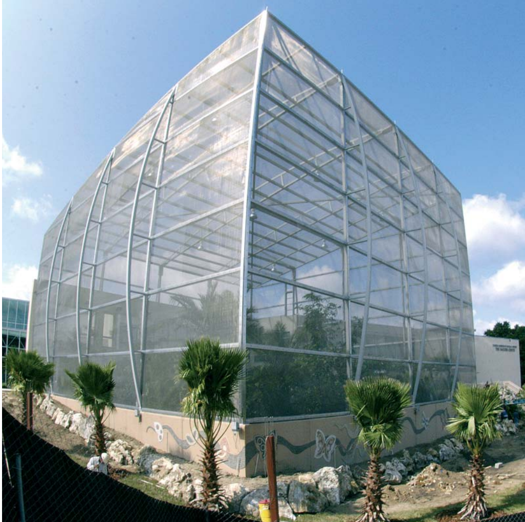
La volière tropicale du McGuire center for lepidoptera

Gainesville, j'ai pu admirer cette magnifique réalisation qui permettra aux papillons exotiques et même aux libellules de voler dans des conditions naturelles de forêt tropicale. Il y a une rivière et une chute d'eau et toutes les plantes susceptibles de nourrir les chenilles et les adultes sont présentes. Il faudra y introduire des moustiques pour nourrir les Odonates, si leurs larves acceptent de se reproduire dans une eau légèrement javellisée. Le climat local permettra, avec un chauffage du sol modéré en hiver, aux Morpho et aux