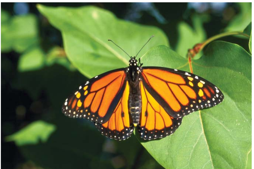
Le Monarque, Danaus plexippus

En voyant voler des Monarques, Danaus plexippus L. (Lépidoptères Danaïdés), dans les serres du McGuire Center for Lepidoptera, à