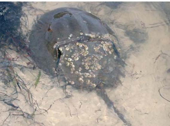
Femelle de Limule ( Limulus polyphemus ) en train de pondre dans le sable

leur nombre régresse certainement, car elles sont chassées pour servir d'appât ou pour fournir leur sang aux propriétés antibactériennes puissantes. Il y a partout des limules, le long de la côte atlantique des États-Unis, vestiges de l'antique Téthys du Triasique. Un autre genre et plusieurs espèces existent aussi en Indonésie et en Thaïlande-Vietnam-Japon, à l'autre bout de la Téthys. En Thaïlande, on chasse les femelles pour manger leurs œufs, au goût de caviar. Un massacre inutile, pour quelques grammes de nourriture, digne des Romains quand ils tuaient des milliers de flamants pour déguster leurs langues. Les accouplements des limules sont synchronisés et massifs. Des jeunes se mêlent souvent au groupe sans qu'on en comprenne bien la raison. Les oiseaux sur le rivage guettent les pontes pour en déterrer le plus possible. Et pourtant l'espèce survit depuis l'aube de la vie.