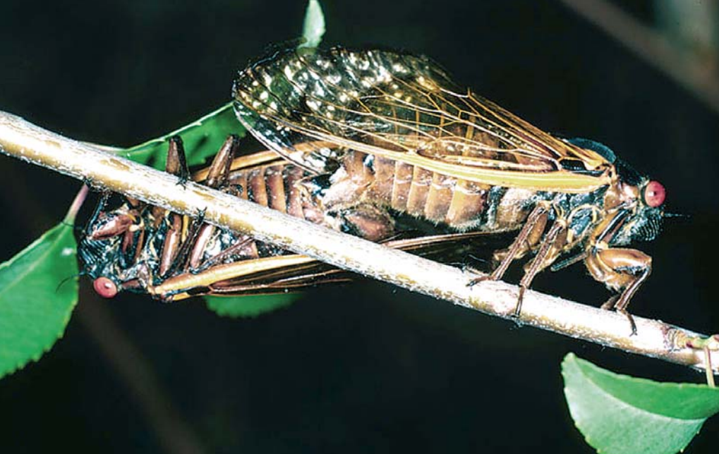
Deux adultes de Magicicada s'accouplant