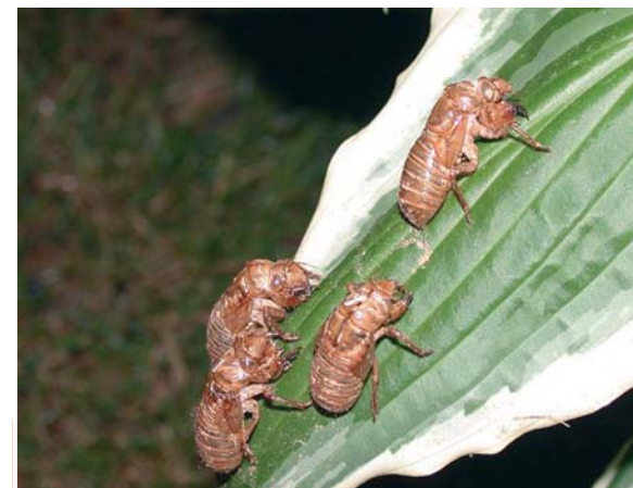
Groupe de larves âgées à l'assaut d'une feuille