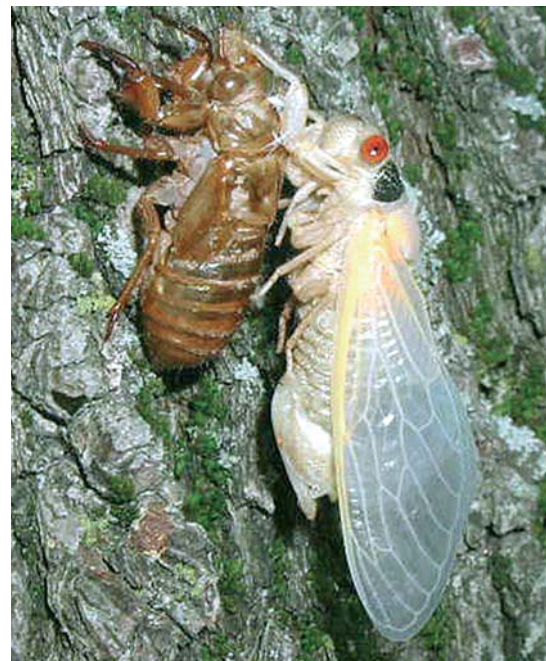
Adulte non mélanisé, accroché à son exuvie larvaire, juste après l'émergence

"Heureuses les cigales, car leurs femmes sont muettes!", écrivait, il y a peu d'années, un Indien, des Indes Orientales, un peu macho, en tête de l'un de ses livres. Oui, seuls les mâles chantent, ou crissent si l'on peut dire. Ils peuvent, à l'unisson, produire des sons aussi forts qu'une rame de métro entrant dans une station, qu'un enfant hurlant ou qu'un marteau piqueur. À 90 décibels, leur "chant" rivalise avec une tondeuse à gazon. Ceci n'est pas du tout exagéré et on a cité des terrains de golf où c'était réellement, cette année, assourdissant. Les joueurs ne s'en-