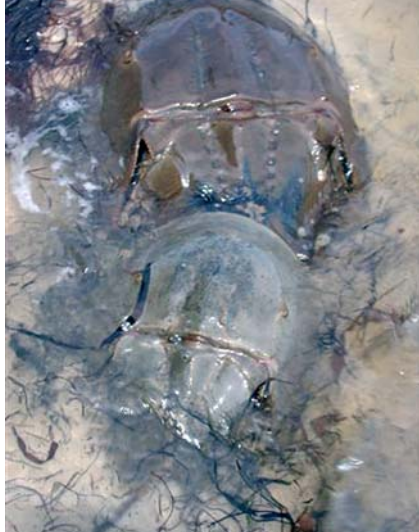
Le mois de mai est aussi celui de l'accouplement des Limules en Floride

Un livre, aux États-Unis, vient de leur être consacré 4 . Les trilobites ont disparu, les limules ont survécu. Il est vrai que la découverte toute récente d'un graptolithe vivant, un Notochordé, Cephalodiscus graptolitoïdes , dans les fosses de la Nouvelle-Calédonie, vers la chaîne de Norfolk, montre que tout peut encore arriver. Cette découverte qui passa totalement inaperçue du