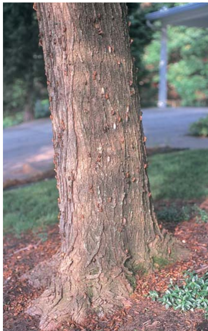
Les densités d'insectes sont parfois impressionnantes

ment, occupées qu'elles étaient à étirer et à sécher leurs ailes à la sortie de l'exuvie larvaire. Les larves âgées et les éclopées étaient encore nombreuses alentour, sur le sol, sur les troncs et au pied des arbres. On dit que certains mammifères, oiseaux, batraciens et reptiles s'en nourrissent. En réalité, ils en sont bien vite dégoûtés, vu le nombre. Des restaurants de Washington, pour faire original, ont offert des fricassées de cigales et ont publié des menus affriolants où figuraient ces pauvres Homoptères. Finalement, les