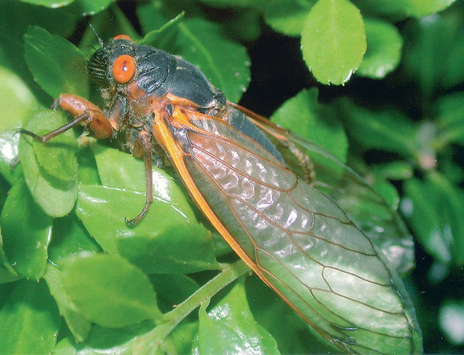
Magicada septemdecim adulte : l'accomplissement de 17 années de vie souterraine - Cliché P. Jolivet