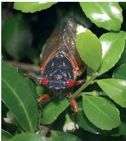
Une rencontre qui ne s'oublie pas

Comme chaque année, je passe quelques mois aux États-Unis dans le milieu des entomologistes. Avec le Department of Entomology and Nematology de l'université de Floride, un bâtiment qui évoque un "micro-Pentagone", le Florida State Museum of Arthropods , le McGuire Center for Lepidoptera and Environmental Research , le Museum of Natural History , le Department of Plant Industry , l' American Institute of Entomology ou encore l' USDA 1 avec ses unités spécialisées sur les