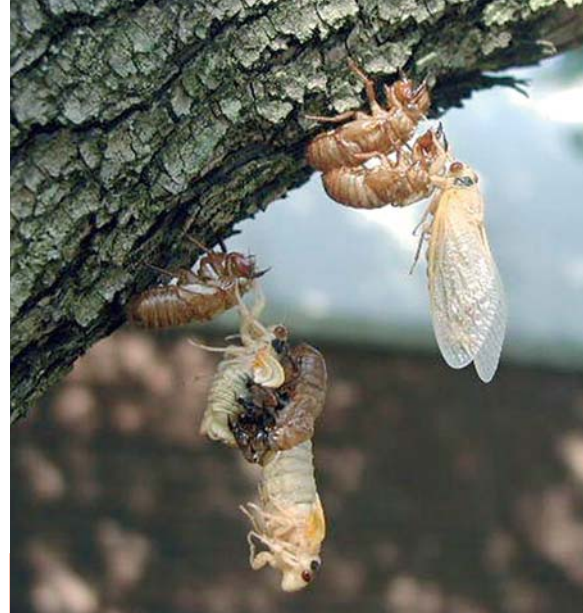
Des scènes étranges et pittoresques

de 13 années. On a tenté d'expliquer ces curieux cycles comme un moyen d'autodéfense contre les prédateurs. Choisisant ainsi des nombres premiers, ces insectes ne risqueraient pas, comme nos hannetons, de rencontrer plus d'un prédateur ayant un cycle de reproduction pluriannuel. Et les larves âgées sortent de terre seulement quand la température du sol atteint 17°C. Durant ces 17 années (pour M. septemdecim ), il y a eu 5 mues dans le sol, près des racines. Ces adultes vont survivre 2 à 4 semaines seulement au grand air. La ponte a lieu dans une incision dans les branches ; l'œuf éclot sur la branche, la larve tombe au sol et s'enfouit aussitôt. Une femelle dépose 400 œufs en moyenne. On dit qu'en 1900, dans son pays sériagnais, Jean-Henri Fabre a tiré deux coups de canon pour voir si les cigales de son pays se taisaient. En vain, elles ont continué à chanter. Comme Messiaen a imité le chant des oiseaux dans ses opéras, certains musiciens américains se sont essayés à imiter les cigales, sans en trop retrouver l'harmonie, si harmonie il y a. Heureuses les cigales ! Probablement, car cette sortie au soleil après 17 années d'emprisonnement semble être pour elles le comble des félicités, le paradis enfin trouvé.