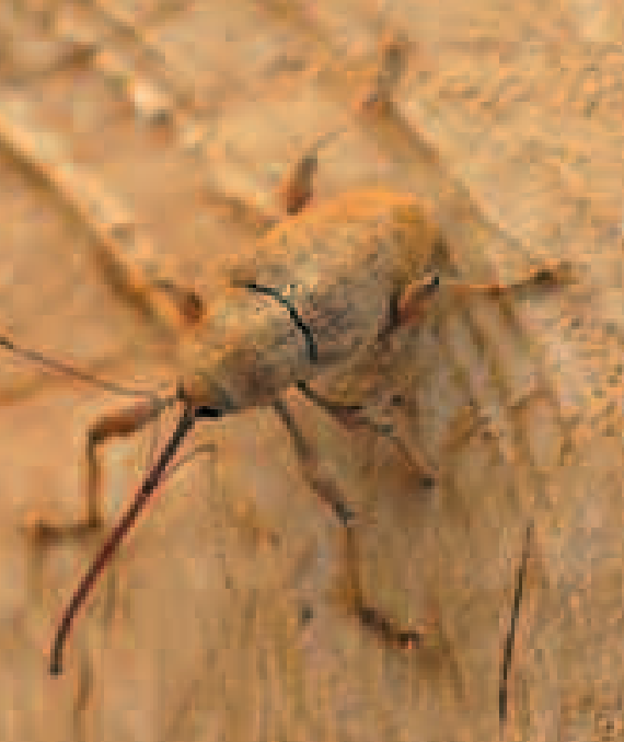
Balanin des châtaignes adulte