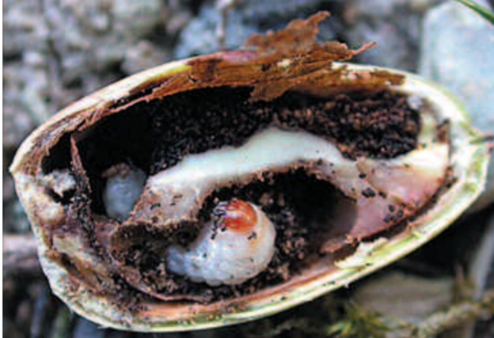
Larve du Balanin des châtaignes

destruction quasi-totale d'une génération en cas d'année catastrophique (sécheresse ou froid exceptionnels, pullulation de prédateurs, forte variation des ressources, etc.). Cette diapause prolongée est donc probablement inscrite dans le génome comme un avantage adaptatif, en particulier à des variations environnementales irrégulières.