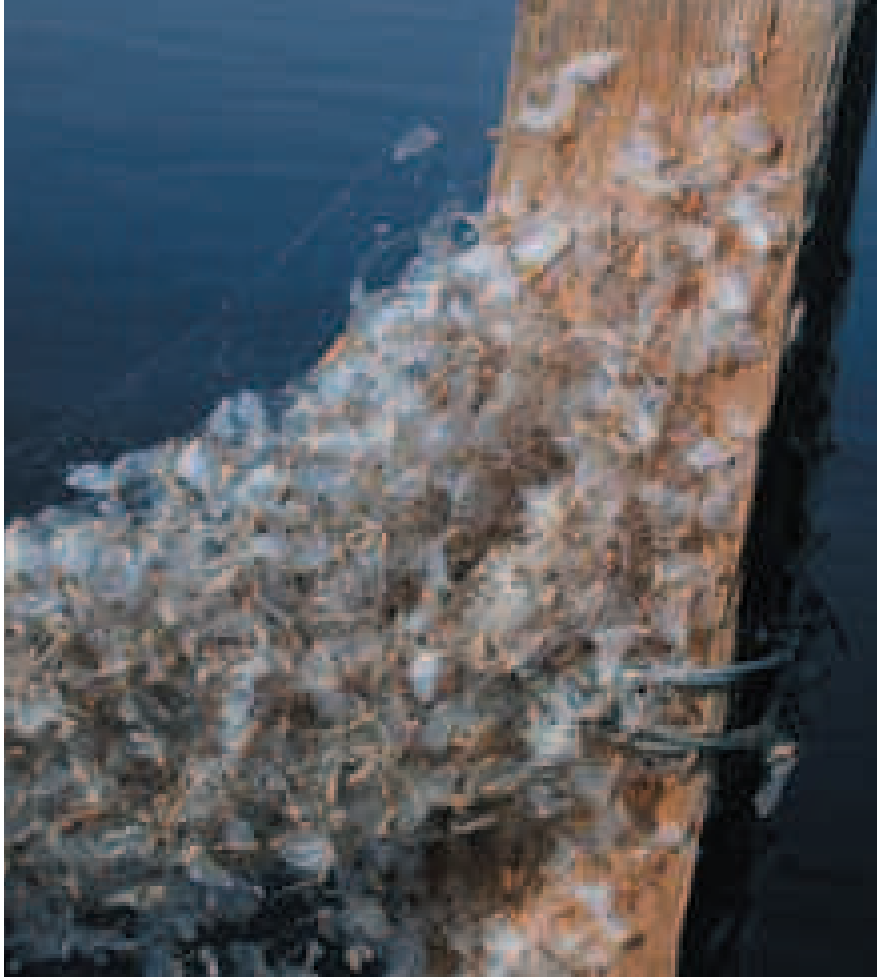
Durée de vie réelle et théorique : ces éphémères ( Ephoron sp.) sont venues en masse se prendre dans les rets d'une araignée.

De la sortie de l'œuf à l'âge adulte, les insectes se développent en subissant une série de transformations. Il en est qui naissent avec une apparence proche de celle des adultes (comme chez les Perce-oreilles ou les Mantes religieuses), la succession de mues modifiant peu leur apparence. Chez d'autres, la larve est très différente de l'adulte qui apparaît à l'issue d'une transformation complète ou nymphose (l'asticot et la mouche, la chenille et le papillon). Au cours de ces différents cycles, le développement peut s'interrompre à chaque étape, avant comme après la sortie de l'œuf. Si les conditions extérieures ne leur sont plus favorables (baisse de la température ou de l'hygrométrie), les insectes entrent en quiescence : en dessous de certains seuils, leur activité métabolique s'arrête et ne reprendra que lorsque ces seuils seront à nouveau franchis. La quiescence n'est pas obligatoire. En revanche, la diapause est une étape incontournable du développement. Elle est marquée par une inactivité apparente car l'activité métabolique n'est pas interrompue. L'insecte vit sur ses réserves et doit achever certaines phases de son développement pour en sortir. La diapause introduit une discontinuité qui répond à une nécessité (variabilité) saisonnière et prévisible : résister à l'hiver, "naître" ou "renaître" lorsque