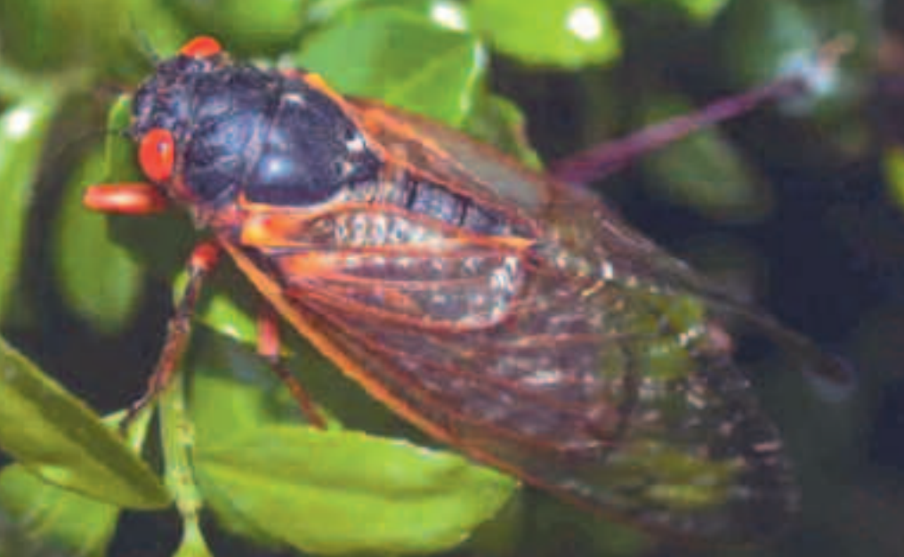
La cigale "périodique" américaine Magicicada septemdecim émerge en masse tous les 17 ans. - Cliché P. Jolivet

de partenaire sexuel. Autant de phénomènes qui, dans certaines limites, allongent ou abaissent la durée du cycle et influent, par conséquent, sur le nombre de générations que peut développer une espèce par an (ou voltinisme).