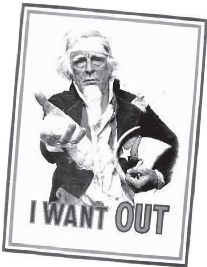
I want out

Así como existe un París de Proust, un Dublin de Joyce y un Buenos Aires de Borges, existe un Bogotá de José Asunción Silva. Este grandioso poeta no tiene una biografía, sino una leyenda.