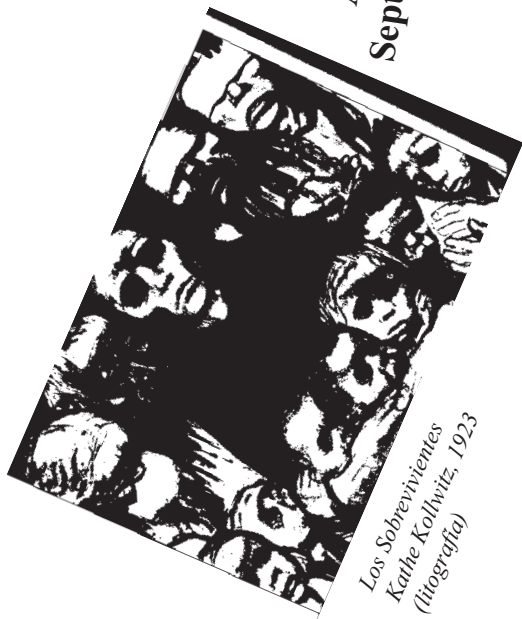
Los Sobrevivientes Kathe Kolhwitz, 1923 (litografía)

Año 2 - Número 7 Septiembre-Octubre del 2006..