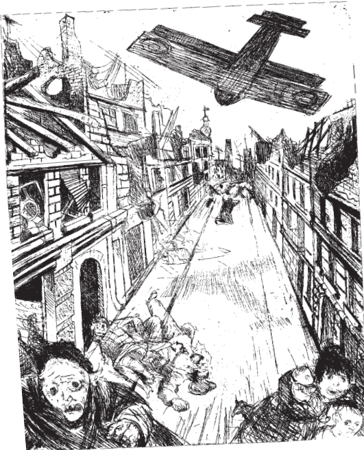
El bombardeo de Lens Aguatinta de Otto Dix (1924)

¿Tendremos un día una cultura que sepa proteger al hombre de su sufrimiento en lugar de limitarse a consolarlo? (Elio Vittorini)