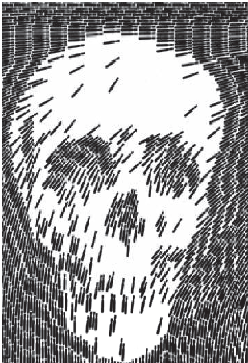
¿No más! Shigeo Fukuda (1968)