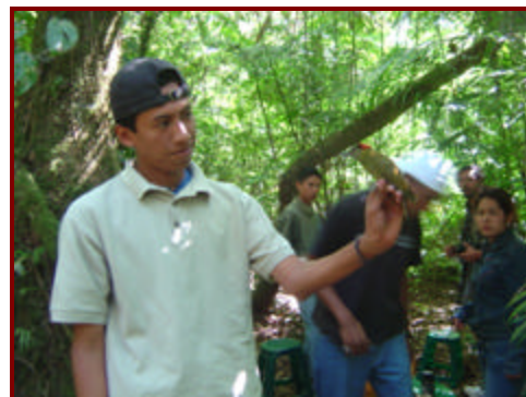
Parte de los monitoreos de aves que se realizan en la RNVM gracias al apoyo de Shell-Nicaragua.