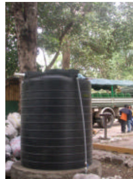
Foto del tanque receptor de agua recién instalado en parque de la RNVM.

Con la instalación de un sistema de abastecimiento de agua potable, proveniente de pilas que son alimentadas por pozos artesianos, la Administración de la RNVM mejoró sustancialmente el servicio de agua para uso de las letrinas aboneras, riego de los jardines y otras necesidades.