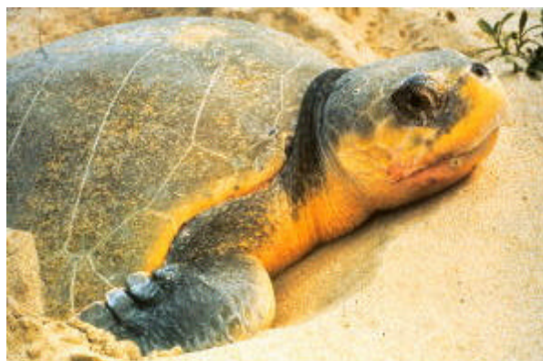
Lepidochelys olivacea , la tortuga Paslama que arriba en el RVS La Flor

El consolidado al 31 de diciembre 2004 consigna un total de 69,913 tortugas anidantes entre solitarias y en arribada. En el mismo informe se reportaron nacimientos de tortuguillos hasta por un total de 767,274, siendo la meta un millón para finales del mes de febrero.