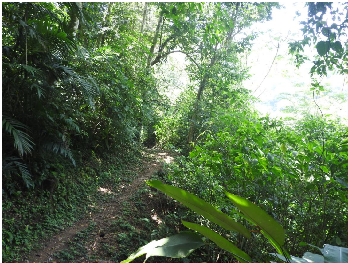
Figura 1: Vista parcial del sitio donde se recolectó el espécimen de Dorynota (Akantaka) sexplagiata en el Ejido La Candelaria, Huimanguillo, Tabasco.

El ejemplar se identificó por comparación consultando el trabajo de Champion (1893) (Tab. 8, Fig. 6, 6a, citada como Batonota sexplagiata Wag.), Maes et al. (2016) y López-Pérez et al. (2020) que presentan ilustraciones de la misma, y siguiendo la clave de Borowiec (2005) para especies de Akantaka . El ejemplar se depositó en la colección entomológica CSAT del Colegio de Postgraduados, Campus Tabasco.