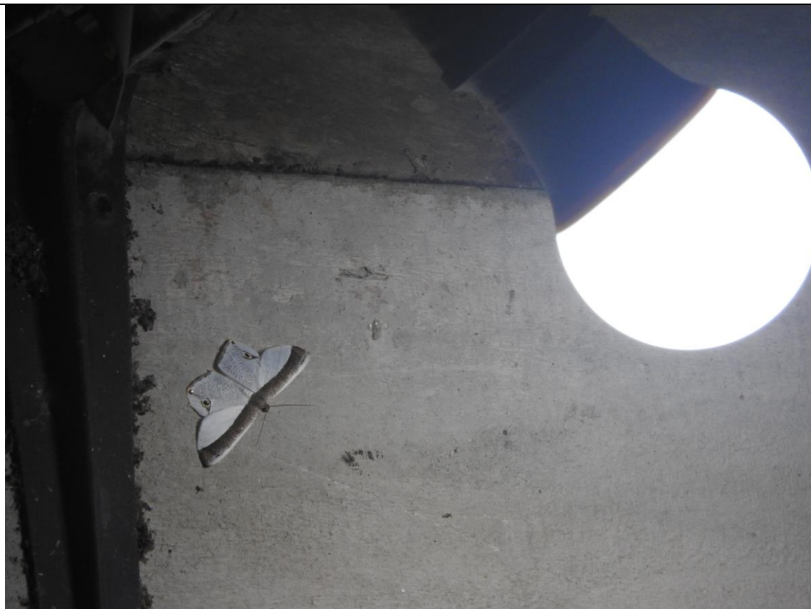
Figura 2: Adulto de Opisthoxia amabilis posado en la parte externa de la pared de una vivienda en el poblado Villa de Guadalupe, Huimanguillo, Tabasco. (Foto: Saúl Sánchez Soto).

Aunque el presente registro fue casual, basado en un solo individuo, al igual que el registro de Almolonga, Veracruz, y Xilitla, San Luis Potosí (iNaturalist, 2026), probablemente este geométrido es un habitante común en la Reserva Ecológica de Agua Selva. Es una especie considerada común en Coatepec, Veracruz (Druce, 1892), y en el Área de Conservación Guanacaste se tienen 102 registros de la misma (Araya, 2023).