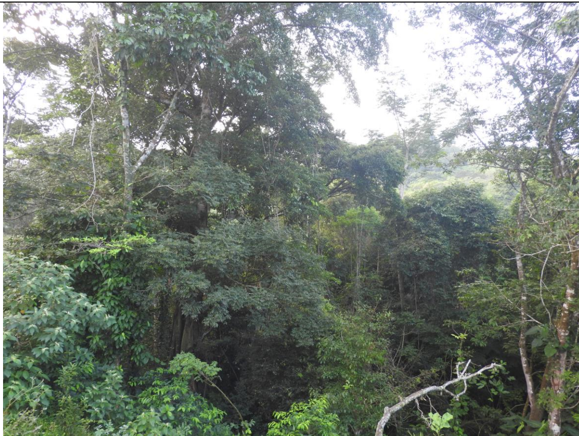
Figura 1: Vista parcial del relicto de selva alta perennifolia adyacente al sitio donde se recolectó el adulto de Opisthoxia amabilis en el Poblado Villa de Guadalupe, Huimanguillo, Tabasco. (Foto: Saúl Sánchez Soto).