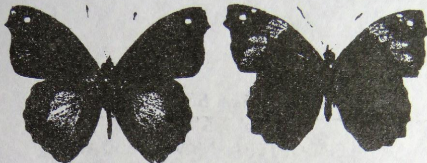
Figuras : macho y hembra de Epiphile oreia ssp. plusios GODMAN & SALVIN.

La especie Epiphile oreia HUBNER es conocida desde Costa Rica hasta Argentina. Se reporta por primera vez de Nicaragua, lo que aumenta un poco al norte la distribución de esta especie.