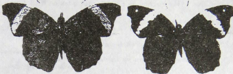
Figuras : macho y hembra de Epiphile adrasta ssp. adrasta HEWITSON.

Epiphile adrasta ssp. adrasta HEWITSON, 1861.