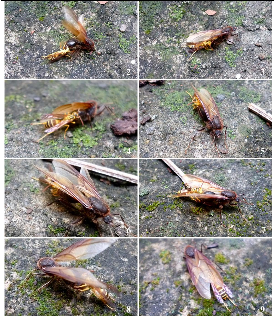
Figuras 2-9: 2. Agelaia multipicta sujetando con sus patas delanteras a Atta sp.; la hormiga desaceleró (30/04/2022). 3-4. Agelaia multipicta sujetando con sus patas delanteras y una pata media (la otra en el suelo) a Atta sp., la hormiga aceleró (30/04/2022). 5-8. Agelaia multipicta sujetando con sus patas delanteras y patas medias a Atta sp., la hormiga caminando sin detenerse (30/04/2022). 9. Patas traseras de Agelaia multipicta totalmente estiradas (30/04/2022). Tiempo transcurrido en la observación: 1 min.