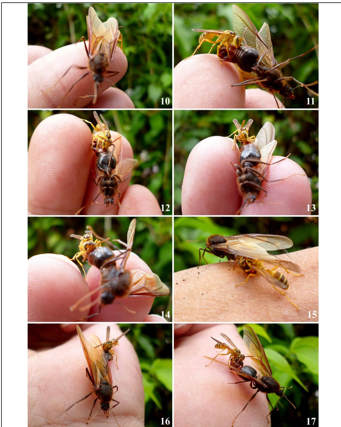
Figuras 10-17: 10. Atta sp. con Agelaia multipicta , detrás (30/04/2022). 11-14. Agelaia multipicta sujetando a Atta sp. (30/04/2022). 15. Atta sp. desacelerando en el borde de una mano y Agelaia multipicta cortándole el abdomen (30/04/2022). 16-17. Instantes previos al alce de vuelo de Agelaia multipicta con un fragmento de abdomen de Atta sp. (30/04/2022). Tiempo transcurrido en la observación: 4 min.