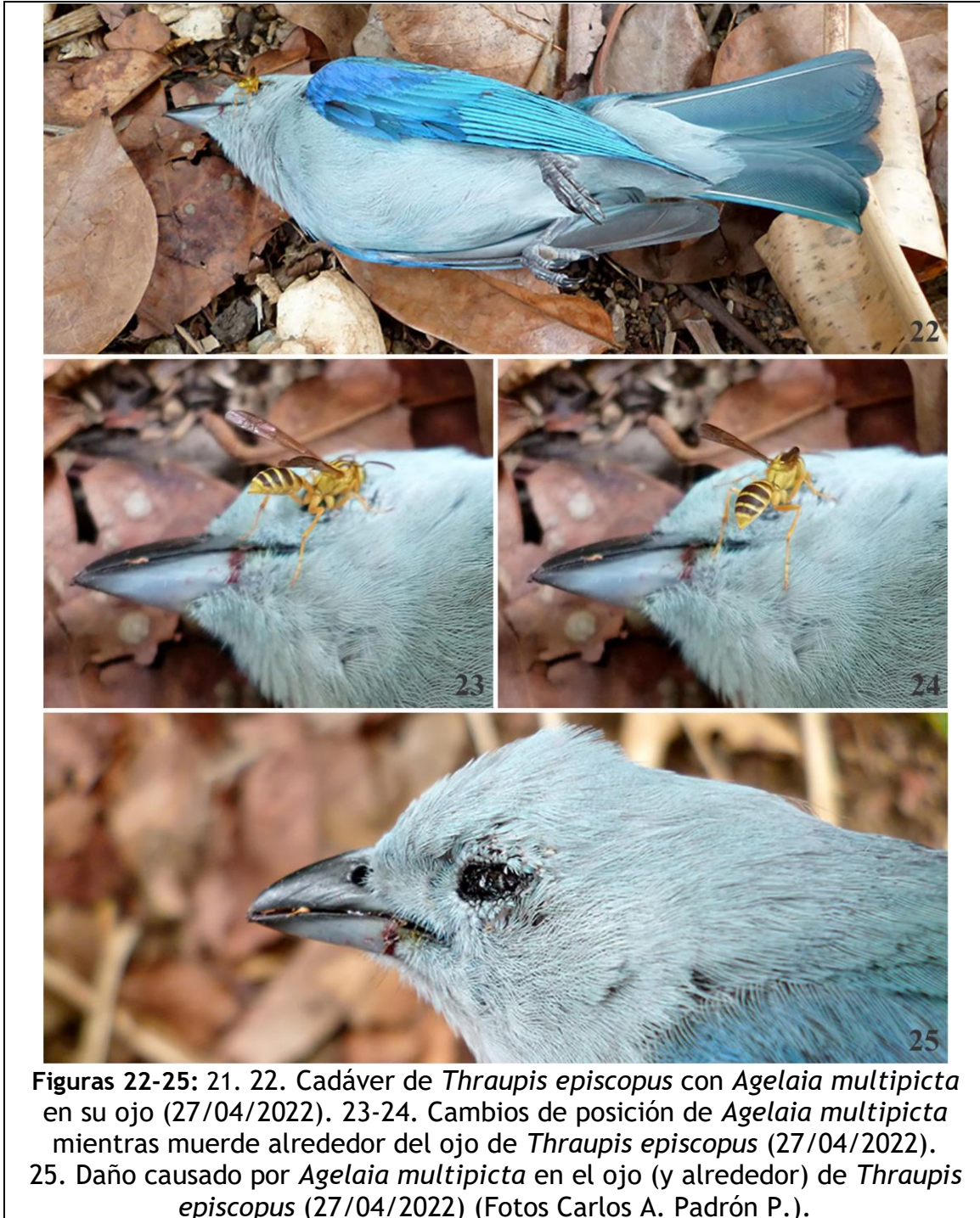
Figuras 22-25: 21. 22. Cadáver de Thraupis episcopus con Agelaiia multipicta en su ojo (27/04/2022). 23-24. Cambios de posición de Agelaiia multipicta mientras muerde alrededor del ojo de Thraupis episcopus (27/04/2022). 25. Daño causado por Agelaiia multipicta en el ojo (y alrededor) de Thraupis episcopus (27/04/2022).

A las 14:11 h la hormiga fue colocada sobre la rama de una planta enredadera del género Mansoa y la dificultad de agarre hizo que moviera sus patas un poco más (Figura 20), no obstante, no logró asirse de la rama y finalmente a las 14:12 h, fue colocada sobre una hoja y allí permaneció tranquila (Figura 21).