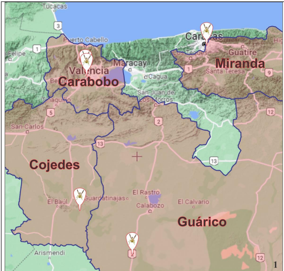
Figura 1. Registros sobre la distribución geográfica de Agelaiia multipicta en Venezuela (Mapa elaborado con los softwares Scribble Maps, CorelDRAW X8, Photoshop CC 2018 y una fotografía de Agelaiia multipicta ).

Con relación a los hábitos alimentarios de Agelaiia multipicta (Haliday, 1836) (Vespidae: Polistinae), Hunt (1991) ha señalado que literatura relevante sobre los hábitos alimentarios de las avispas adultas en el subclado Aculeata es fragmentaria y en gran medida anecdótica, y que ningún adulto, en un sentido estricto, es herbívoro, detritívoro o incluso carnívoro. No obstante, afirma con seguridad, basado en la anatomía interna de componentes del tracto alimentario, que de manera general, el néctar, los líquidos similares al néctar y los fluidos corporales de presas o carroña son las fuentes típicas, y casi exclusivas, de alimentación de los adultos. Una de las principales fuentes de alimento de A. multipicta es la carroña de vertebrados (White & Starr 2013).