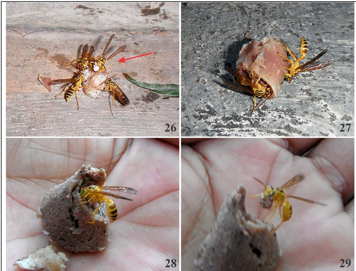
Figuras 26-29: 26. Grupo de avispas de Agelaia multipicta extrayendo carne de un trozo de pollo cocido; la flecha roja señala a una que lo extrajo y luego se fue volando (26/12/2021). 27. Un individuo de Agelaia multipicta recolectando carne cocida adherida en la parte externa de un hueso de pollo y otro recolectando médula de la parte interna (26/12/2021). 28. Individuo de Agelaia multipicta extrayendo médula de un hueso de pollo (26/12/2021). 29. Individuo de Agelaia multipicta alzando su vuelo con un trozo de médula de un hueso de pollo entre sus mandíbulas (26/12/2021).

No hay registros de avispas del género Agelaia como necrófaga de aves, y en tal sentido, seguidamente se documenta el hallazgo. La avispa sobre el cadáver de Thraupis episcopus (Figura 22), mordía repetidamente el ojo (y alrededor) y cambiaba rápidamente de posición para seguir mordiendo (Figuras 23-24), lo hizo durante 1 min y luego se fue volando sin nada de tejidos del ave en sus mandíbulas; se presume obtuvo fluidos del ojo. En la manipulación del cadáver del ave se pudo evidenciar algo de sangre en su pico, su cuerpo estaba tibio y sin signos de instauración del rigor mortis , por lo que tenía pocos minutos de haber muerto por alguna causa que se desconoce. El único daño que mostró su cuerpo durante la manipulación fue el causado por la avispa en un ojo (Figura 25).