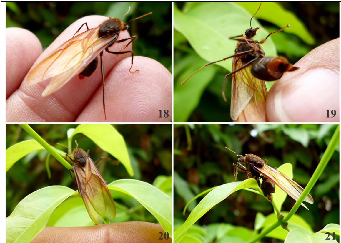
Figuras 18-21: 18. Atta sp. luego de ser depredada por Agelaia multipicta ; no mostrando signos de alteración (30/04/2022). 19. Atta sp. con su abdomen cortado y mostrando algunos signos de alteración (30/04/2022). 20. Atta sp. con dificultad para asirse a una rama (30/04/2022). 21. Atta sp. sin signos de alteración (30/04/2022). Tiempo transcurrido en la observación: 2 min.

Seguidamente con movimientos de los dedos, a las 14:07 h ya se había logrado que la hormiga caminara en la mano con la avispa todavía sujetándola en el abdomen (Figura 15). El minuto siguiente, la hormiga luego de caminar por toda la mano se detuvo en un borde de la palma y acto seguido la avispa terminó de cortar con sus mandíbulas casi la mitad del abdomen de la hormiga y alzó su vuelo con el fragmento de abdomen (Figuras 16-17). Es de hacer notar, que durante todo el evento de depredación en el suelo y en la mano, la avispa no se detuvo un instante en su actividad cortando el abdomen de la hormiga.