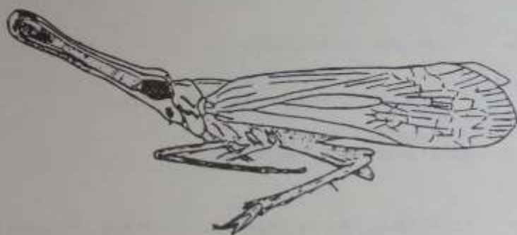
Fig. 1. Lappida gracilis MELICHAR. (Colección Museo Entomológico, S. E. A.).