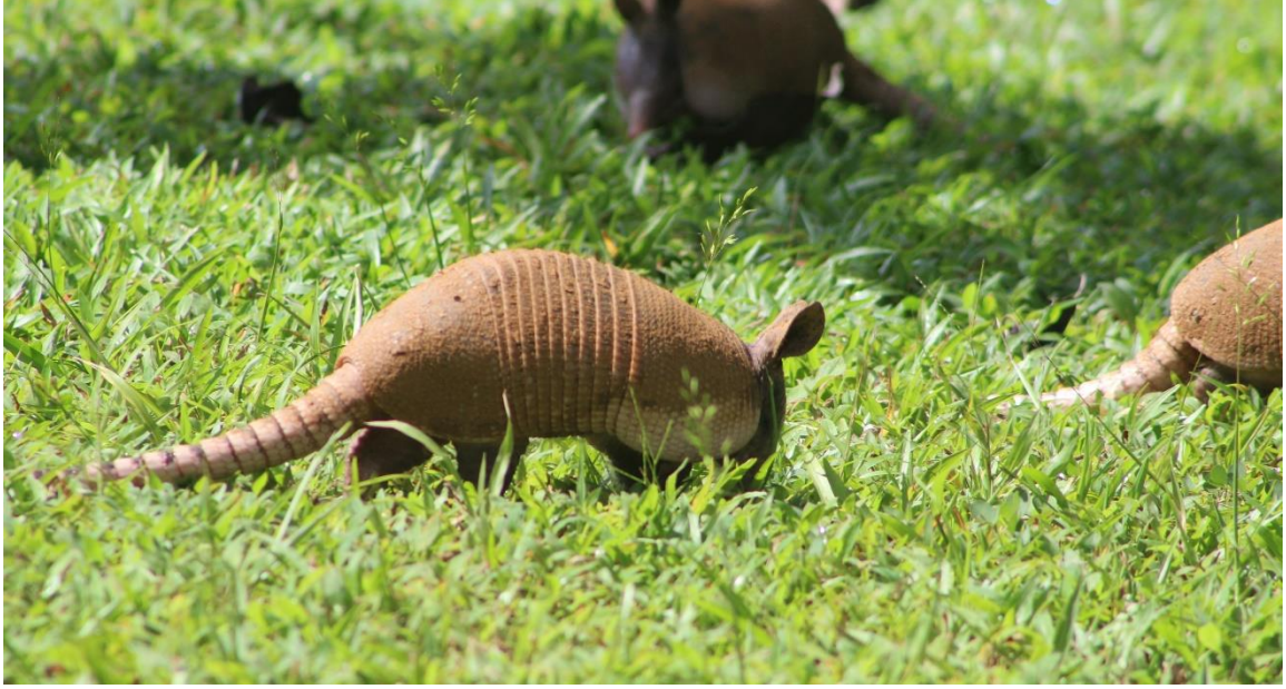
Figura 6. Armadillo de nueve bandas ( Dasypus novemcinctus ).