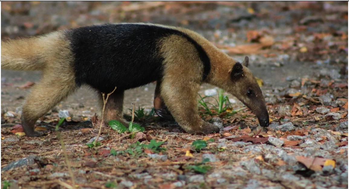
Figura 5. Hormiguero ( Tamandua mexicana ).