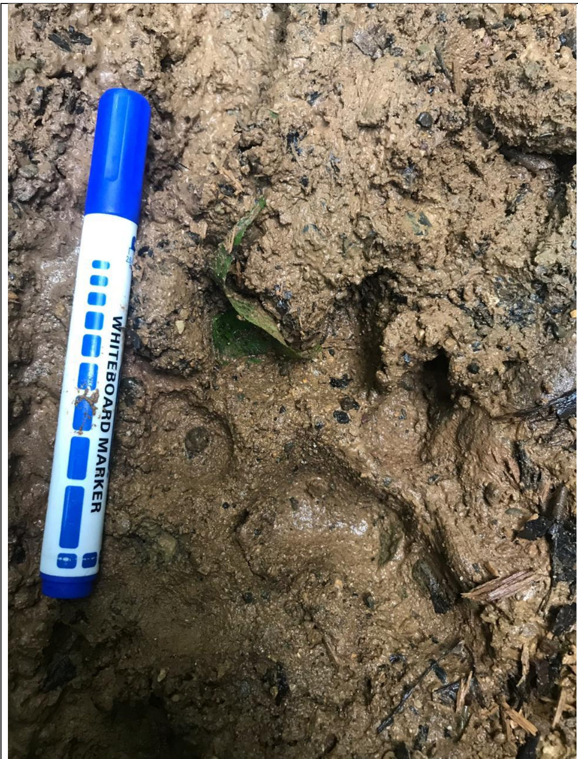
Figura 10. Huella de Ocelote ( Leopardus pardalis ).