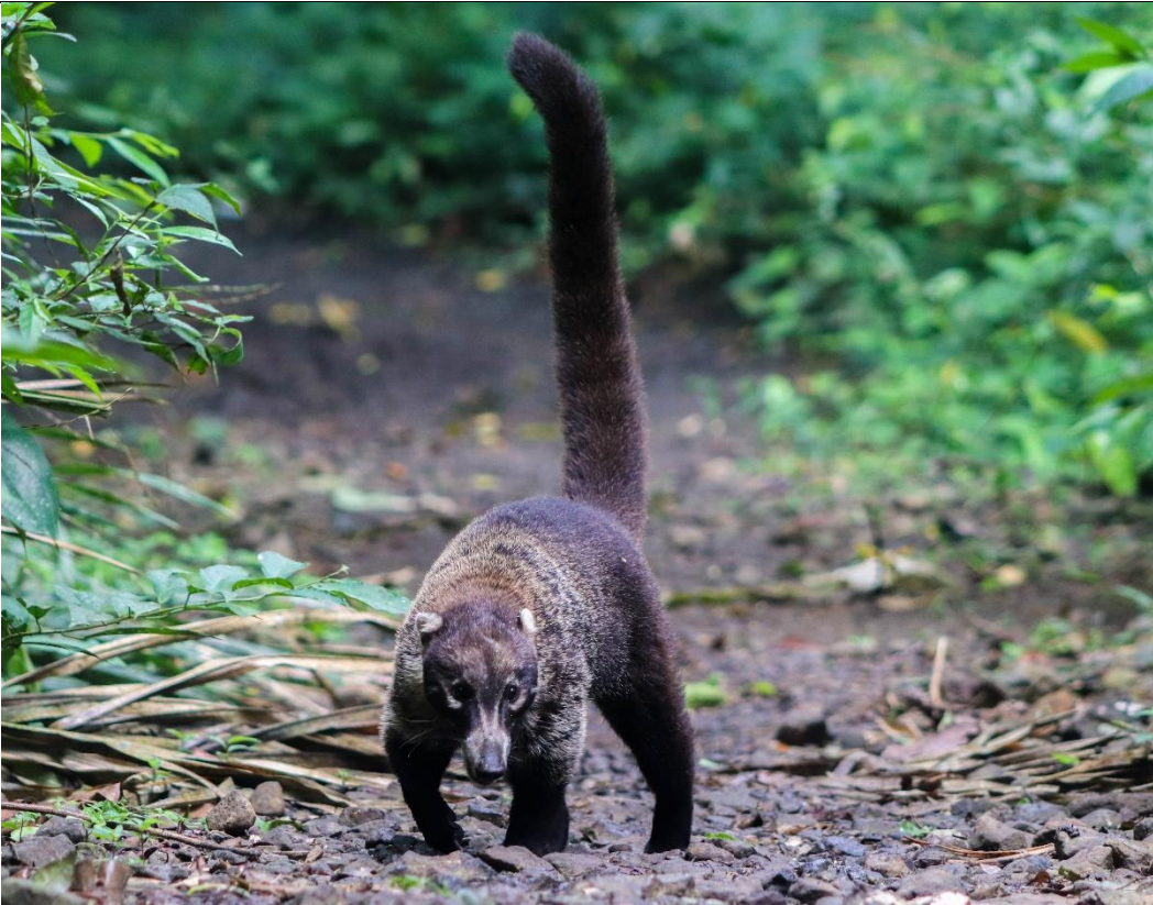
Figura 7. Gato solo ( Nasua narica ).