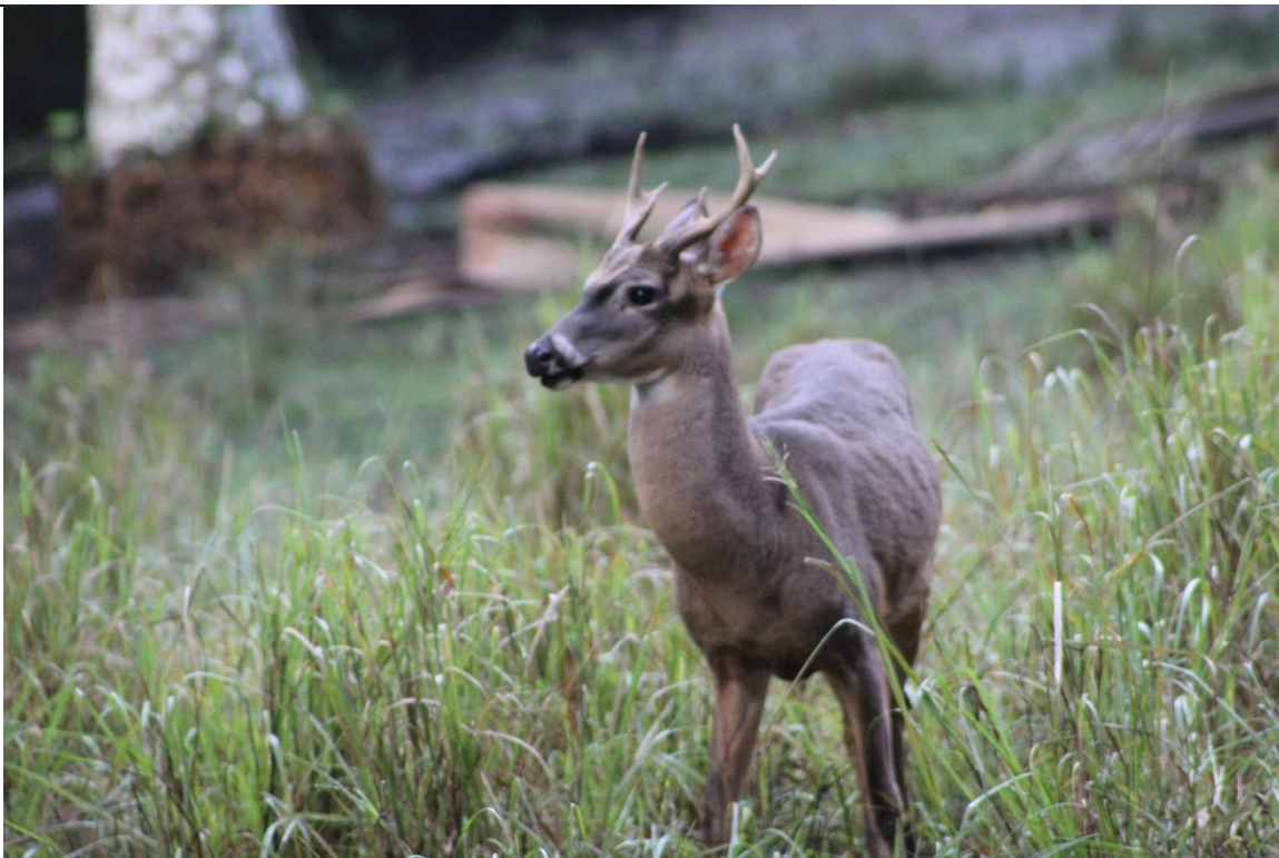
Figura 9. Ciervo cola blanca ( Odocoileus virginianus ).