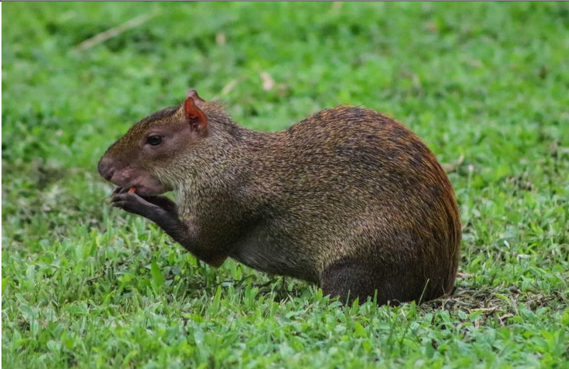
Figura 3. Ñeque ( Dasyprocta punctata ).

*Ordenes, familias y nombres científicos según Reid (2009).