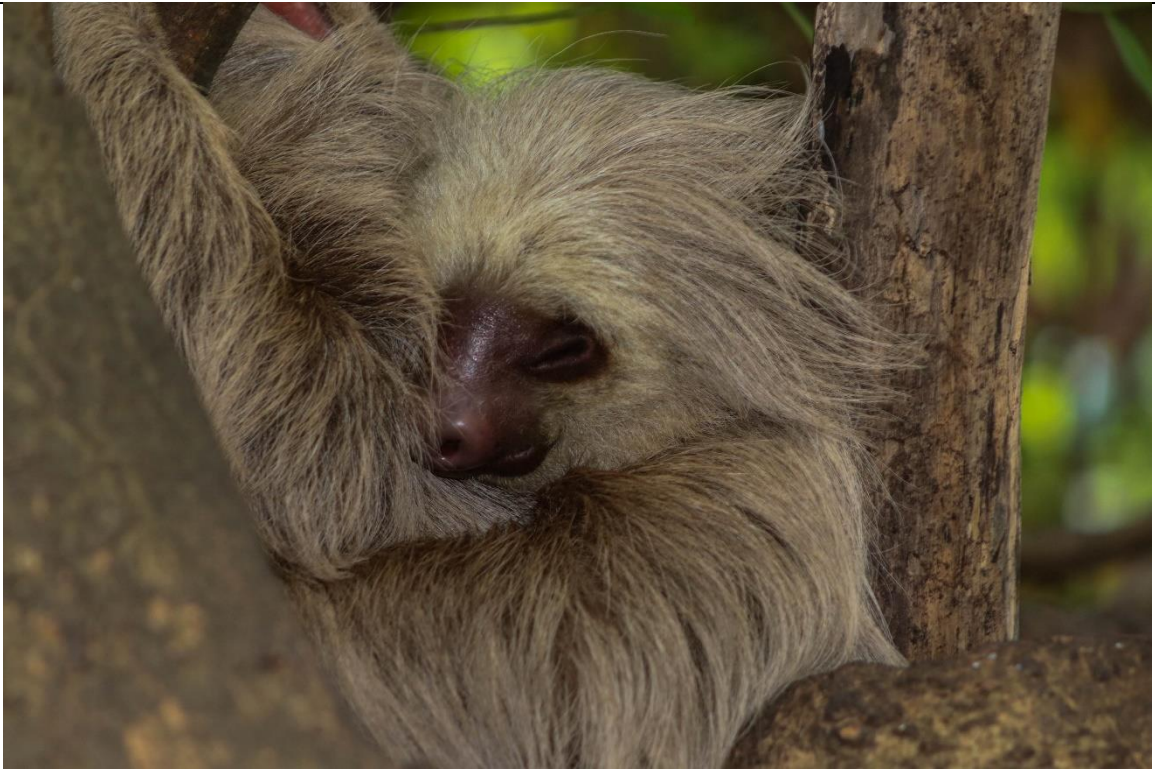
Figura 4. Perezoso de dos garras ( Choloepus hoffmani ).