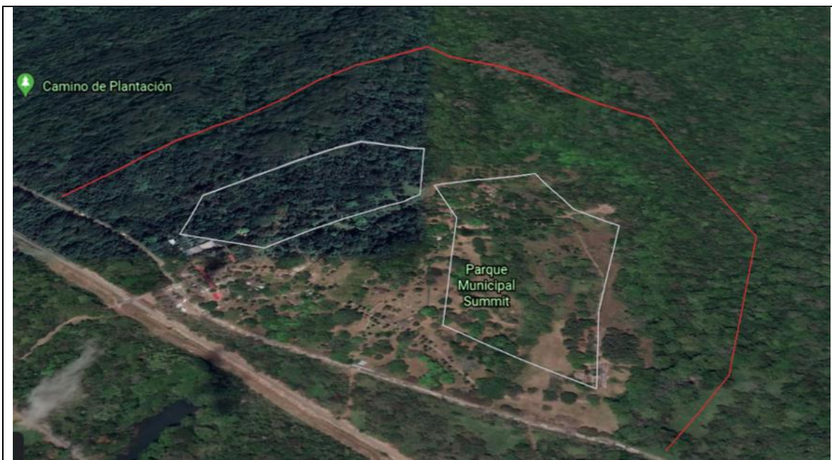
Figura 2. Vista panorámica del Parque Municipal Summit. Rojo: proximidad de los terrenos pertenecientes al parque, blanco: zonas de mayor recorridos y registro de las especies). (Elaborado con el programa Google Earth el 13 de julio, 2020).

El registro de las especies se realizó mediante recorridos diurnos y nocturnos en dos diferentes zonas del parque, una caracterizada por presentar una zona boscosa de tipo bosque secundario y una zona abierta de poca vegetación cubierta principalmente por pasto ( Saccharum spontaneum ), cercano a esta una pequeña fuente de agua (río) (Fig. 2).