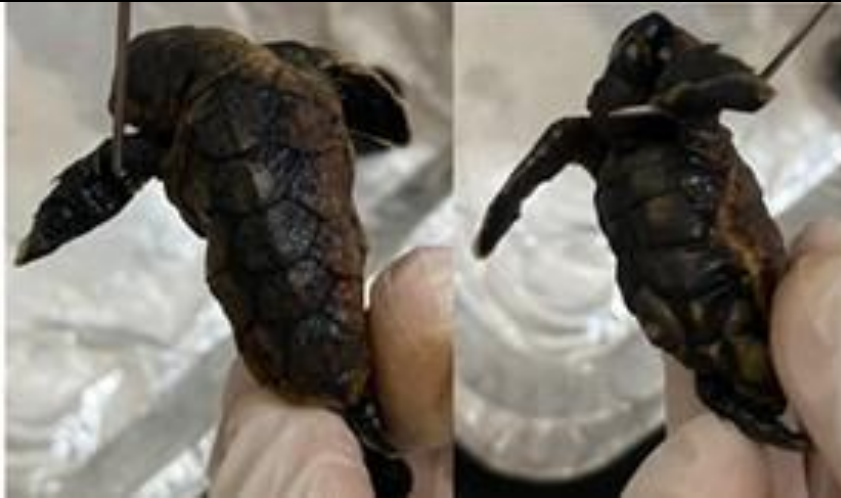
Figura 5. Neonato E. imbricata con caparazón y plastrón comprimido.