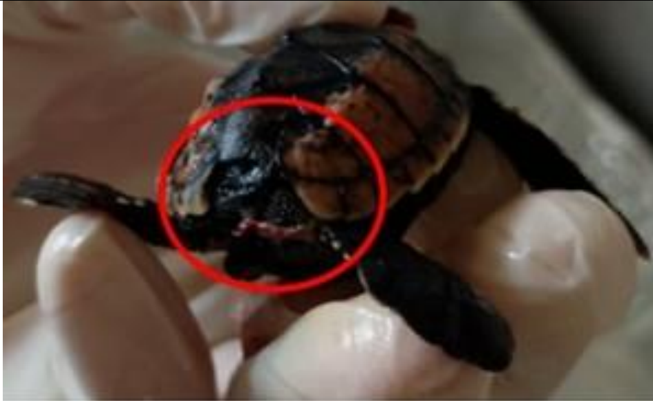
Figura 3. Neonato de E. imbricata con leucismo y placas infranumerarias.

Caparazón y plastrón comprimido: Problema en el cual parte o todo el caparazón se ve aplastado o doblado (Alcalá Gelves, 2023) (ver figuras 4 y 5).