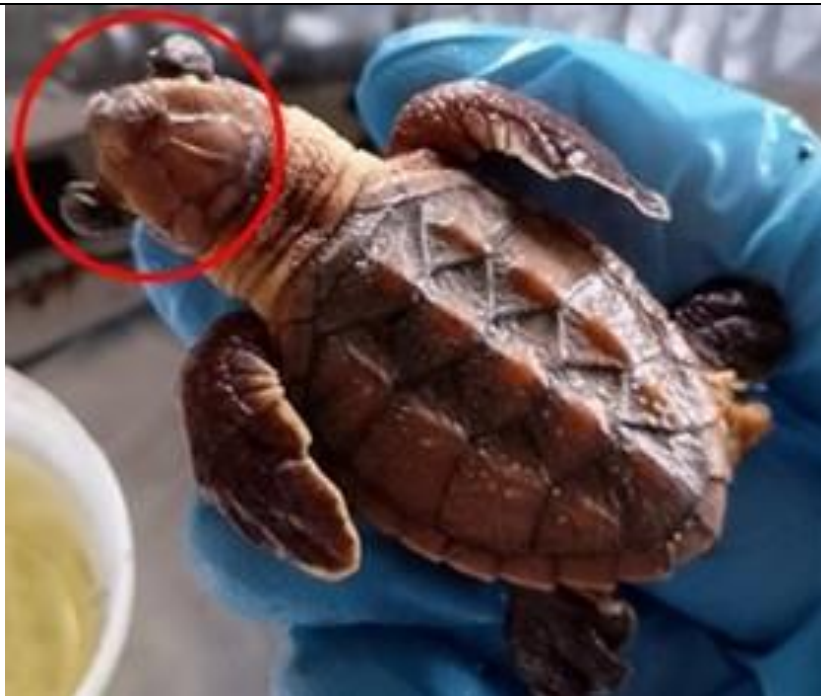
Figura 6. Neonato de E. imbricata con exoftalmos (foto © Josué David Portillo Sierra).