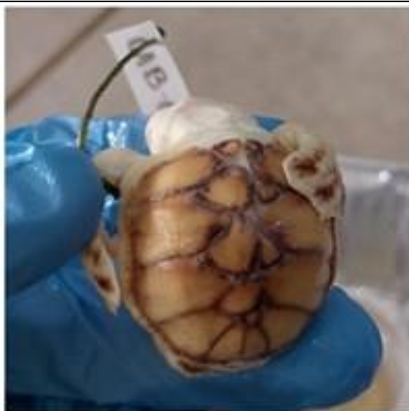
Figura 2. Neonato no identificable con leucismo y distribución anormal del caparazón.

Leucismo: Es una condición congénita que presenta decoloración de ciertas partes del cuerpo (hipopigmentación), relacionada con alteraciones en la diferenciación y/o migración de las células pigmentarias durante el desarrollo, lo que produce aberraciones cromáticas (Van Grouw, 2013) (ver figuras 2 y 3).