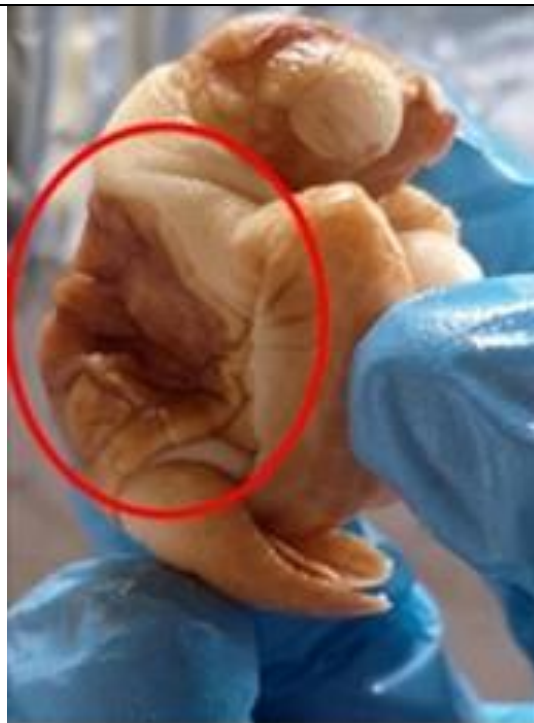
Figura 4. Neonato no identificable con leucismo, exoftalmos y caparazón y plastrón comprimidos.

Caparazón y plastrón comprimido: Problema en el cual parte o todo el caparazón se ve aplastado o doblado (Alcalá Gelves, 2023) (ver figuras 4 y 5).