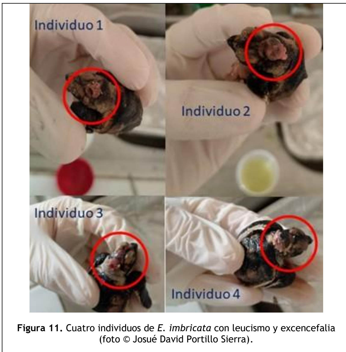
Figura 11. Cuatro individuos de E. imbricata con leucismo y exencefalia.

Metaplasia del caparazón: Una parte del tejido no se terminó de especializar (probablemente provocado por el reemplazo de células) (Alcalá Gelves, 2023) (ver figura 8).