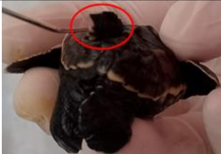
Figura 9. Neonato E. imbricata con leucismo y polimelia en el caparazón (quinta aleta sobresaliendo del último escudo costal izquierdo) (foto © Josué David Portillo Sierra).