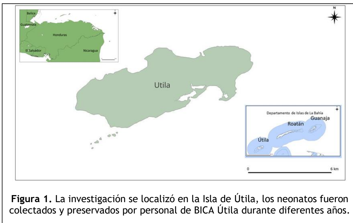
Figura 1. La investigación se localizó en la Isla de Útila, los neonatos fueron colectados y preservados por personal de BICA Útila durante diferentes años.

La investigación se localizó en la Isla de Útila, los neonatos fueron colectados y preservados por personal de BICA Útila durante diferentes años.