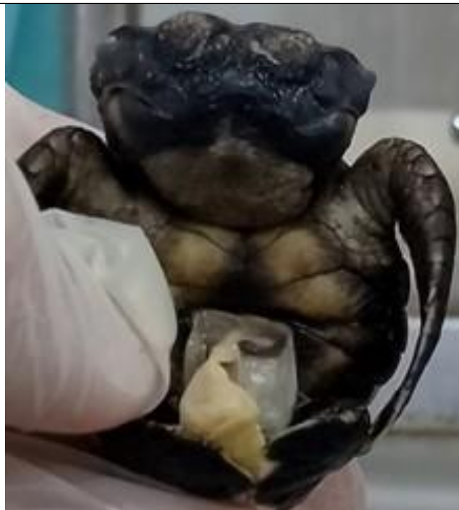
Figura 10. C. caretta con leucismo, bicefalia y capa transparente en orificio vitelino.