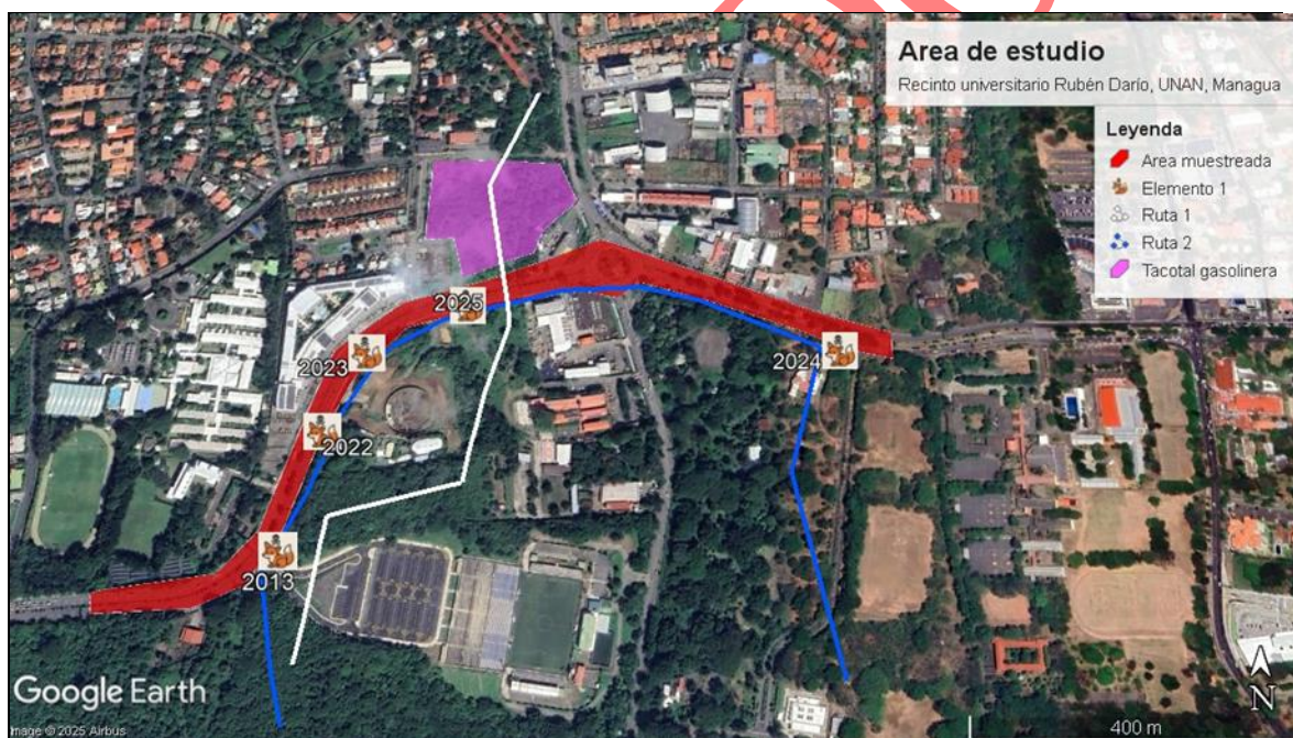
Figura 6. Señala las posibles rutas de alimentación o búsqueda de conexión ecológica (GoogleLLC, 2025).

La preferencia de estas rutas puede estar influenciada por la ausencia de perros, -al tratarse de un área comercial- y por la disponibilidad de restos comida o carroña sobre la carretera (Farias et al. , 2005).