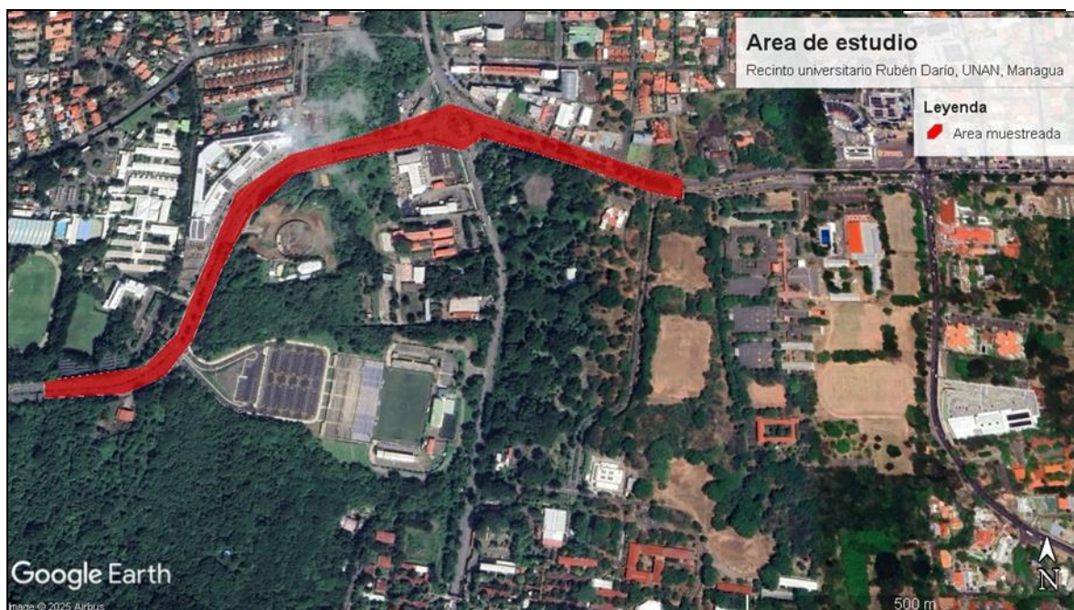
Figura 2. Áreas boscosas del recinto universitario, donde habita el Gato ostoche (GoogleLLC, 2025).