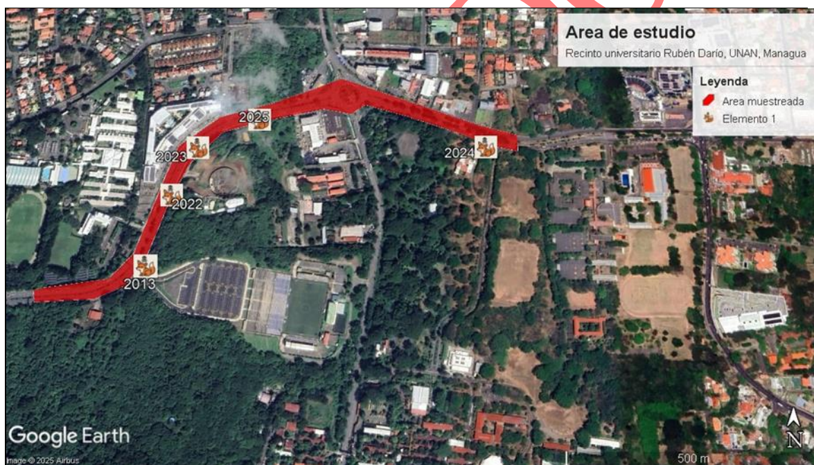
Figura 4. Muestra los incidentes de colisión de zorro ostoche (GoogleLLC, 2025).

Durante el período de estudio se registraron cinco especímenes atropellados, (2013, 2022, 2023, 2024 y 2025). Los individuos de 2013 al 2024 fueron encontrados como restos en avanzado estado de descomposición o completamente aplastados por el paso vehicular. El espécimen del año 2025 constituye el caso central del análisis