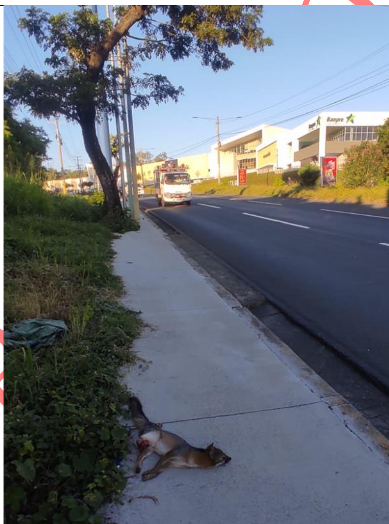
Figura 5. Especimen atropellado, en las cercanías al recinto universitario (GoogleLLC, 2025).

Entre los traumatismos se registraron lesiones extensas en la región perineal y la base de la extremidad posterior izquierda, con exposición de tejidos blandos; fracturas múltiples en ambas extremidades posteriores afectando el ilion y fémur; exposición muscular; y aplastamiento craneal severa con pérdida de un globo ocular.