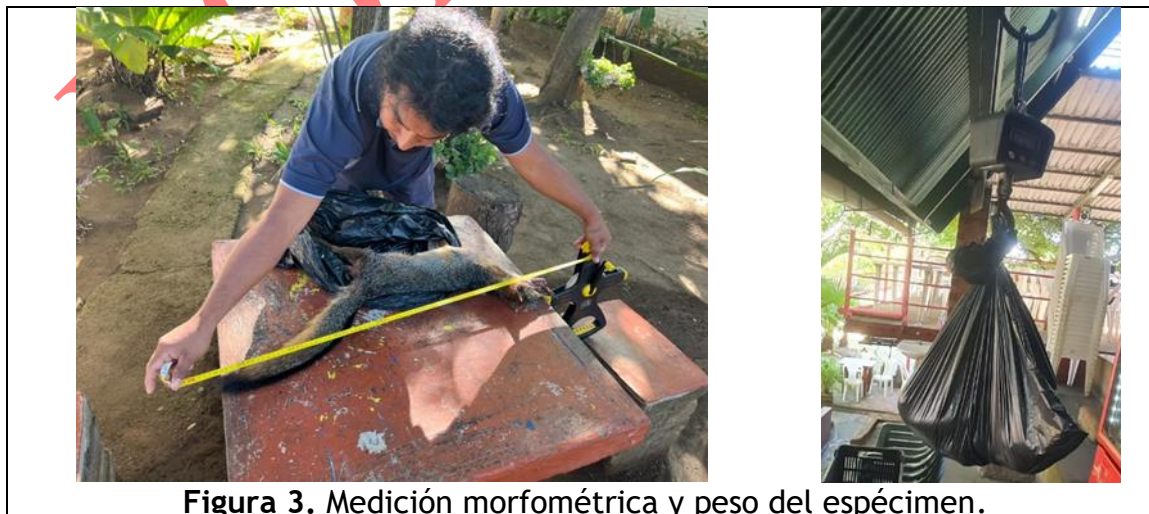
Figura 3. Medición morfométrica y peso del espécimen.

La recolección de datos se realizó mediante observaciones incidentales in situ a lo largo del tramo muestreado. Cada registro fue georreferenciado y documentado fotográficamente, garantizando su identificación taxonómica y diferenciación respecto a fauna doméstica.