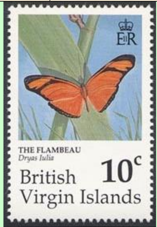
Lepidoptera : Nymphalidae : Heliconinae : Dryas iulia .