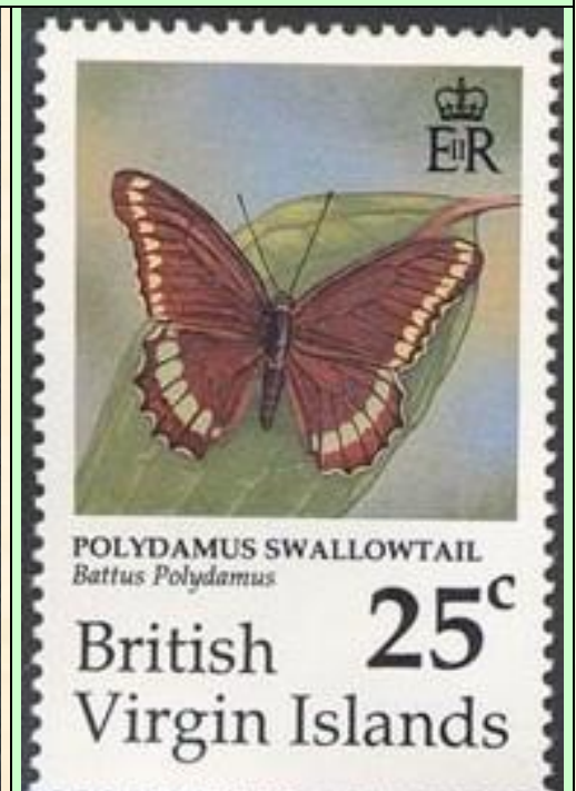
Lepidoptera : Papilionidae : Battus polydamas .