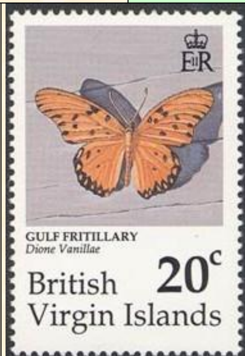
Lepidoptera : Nymphalidae : Heliconinae : Agraulis vanilla .