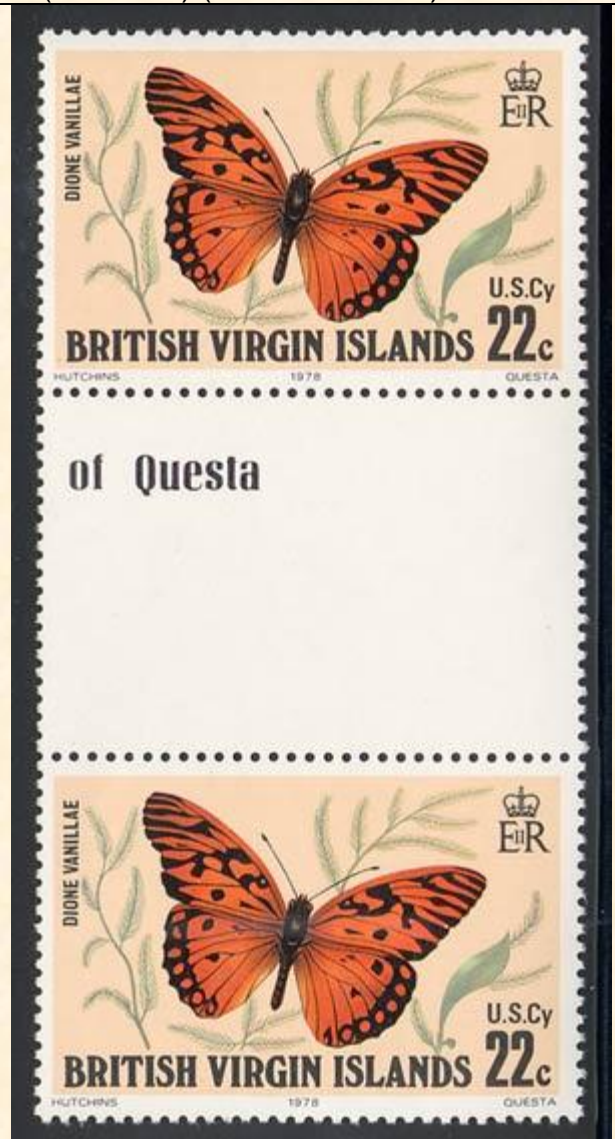
Lepidoptera : Nymphalidae : Heliconinae : Agraulis vanillae