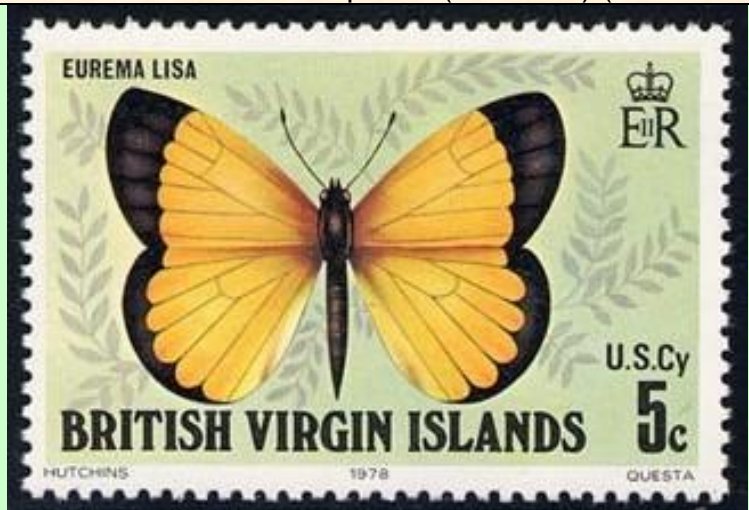
Lepidoptera : Pieridae : Eureka lisa

1978 Diciembre 4 : Mariposas (4 valores) (Scott : 342-345).