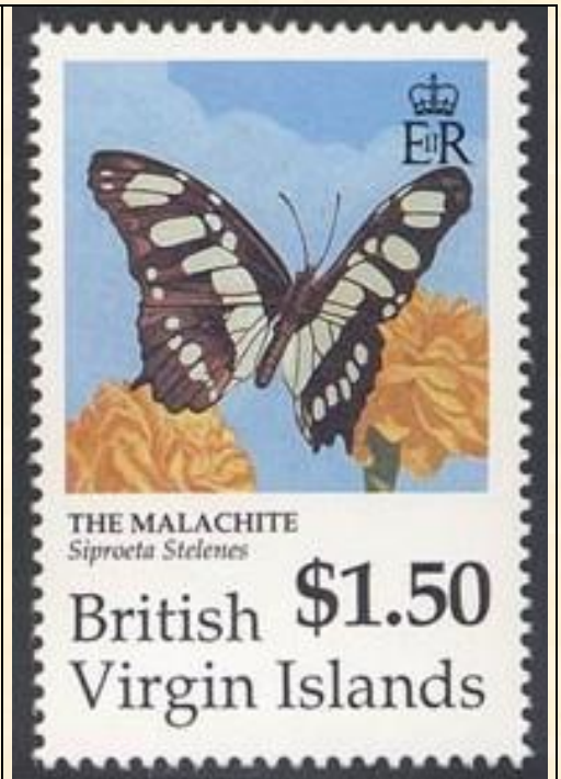
Lepidoptera : Nymphalidae : Siproeta stelenes .