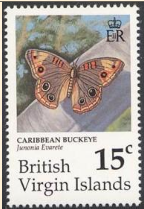
Lepidoptera : Nymphalidae : Junonia evarete .