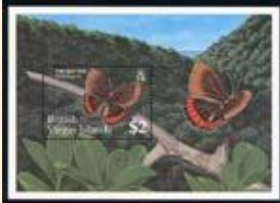
Lepidoptera : Nymphalidae : Biblis hyperia .