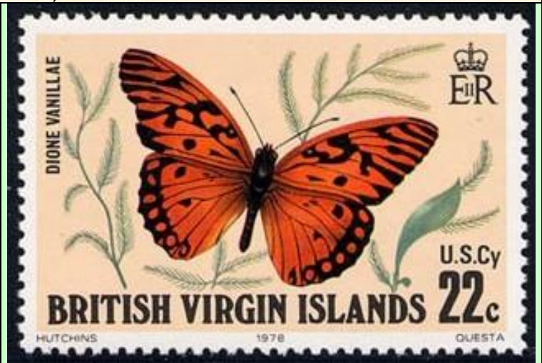
Lepidoptera : Nymphalidae : Heliconinae : Agraulis vanillae