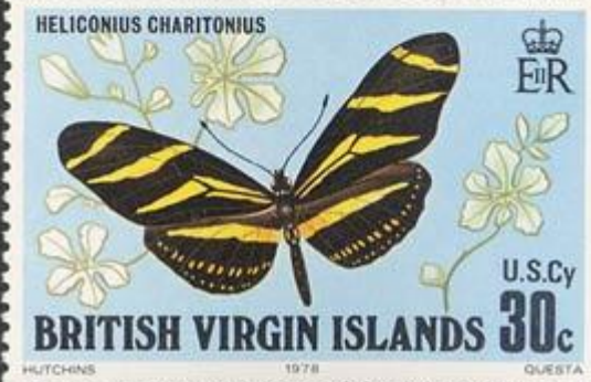
Lepidoptera : Nymphalidae : Heliconinae : Heliconius charitonius