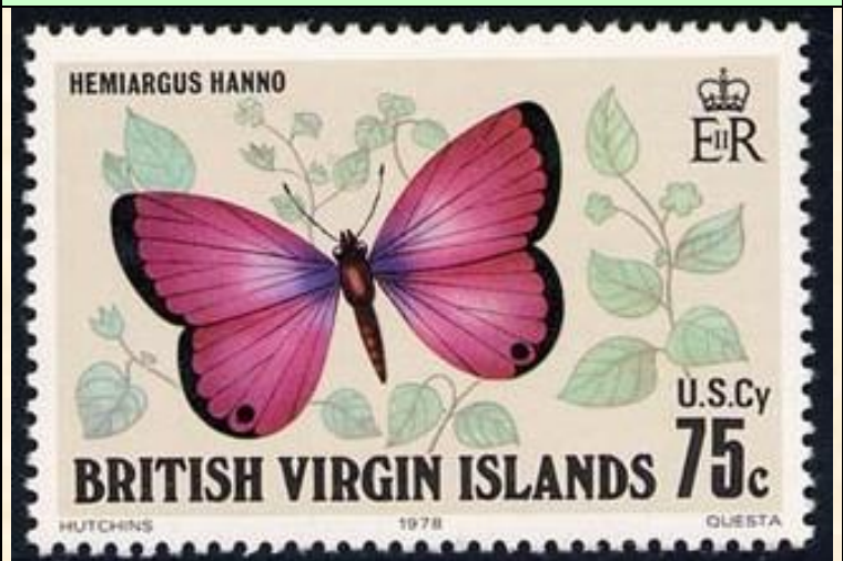
Lepidoptera : Lycaenidae : Hemiargus hanno