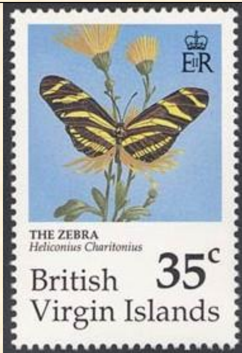
Lepidoptera : Nymphalidae : Heliconinae : Heliconius charithonius .