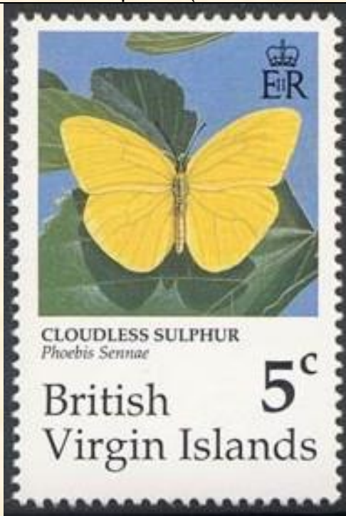
Lepidoptera : Pieridae : Phoebis sennae .

1991 Junio 28 : Mariposas (8 valores + 2 BF) (Scott : 711-718 + 719-720).