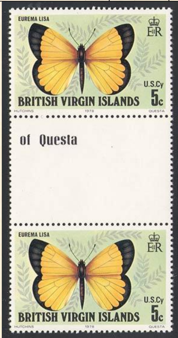
Lepidoptera : Pieridae : Eurema lisa

1978 Diciembre 4 : Idem, Mariposas, en bloques de 2 sellos (4 valores) (Scott : 342-345).