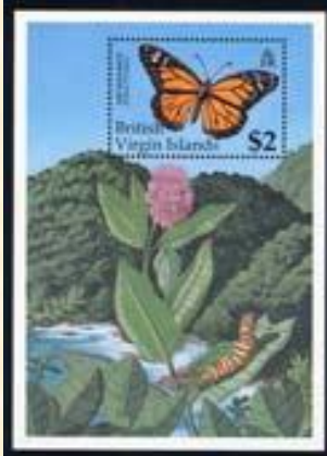
Lepidoptera : Nymphalidae : Danainae : Danaus plexippus .