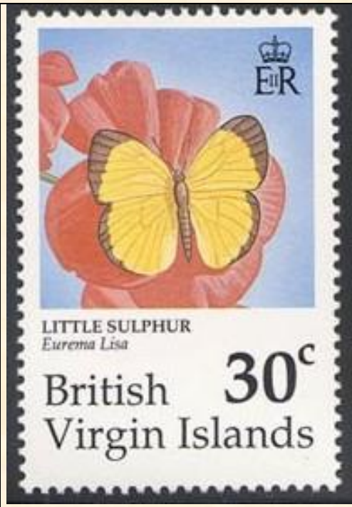
Lepidoptera : Pieridae : Eurema lisa .