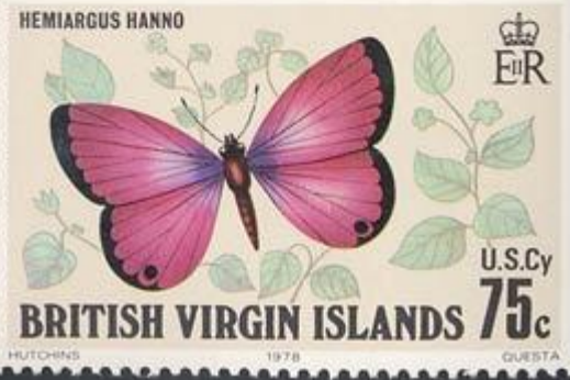
Lepidoptera : Lycaenidae : Hemiargus hanno