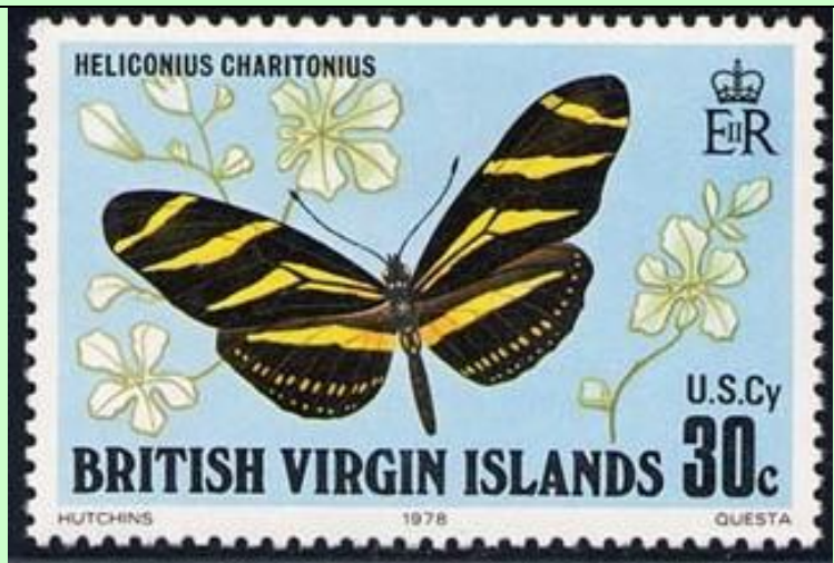
Lepidoptera : Nymphalidae : Heliconinae : Heliconius charithonius