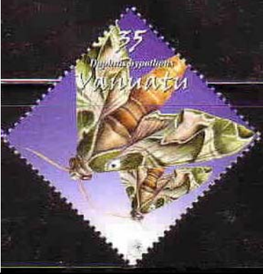
Lepidoptera : Sphingidae : Daphnis hypothous .

2003 Noviembre 26 : Lepidopteros (4 valores) (Scott : 841-844).