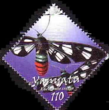
Lepidoptera : Arctiidae : Euchromia creusa .