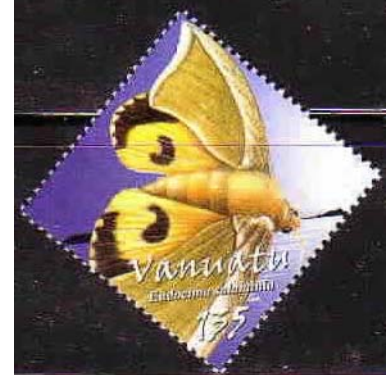
Lepidoptera : Noctuidae : Eudocima salaminia .