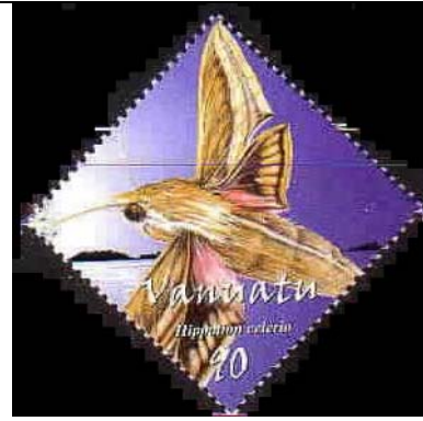
Lepidoptera : Sphingidae : Hippotion celerio .