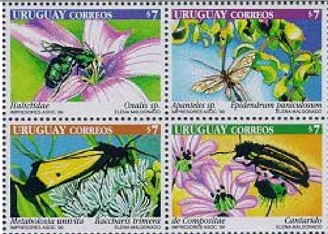
Hymenoptera : Halictidae sobre Oxalis sp. + Hymenoptera : Braconidae : Apanteles sp. sobre Epidendrum paniculosum + Lepidoptera : Arctiidae : Metabolosia univita sobre Baccharis trimera + Coleoptera : Cantharidae sobre Asteraceae.

1999 Septiembre 10 : Insectos y flores (4 valores) (Y & T : 1838-1841) (Scott : SS 1811)