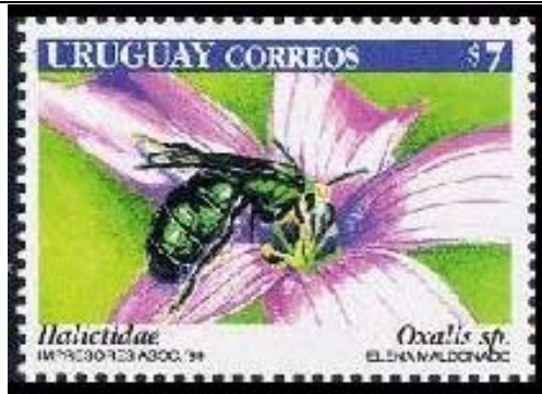
Hymenoptera : Halictidae sobre Oxalis sp.

1999 Septiembre 10 : Insectos y flores (4 valores) (Y & T : 1838-1841) (Scott : 1811 a-d).