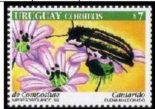
Coleoptera : Cantharidae sobre Asteraceae.

1999 Septiembre 10 : Insectos y flores (4 valores) (Y & T : 1838-1841) (Scott : SS 1811)