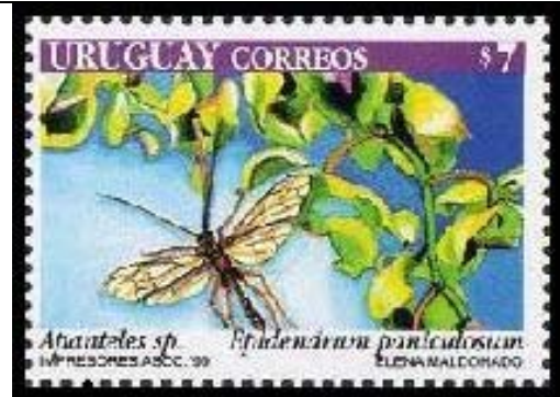
Hymenoptera : Braconidae : Apanteles sp. sobre Epidendrum paniculosum .