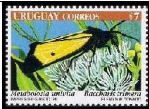
Lepidoptera : Arctiidae : Metabolosia univita sobre Baccharis trimera .