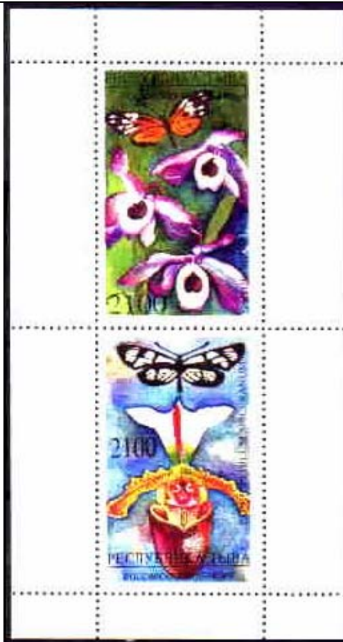
Lepidoptera : Nymphalidae : Heliconinae : Heliconius sp. + Lepidoptera : Nymphalidae : Ithomiinae.