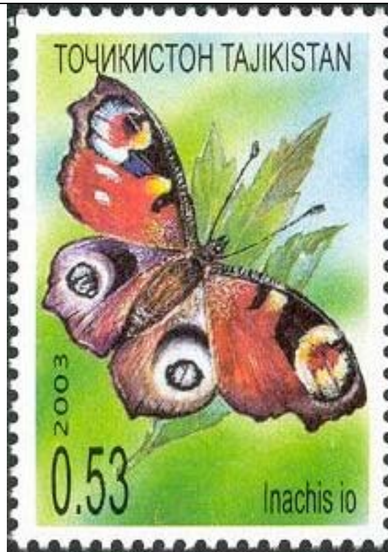
Lepidoptera : Nymphalidae : Inachis io .

2003 Mayo 20 : Exposición Filatelica Internacional 2003 (1 valor ex BF de 8 valores) (Michel : 278 A) (Scott : 220 c).