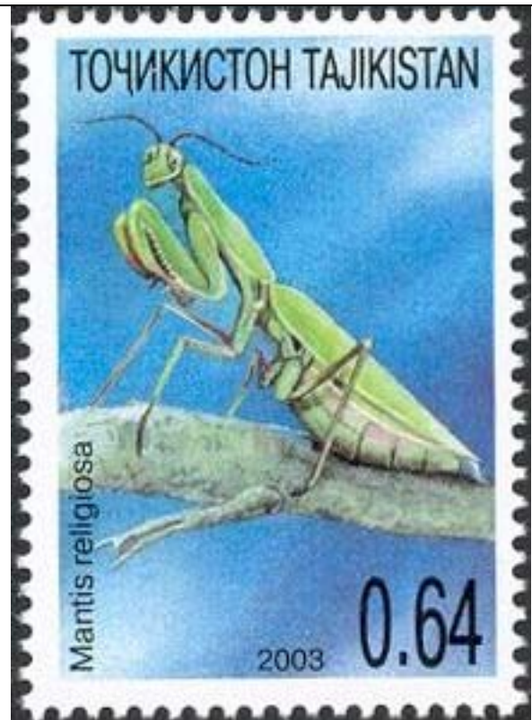
Mantodea : Mantidae : Mantis religiosa .