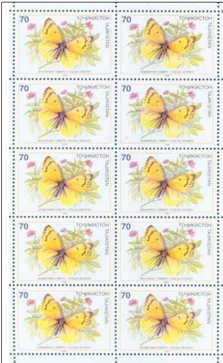
Lepidoptera : Pieridae : Colias sieversi .