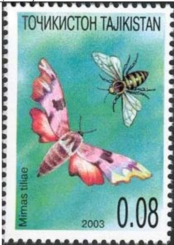
Lepidoptera : Sphingidae : Mimas tiliae + Hymenoptera : Apoidea.

2003 Octubre 28 : Fauna de Asia Central (2 valores de BF de 8 valores) (Michel: 302 A + 305 A) (Scott : 228 a, 228 d).