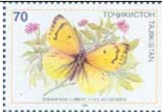
Lepidoptera : Pieridae : Colias sieversi .