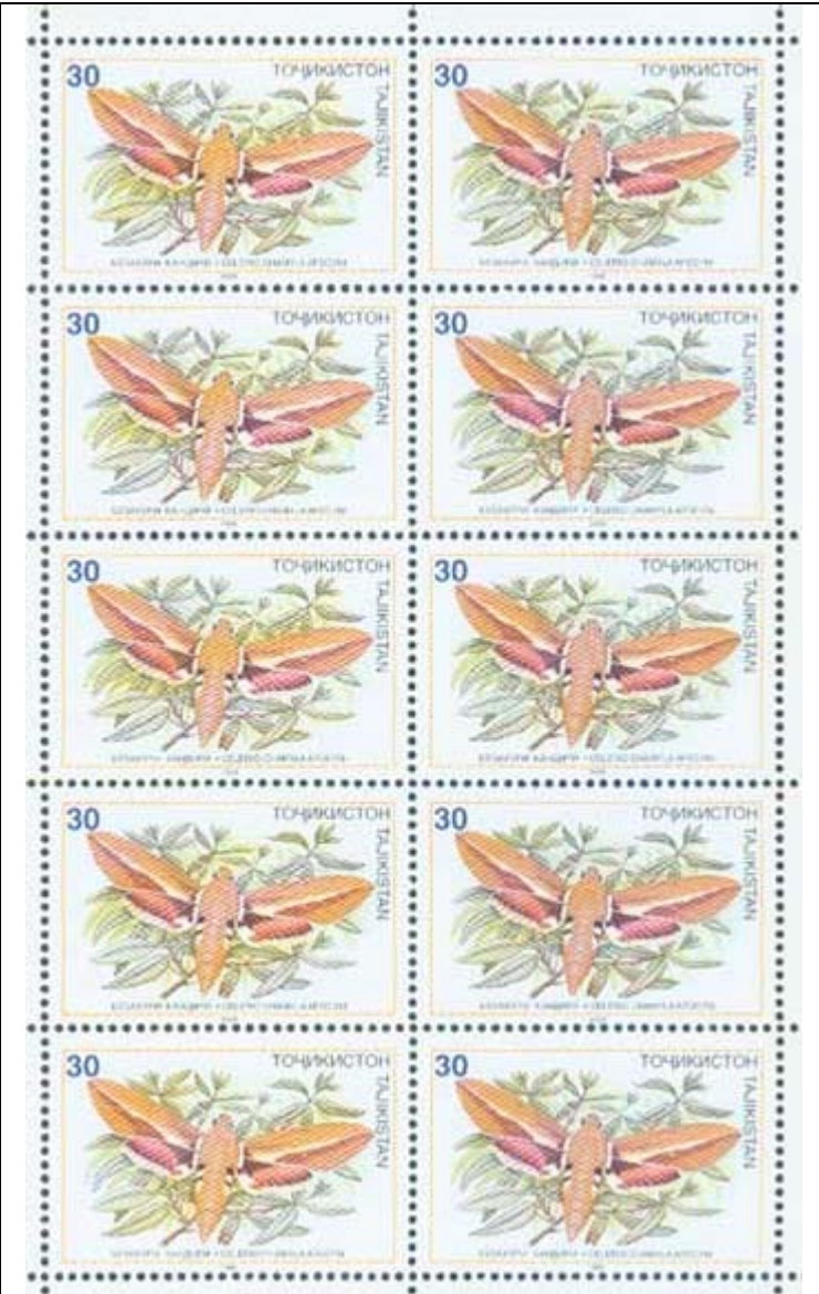
Lepidoptera : Spingidae : Celerio chamyla .