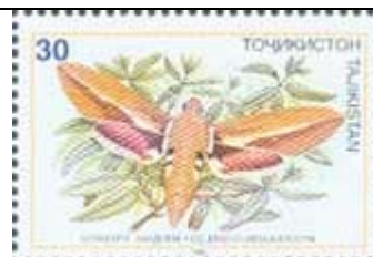
Lepidoptera : Sphingidae : Celerio chamyla .