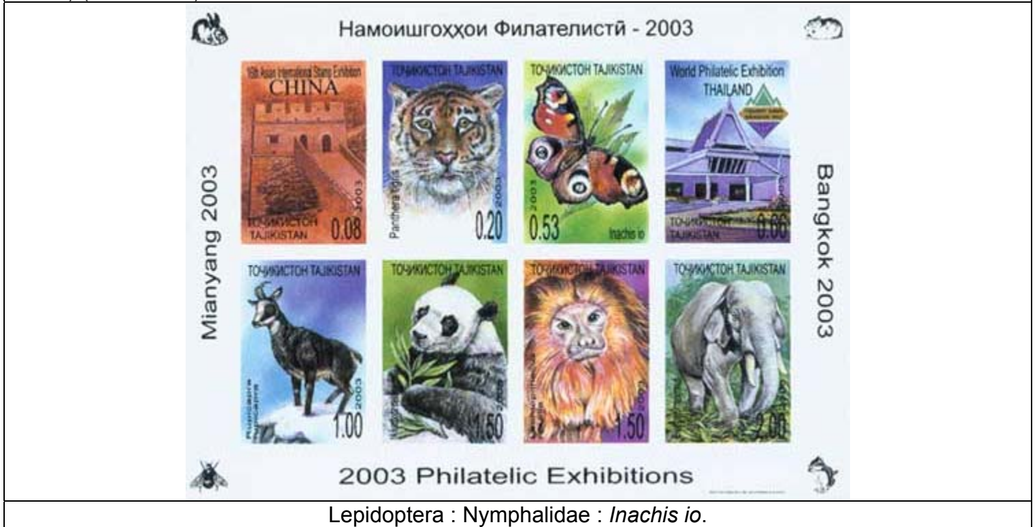
Lepidoptera : Nymphalidae : Inachis io .

2003 Mayo 20 : Exposición Filatelica Internacional 2003, BF de 8 valores, no dentado (Michel: 276 B – 283 B) (Scott : 220).