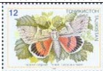
Lepidoptera : Noctuidae : Catocala timur .

1998 Abril 3 : Mariposas (4 valores) (Y & T : 106-109) (Michel: 133-136) (Scott : 126-129 + 129 a + 130). Los sellos del BF tienen borde colorado.