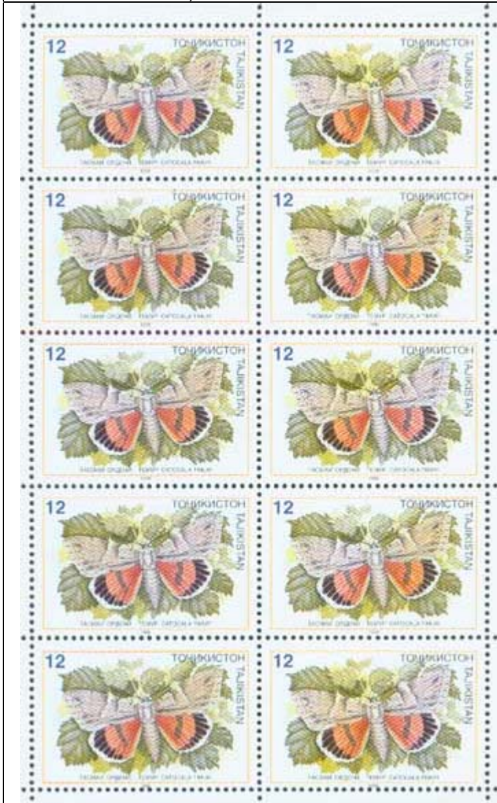
Lepidoptera : Noctuidae : Catocala timur .

1998 April 3 : Mariposas, hojas de 10 sellos (4 valores) (Y & T : 106-109) (Michel: 133-136) (Scott : 126-129 + 129 a + 130).