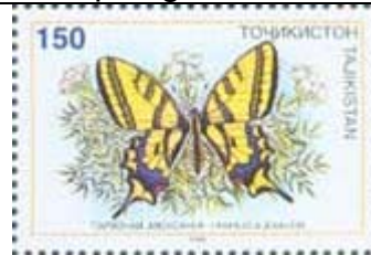
Lepidoptera : Papilionidae : Papilio alexanor .