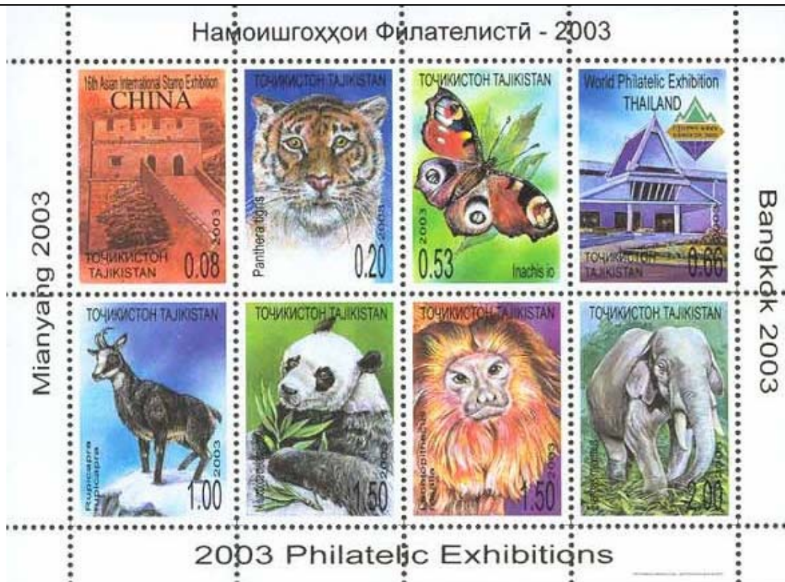
Lepidoptera : Nymphalidae : Inachis io .

2003 Mayo 20 : Exposición Filatelica Internacional 2003, BF de 8 valores (Michel : 276 A – 283 A) (Scott : 220).