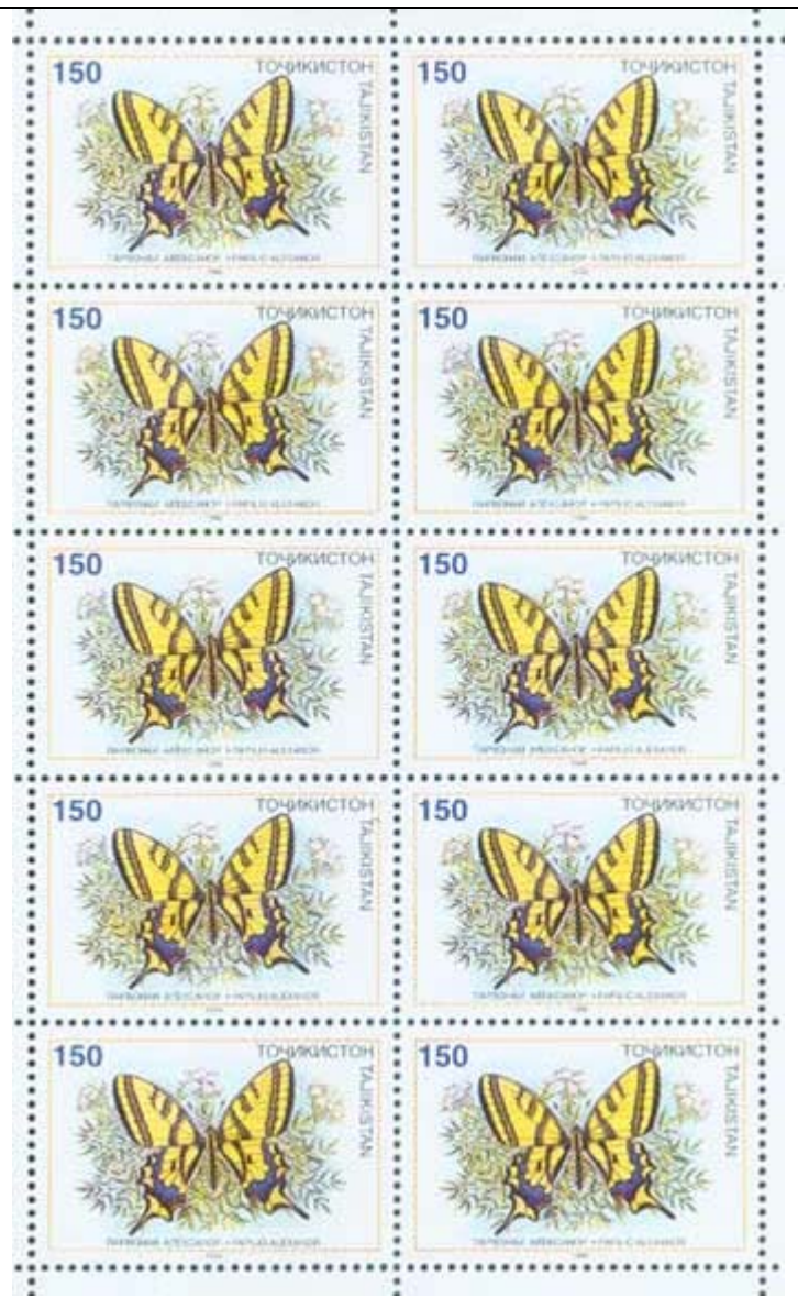
Lepidoptera : Papilionidae : Papilio alexanor .

1998 April 3 : Mariposas (4 valores ex BF) (Y & T : 106-109) (Michel: 133-136) (Scott : 126-129 + 129 a + 130). Los sellos del BF tienen borde colorado.