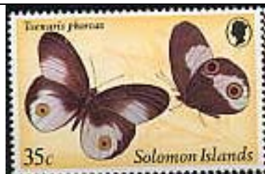
Lepidoptera : Taenaris phorcas .