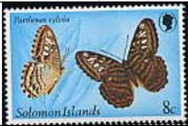
Lepidoptera : Nymphalidae : Parthenos sylvia .

1980 Noviembre 12 : Mariposas (4 valores) (Y & T : xxx) (Scott : 431-434).