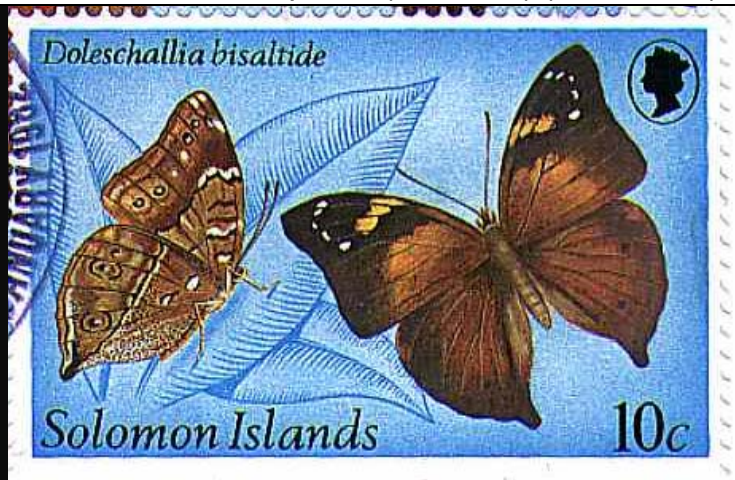
Lepidoptera : Nymphalidae : Doleschallia bisaltide .

1982 Enero 5 : Mariposas (4 valores) (Y & T : xxx) (Scott : 461-464).