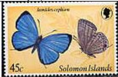
Lepidoptera : Lycaenidae : Jamides cephion .