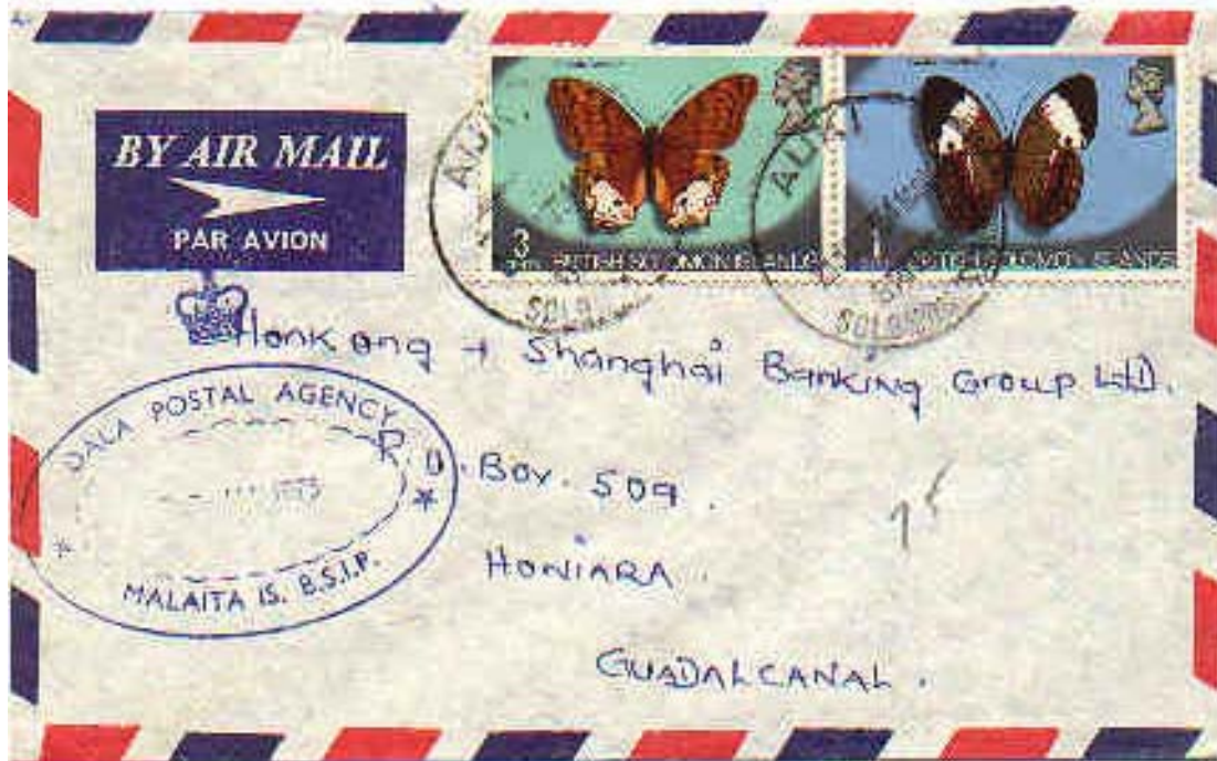
Lepidoptera : Nymphalidae : Cupha woodfordi + Lepidoptera : Nymphalidae : Vindula sapor .

1975 : Idem, Mariposas, sobre carta de circulación interna de la isla Malaita a la isla de Guadalcanal (Scott : 232 + 234).