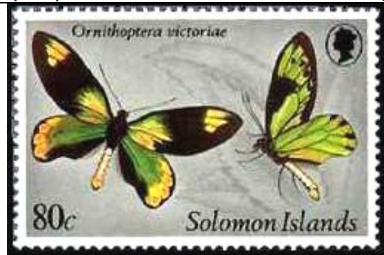
Lepidoptera : Papilionidae : Ornithoptera victoriae .

1982 Enero 5 : Mariposas (4 valores) (Y & T : xxx) (Scott : 461-464).