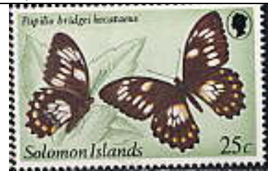
Lepidoptera : Papilionidae : Papilio bridgei hecataeus .