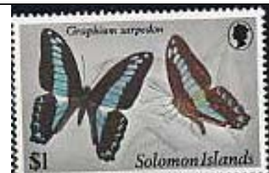
Lepidoptera : Papilionidae : Graphium sarpedon .