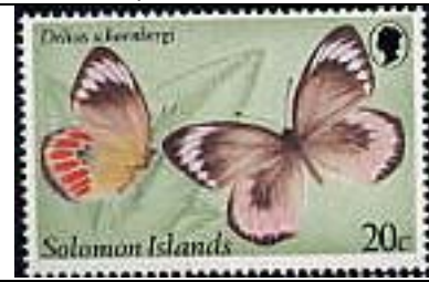
Lepidoptera : Pieridae : Delias schonbergi .