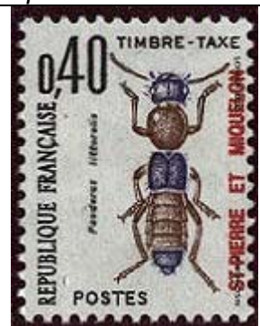
Coleoptera : Staphylinidae : Paederus littoralis .