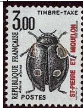
Coleoptera : Coccinellidae : Semiadalia alpina .