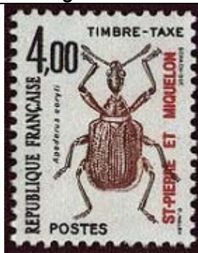
Coleoptera : Curculionidae : Apoderus coryli .