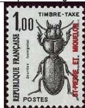
Coleoptera : Coleoptera : Scarites laevigatus .