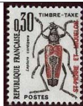
Coleoptera : Cerambycidae : Leptura cordigera .