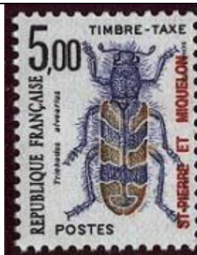
Coleoptera : Cleridae : Trichodes alvearius .