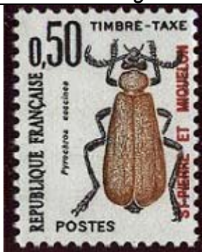
Coleoptera : Pyrochroidae : Pyrochroa coccinea .