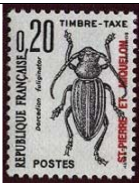
Coleoptera : Cerambycidae : Dorcadion fuliginator .