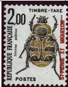
Coleoptera : Scarabaeidae : Trichiinae : Trichius gallicus .