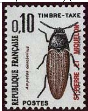
Coleoptera : Elateridae : Ampedus cinnabarinus .

1986 Septiembre 15 : Sello TAX de Francia (1982 y 1983) : insectos, sobresellados Saint-Pierre & Miquelon (10 valores) (Scott : J 83 – J 92).