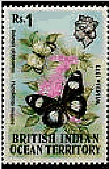
Lepidoptera : Nymphalidae : Hypolimnas misippus

1973 Noviembre 12 : Fauna silvestre 1973 (2 de 3 valores) (Y & T : 55-56) (Scott : 55-56).