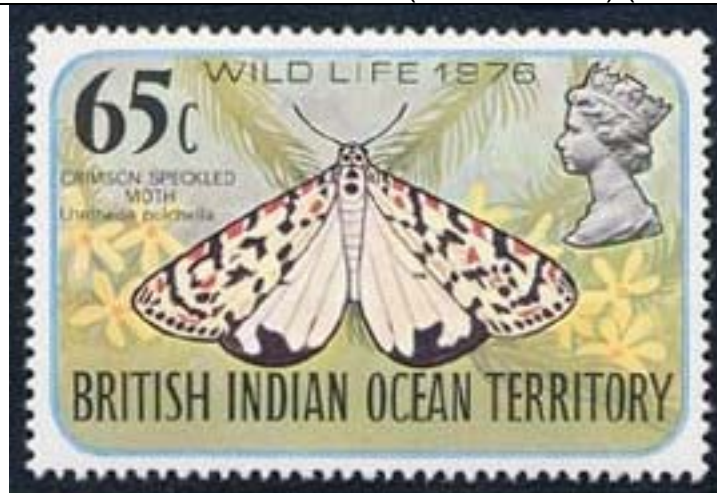
Lepidoptera : Arctiidae : Utetheisa pulchella .

1978 : Fauna silvestre 1975 (Y & T : 86-89) (Scott : 86-89).