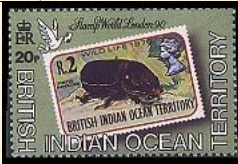
Coleoptera : Scarabaeidae : Dynastinae : Oryctes rhinoceros

1990 Mayo 3 : Exposición filatelica mundial en Londres 1990, Estampilla de Fauna silvestre 1978 sobre estampilla (Y & T : 91) (Scott : 91).