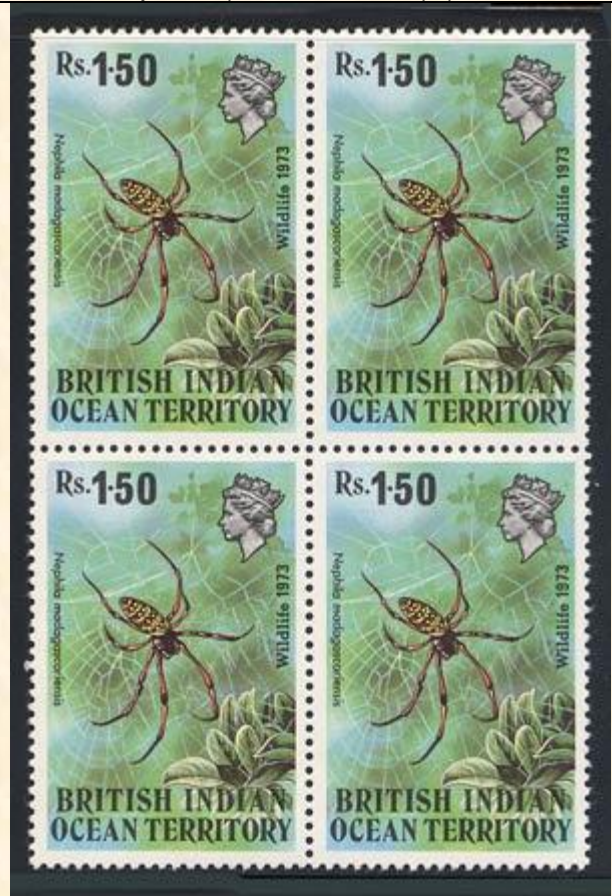
Araneida : Araneidae : Nephila madagascariensis