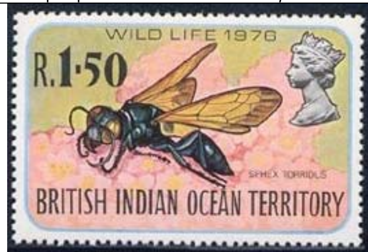
Hymenoptera : Sphecidae : Spheg torridus