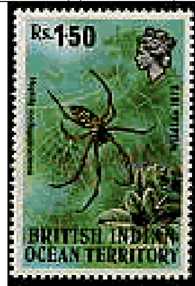
Araneida : Araneidae : Nephila madagascariensis