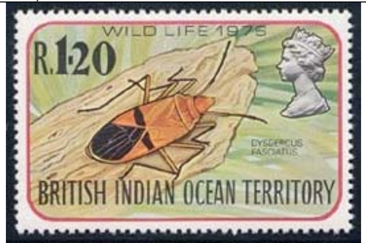
Heteroptera : Pyrrhocoridae : Dysdercus fasciatus