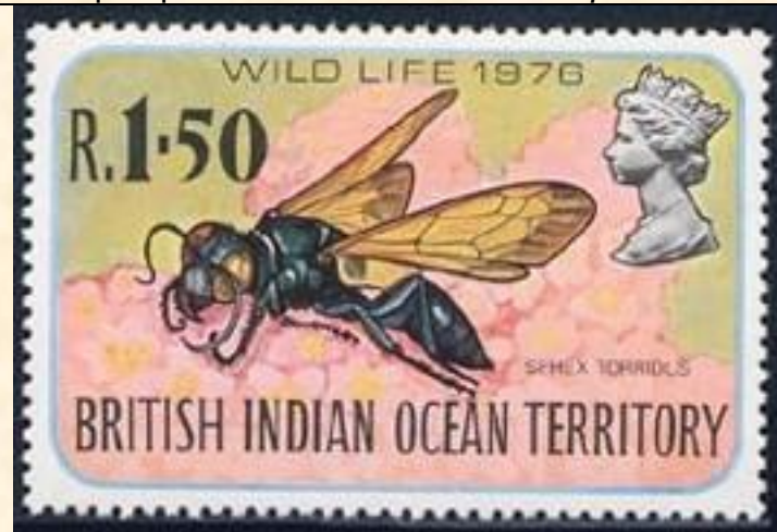
Hymenoptera : Sphecidae : Sphex torridus