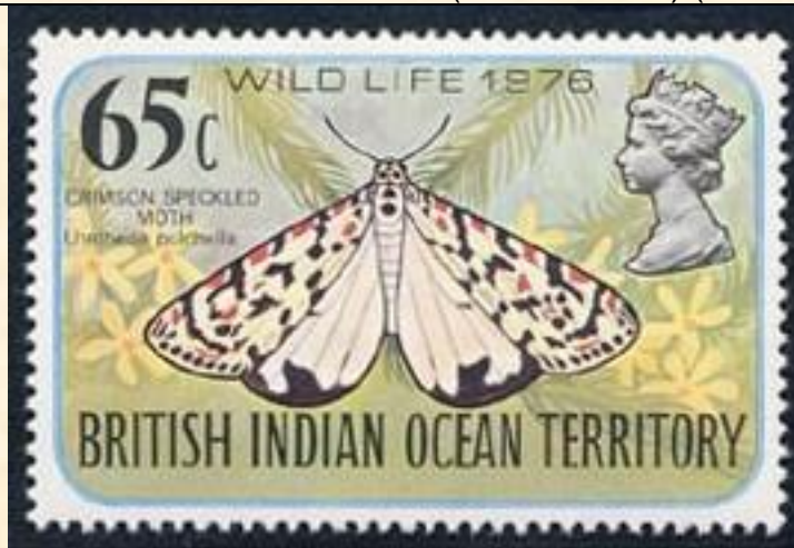
Lepidoptera : Arctiidae : Utetheisa pulchella .

1978 : Fauna silvestre 1975 (Y & T : 86-89) (Scott : 86-89).