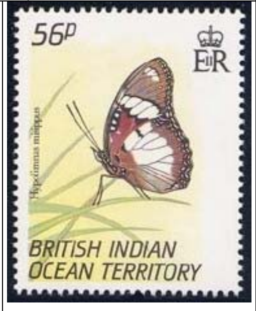
Lepidoptera : Nymphalidae : Hypolimnas misippus

2001 : Exposición filatelica de Hong Kong 2001, Mariposas (Y & T : xxx) (Scott : 229 a-b)