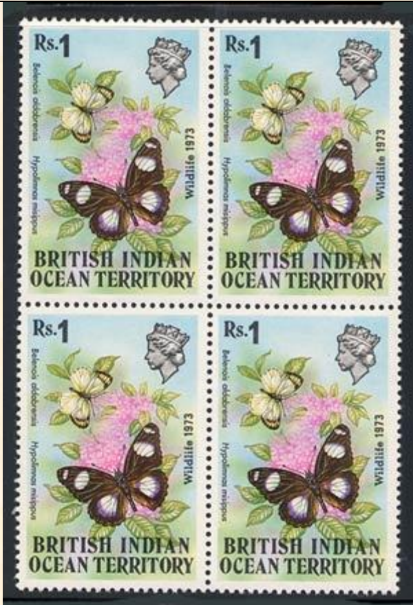
Lepidoptera : Nymphalidae : Hypolimnas misippus

1973 Noviembre 12 : Fauna silvestre 1973, en bloques de 4 estampillas (Y & T : 55-56) (Scott : 55-56).