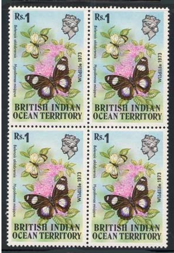
Lepidoptera : Nymphalidae : Hypolimnas misippus

1973 Noviembre 12 : Idem, Fauna silvestre 1973, en bloques de 4 estampillas (Y & T : 55-56) (Scott : 55-56).