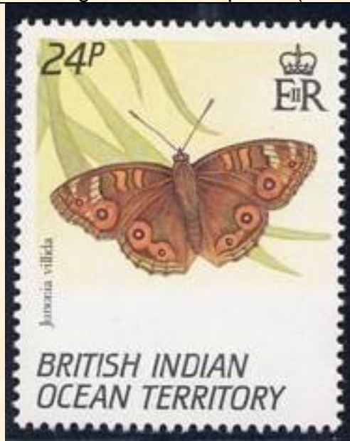
Lepidoptera : Nymphalidae : Junonia villida

1994 Agosto 16 : Mariposas (3 valores) (Y & T : 150-152) (Scott : 148-150).