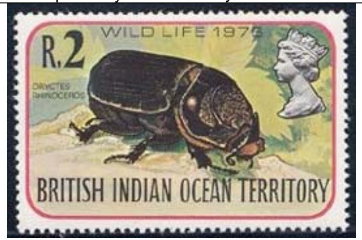
Coleoptera : Scarabaeidae : Dynastinae : Oryctes rhinoceros

1990 Mayo 3 : Exposición filatelica mundial en Londres 1990, Estampilla de Fauna silvestre 1978 sobre estampilla (Y & T : 91) (Scott : 91).