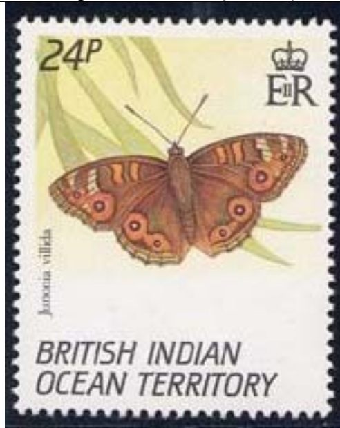
Lepidoptera : Nymphalidae : Junonia villida

1994 Agosto 16 : Mariposas (3 valores) (Y & T : 150-152) (Scott : 148-150).