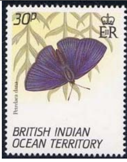
Lepidoptera : Lycaenidae : Petrelaea dana.