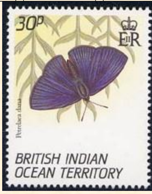
Lepidoptera : Lycaenidae : Petrelaea dana.