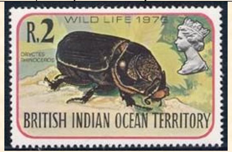
Coleoptera : Scarabaeidae : Dynastinae : Oryctes rhinoceros

1990 Mayo 3 : Exposición filatelica mundial en Londres 1990, Estampilla de Fauna silvestre 1978 sobre estampilla (Y & T : 91) (Scott : 91).