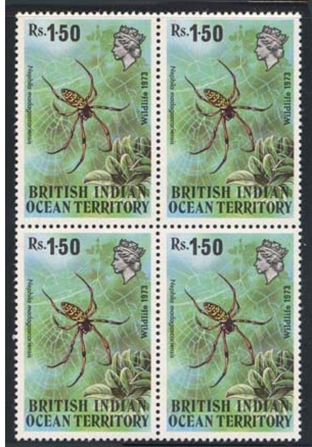
Araneida : Araneidae : Nephila madagascariensis