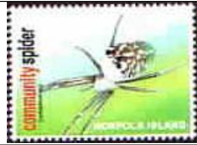
Araneida : Araneidae.

Fecha no definida : Idem, Arañas (1 HF) (Scott : xxx).