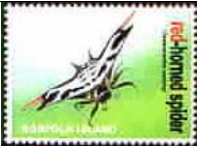
Araneida : Araneidae.