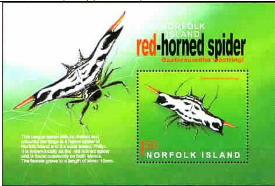
Araneida : Araneidae.

Fecha no definida : Idem, Arañas (1 HF) (Scott : xxx).