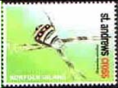
Araneida : Araneidae.

Fecha no definida : Arañas (4 valores) (Scott : xxx).