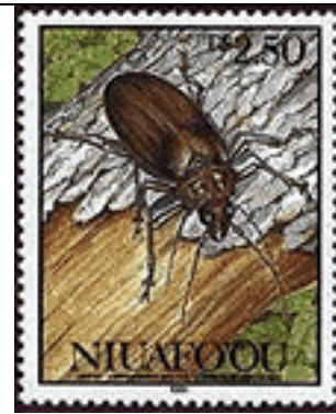
Coleoptera : Cerambycidae : Prioninae : Ceresium unicolor .