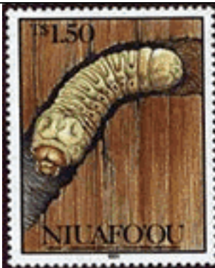
Coleoptera : Cerambycidae : Prioninae : Ceresium unicolor .