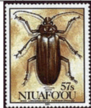
Coleoptera : Cerambycidae : Prioninae : Ceresium unicolor .