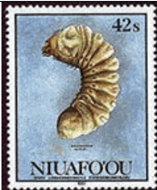
Coleoptera : Cerambycidae : Prioninae : Ceresium unicolor .

1991 Septiembre 11 : Insecto Ceresium unicolor (4 valores) (Y & T : 140-143) (Scott : 143-143).