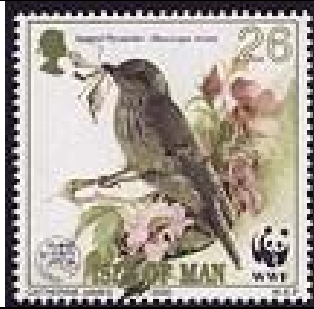
Aves ("spotted flycatcher") con insecto en el pico.

2000 : WWF : Aves (1 de 4 valores) (Y & T : xxx) (Scott : 860 b).