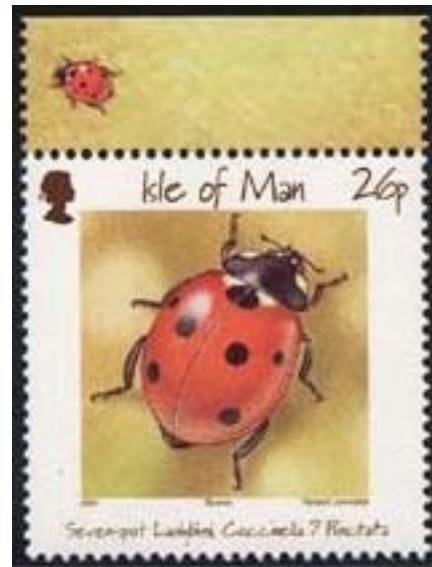
Coleoptera : Coccinellidae : Coccinella septempunctata .