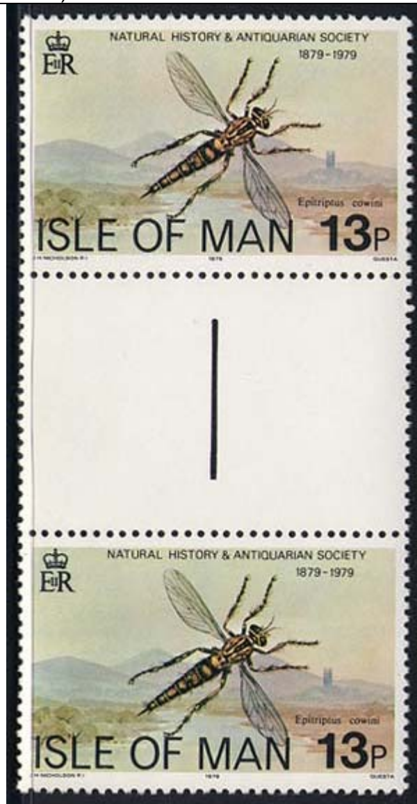
Diptera : Asilidae : Epiripteus cowini .

1979 Febrero 27 : Sociedad de Historia Natural y Antiquedades de la Isla de Man, bloque de 2 estampillas (Y & T : xxx) (Scott : 145).