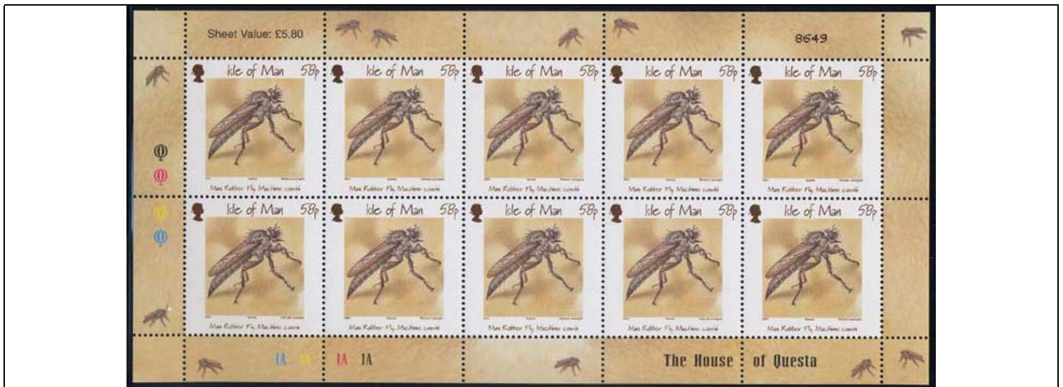
Diptera : Asilidae : Machimus sp.