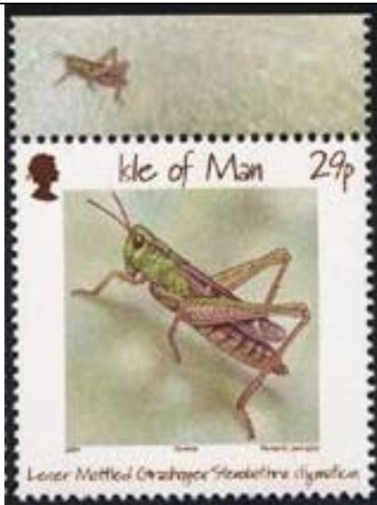
Orthoptera : Acrididae.