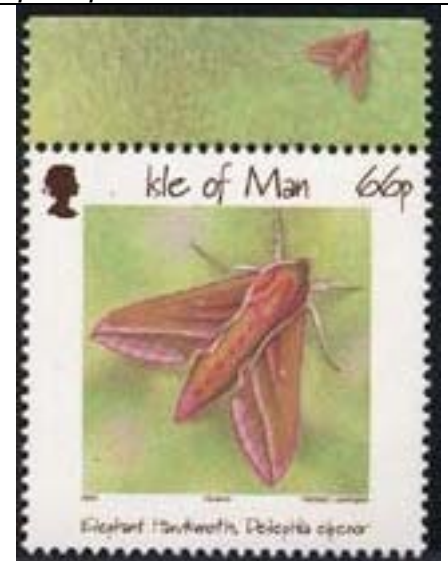
Lepidoptera : Sphingidae : Deilephila elpenor .