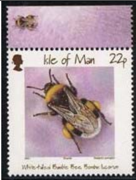
Hymenoptera : Apidae : Bombus sp.

2001 Febrero 1 : Insectos (5 valores) (Y & T : xxx) (Scott : 895-899).