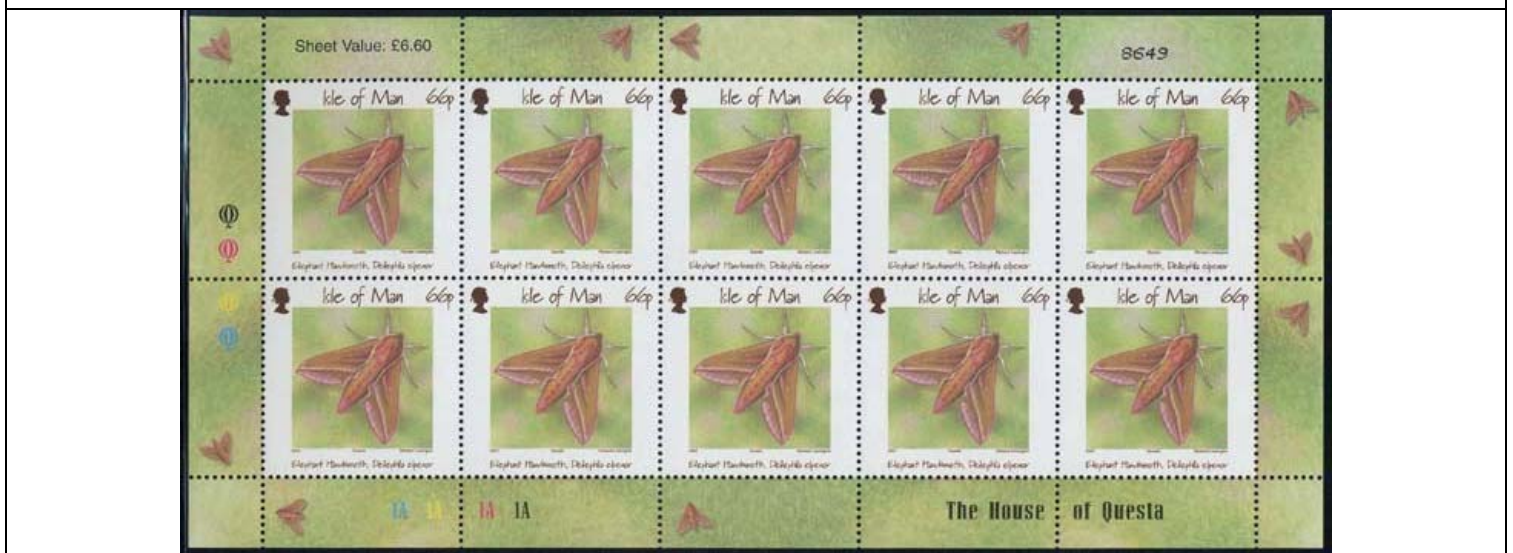
Lepidoptera : Sphingidae : Deilephila elpenor .

MAN, 2008. Yvert 1497 (30p butterfly Anthocaris cardamines ) & 1500 (70p dragonfly Pyrrhosoma nymphula ). In a set of 6 stamps (1497 to 1502) about Ballaugh Curragh walkthrough: fauna & flora.