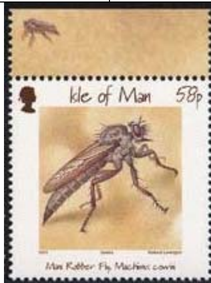
Diptera : Asilidae : Machimus sp.