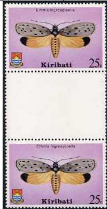
Lepidoptera : Ethmiidae : Ethmia nigroapicella .