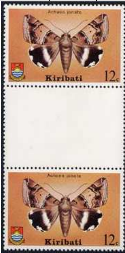
Lepidoptera : Noctuidae : Achaea jancta .

1980 Agosto 27 : Mariposas, bloques de 2 sellos (Y & T : 33-36) (Scott : 356-359).