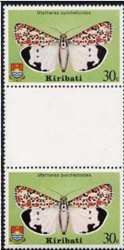
Lepidoptera : Arctiidae : Utetheisa pulchelloides .