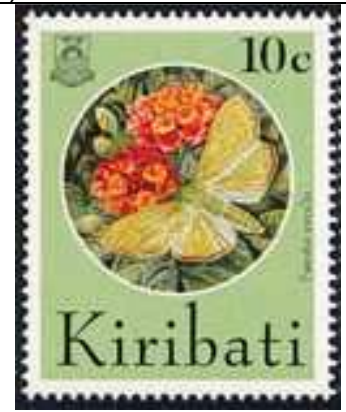
Lepidoptera : Pyralidae.