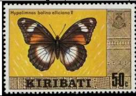
Lepidoptera : Nymphalidae : Hypolimnas bolina elliciana .

1979 Julio 12 : Serie corriente, sin marca de agua (1 de 15 valores) (Y & T 3-16) (Scott : 338 a).