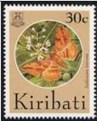
Lepidoptera : Noctuidae.