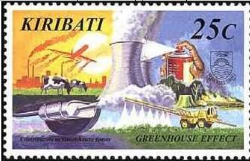
Aplicación de pesticidas.

1998 Diciembre 1 : Efecto invernadero (1 de 5 valores) (Scott : 731).