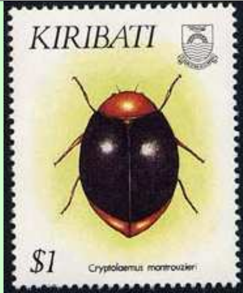
Coleoptera : Coccinellidae : Cryptolaemus montrouzieri .