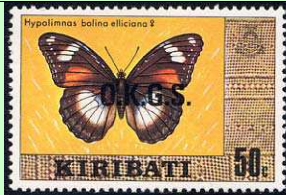
Lepidoptera : Nymphalidae : Hypolimnas bolina elliciana .

1981 : Mariposa de 1979 sobresellada para correo oficial "O.K.G.S.", sin marca de agua (Scott : O 12 a).