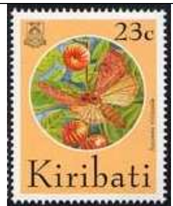
Lepidoptera : Noctuidae.