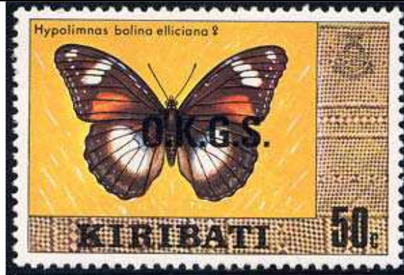
Lepidoptera : Nymphalidae : Hypolimnas bolina elliciana .

1981 : Mariposa de 1979 sobresellada para correo oficial "O.K.G.S.", con marca de agua (Scott : O 12).