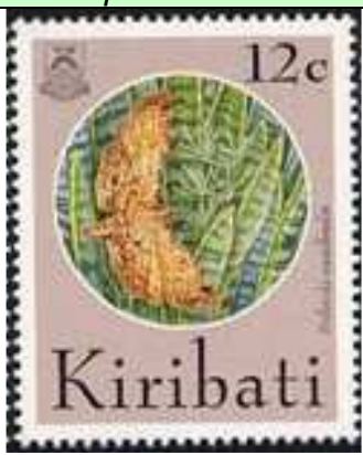
Lepidoptera : Pyralidae.