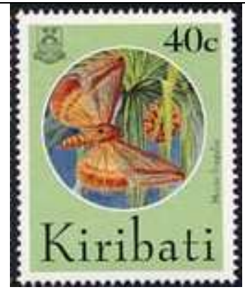
Lepidoptera : Noctuidae.