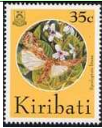
Lepidoptera : Noctuidae.