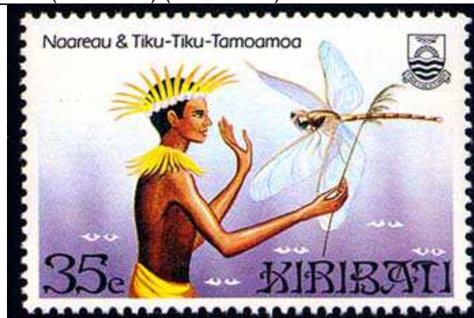
Naareau & Tiku-Tiku-Tamoamo : Odonata.

1984 Noviembre 21 : Leyendas (Y & T xxx) (Scott : 450).