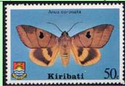
Lepidoptera : Noctuidae : Amus coronata .