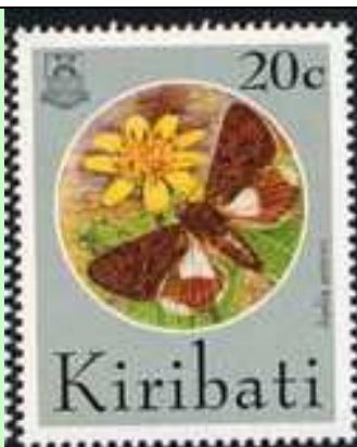
Lepidoptera : Noctuidae : Aedia sericea .