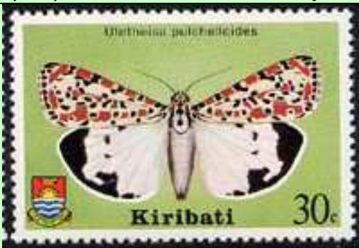
Lepidoptera : Arctiidae : Utetheisa pulchelloides .