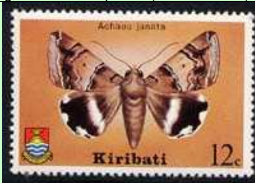
Lepidoptera : Noctuidae : Achaea jancta .

1980 Agosto 27 : Mariposas (Y & T : 33-36) (Scott : 356-359).