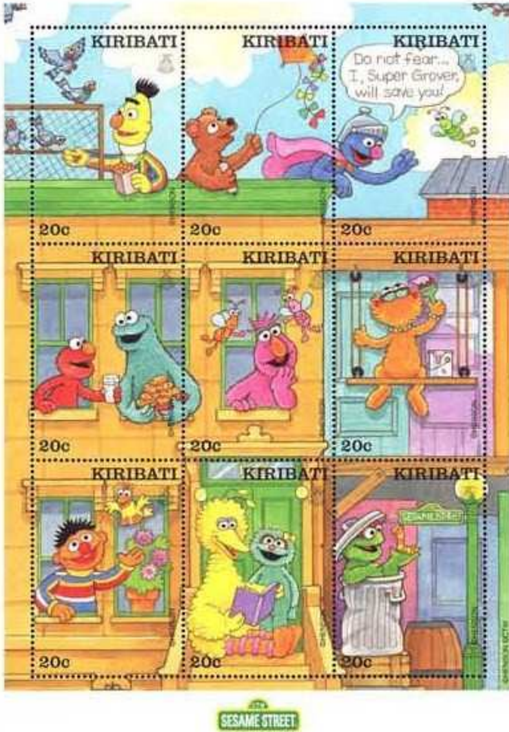
Muñecos insectos de Sesame Street (? Hymenoptera).

2000 Marzo 22 : Cartoon Sesame Street "Twiddlebugs" (Scott : 760-761).