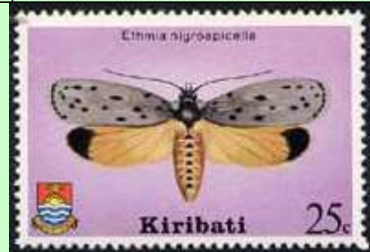
Lepidoptera : Ethmiidae : Ethmia nigroapicella .