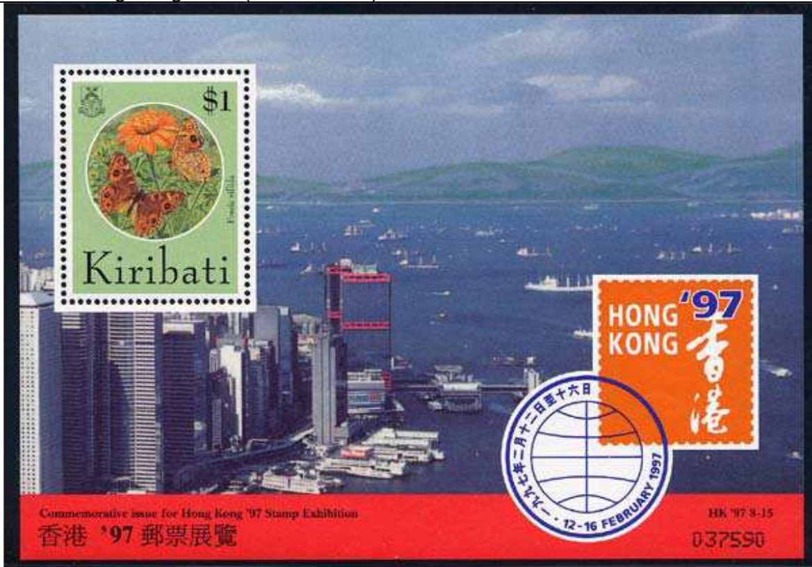
Lepidoptera : Nymphalidae : Precis villida .

1997 Febrero 3 : Hong Kong 1997 (Scott : 648 a).