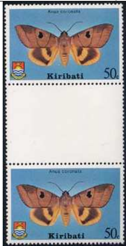
Lepidoptera : Noctuidae : Amus coronata .