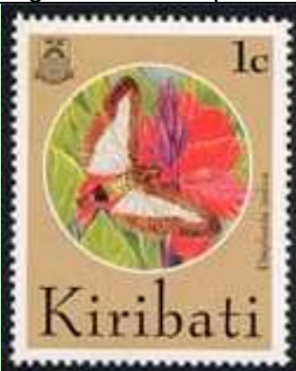
Lepidoptera : Pyralidae : Diaphania indica .

1994 Agosto 19 : Mariposas (18 valores) (Y & T : 323-340) (Scott : 634-651).