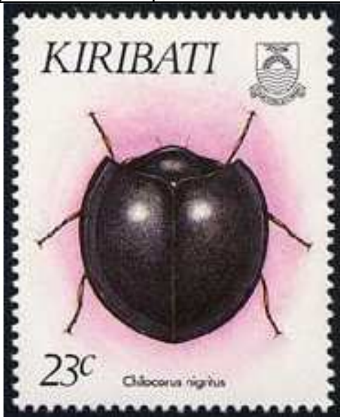
Coleoptera : Coccinellidae : Chilocorus nigrinus .

1993 Agosto 23 : Coleoptera Coccinellidae (Y & T : 278-281) (Scott : 607-610).