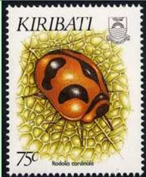
Coleoptera : Coccinellidae : Rodolia cardinalis .