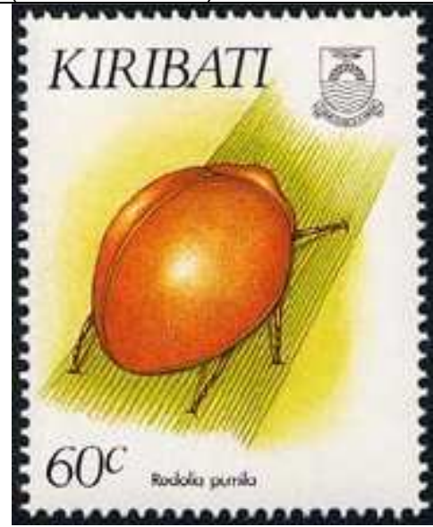
Coleoptera : Coccinellidae : Rodolia pumila .