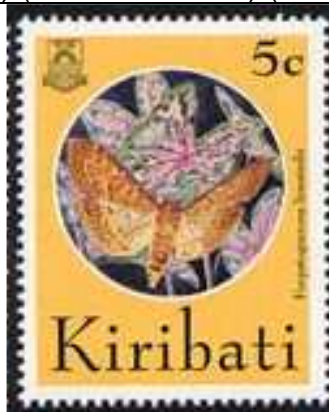
Lepidoptera : Pyralidae.