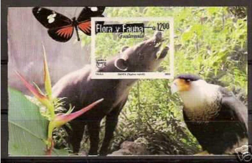
Ilustración en margen : Lepidoptera : Nymphalidae : Heliconinae : Heliconius doris .

2005 : Fauna & Flora, UPAEP (HF) (Y & T : BF 33) (Scott : xxx).