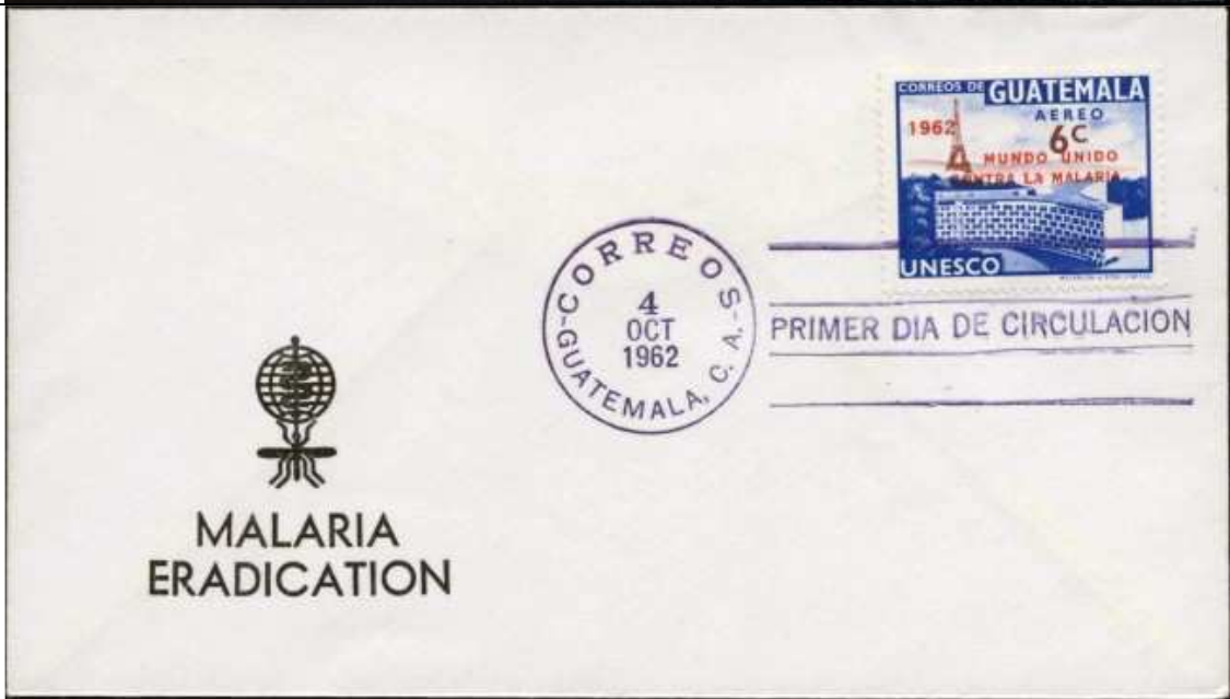
Diptera : Culicidae.