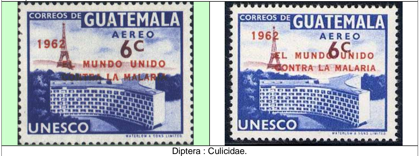
Diptera : Culicidae.

1962 Octubre 4 : El Mundo unido contra la Malaria, estampilla de tema UNESCO (Scott : C245) con sobresellado "El Mundo unido contra la Malaria". La posición de sobresellado varía (Y & T : xxx) (Scott : C258).