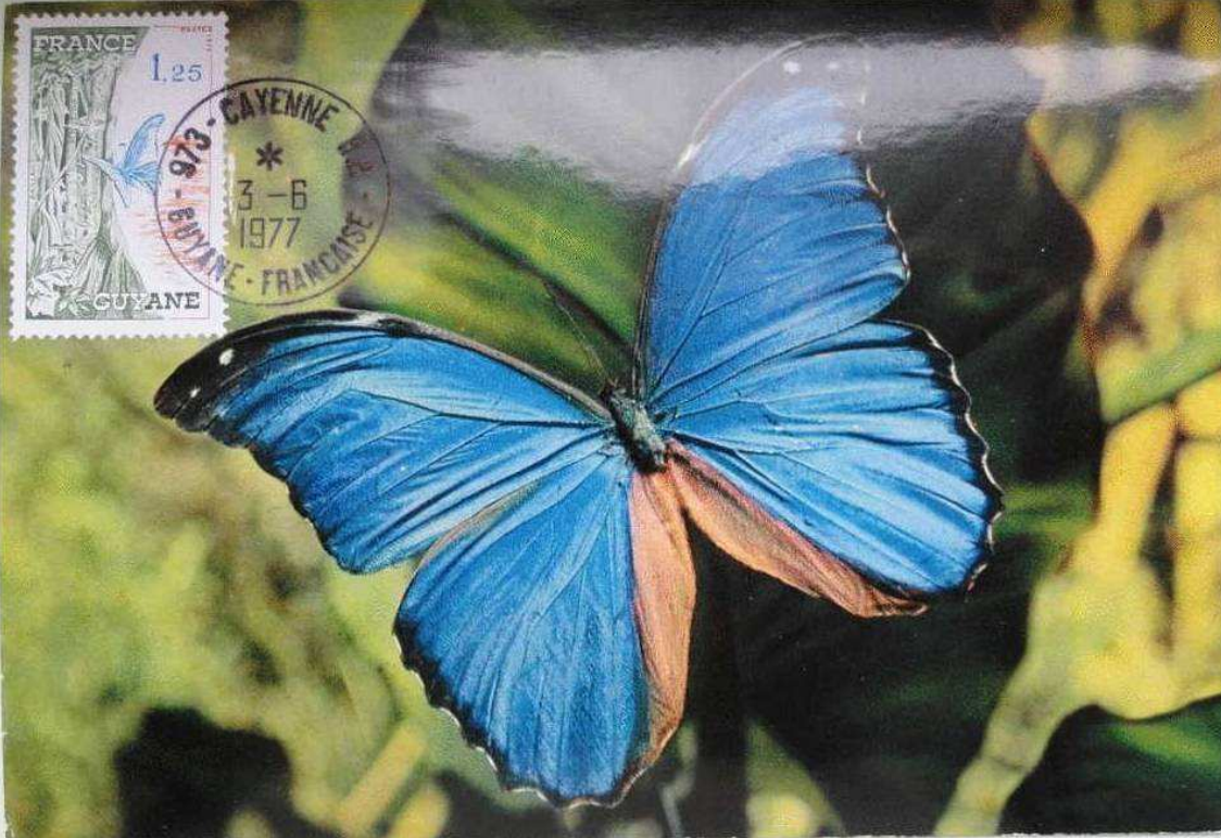
Lepidoptera : Nymphalidae : Morphinae : Morpho sp.

1977 Junio 3 : Regiones turísticas (1 de 5 valores) : Guiana francesa (Scott : 1446), tarjeta maximum, cancelada en Cayenne.