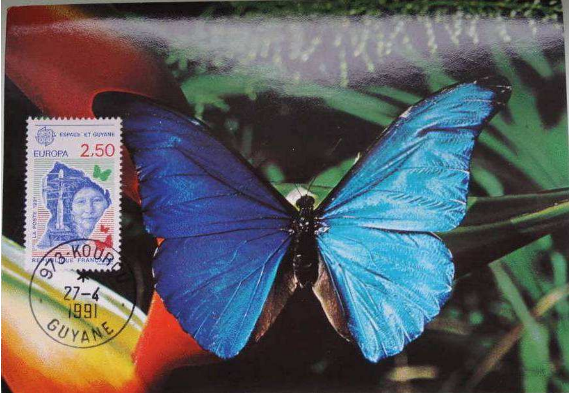
Lepidoptera (mariposas estilizadas). Ilustracion de la tarjeta: Lepidoptera: Nymphalidae: Morphinae: Morpho sp.

1991 Abril 27: Europa, Guyana y Espacio (Scott: 2254), sobre tarjeta máxima, cancelada en Kourou.