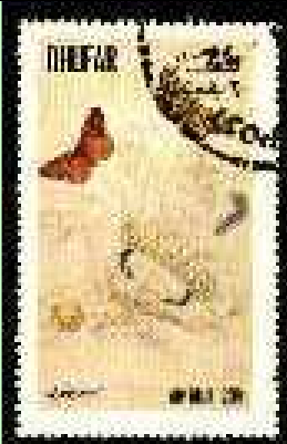
Lepidoptera : Arctiidae.