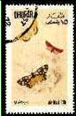
Lepidoptera : Arctiidae.