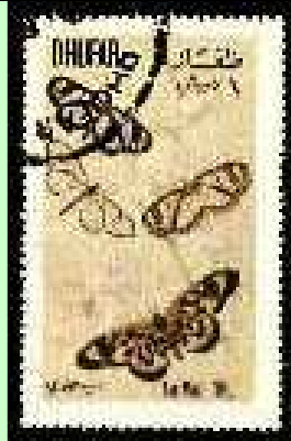
Lepidoptera : Nymphalidae : Ithomiinae.