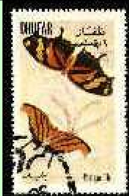
Lepidoptera : Nymphalidae : Consul sp. + Marpesia sp.