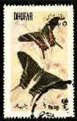
Lepidoptera : Uraniidae : Urania sp.

1972 Agosto 30 : Lepidoptera (8 valores emitidos en BF).