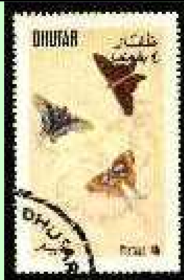
Lepidoptera : Riodinidae.