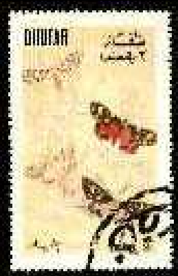
Lepidoptera : Arctiidae.