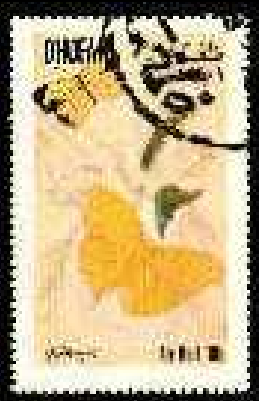
Lepidoptera : Pieridae : Eurema sp. + Phoebis sp.