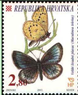
Lepidoptera : Lycaenidae : Maculinea teleius .