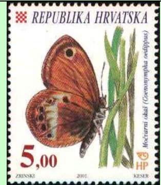
Lepidoptera : Nymphalidae : Satyrinae : Coenonympha oedippus .

2001 Junio 5 : Idem, Mariposas, en bloques de 2 sellos, para ver el nombre de las especies en borde de hojas (Scott : 453-455).