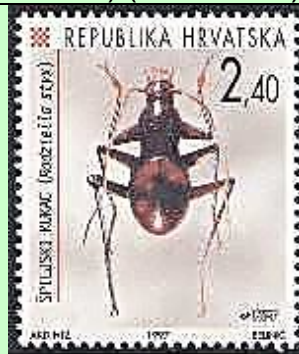
Coleoptera : Carabidae : Radziella styx .

1997 Abril 22 : Fauna de Croacia (1 de 3 valores) (Scott : 328).