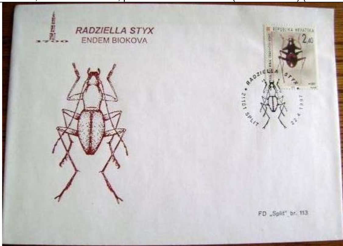
Coleoptera : Carabidae : Radziella styx .

1997 Abril 22 : Idem, Fauna de Croacia, primer día de circulación (1 de 3 valores) (Scott : 328).