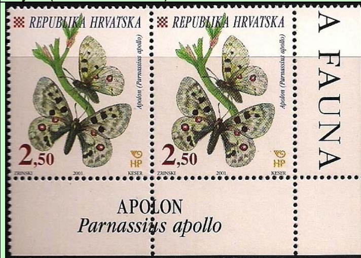
Lepidoptera : Papilionidae : Parnassius apollo .

2001 Junio 5 : Idem, Mariposas, en bloques de 2 sellos, para ver el nombre de las especies en borde de hojas (Scott : 453-455).