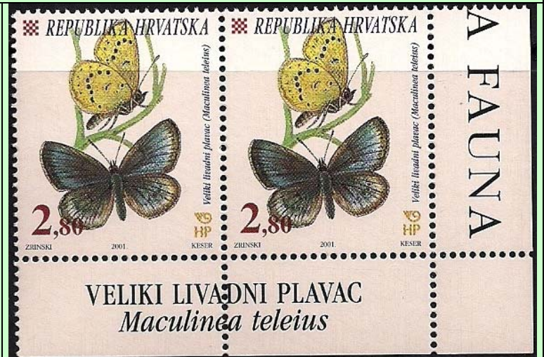
Lepidoptera : Lycaenidae : Maculinea teleius .