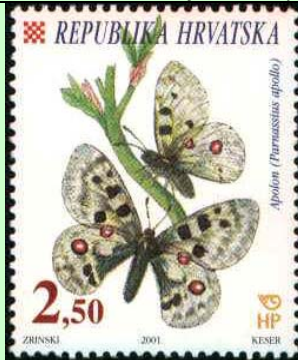
Lepidoptera : Papilionidae : Parnassius apollo .

2001 Junio 5 : Mariposas (Scott : 453-455).