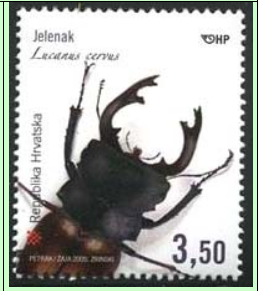
Coleoptera : Lucanidae : Odontolabis femoralis (de la Península Malaya, no es Lucanus cervus ).

Actualizado con Scott hasta Octubre 2006.