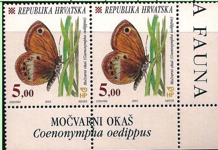
Lepidoptera : Nymphalidae : Satyrinae : Coenonympha oedippus .