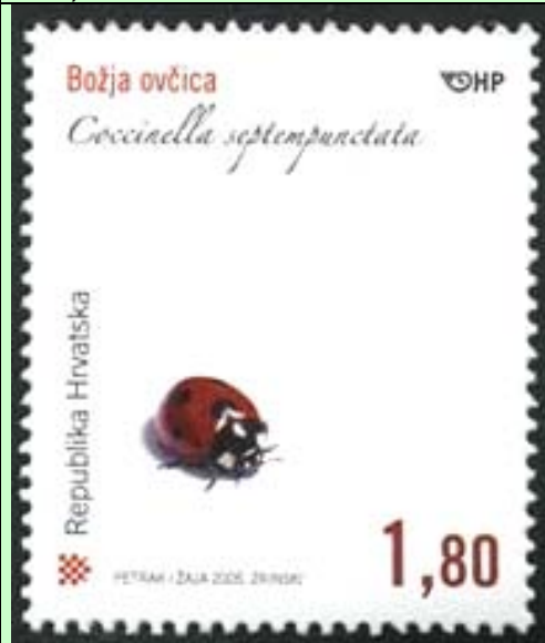
Coleoptera : Coccinellidae : Coccinella septempunctata .

2005 Abril 22 : Fauna de Croacia : Coleoptera (3 valores, emitidos en hojas de 20 sellos) (Scott : 580-582).