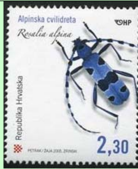
Coleoptera : Cerambycidae : Rosalia alpina .