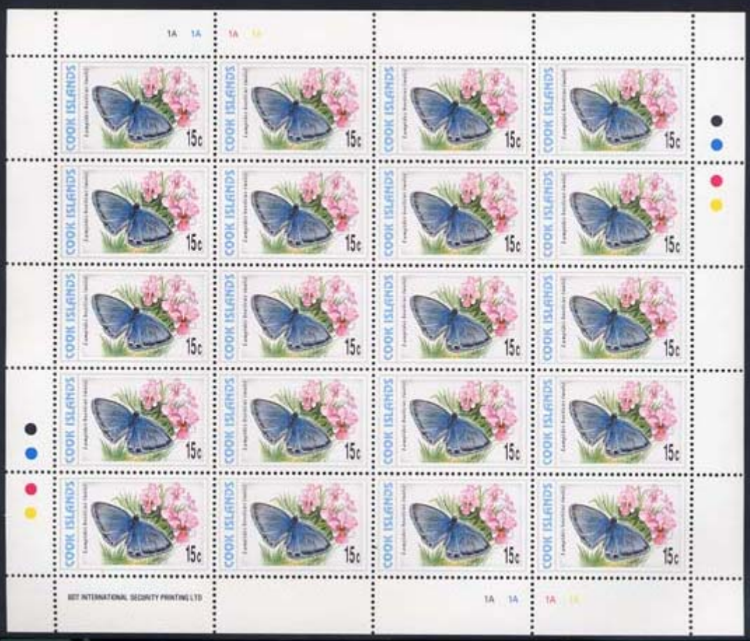
Lepidoptera : Lycaenidae : Lampides boeticus (macho).