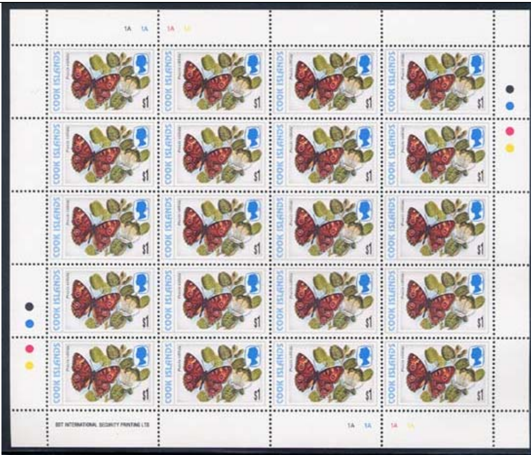
Lepidoptera : Nymphalidae : Precis villida .

1997-1998 : Idem, Mariposas, primer día de circulación (20 valores) (Scott 1215 – 1226 G), cancelado en Rarotonga.