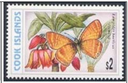
Lepidoptera : Lycaenidae : Lampides boeticus (hembra) (11 de Marzo 1998).