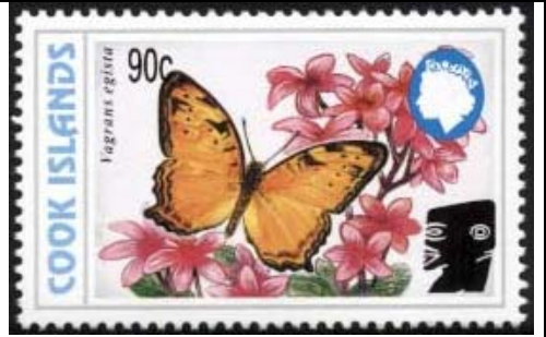
Lepidoptera : Nymphalidae : Vagrans egista .