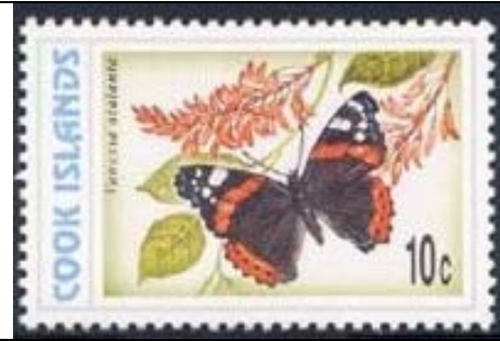
Lepidoptera : Nymphalidae : Vanessa atalanta (22 de Octubre).