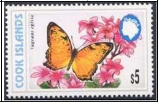
Lepidoptera : Nymphalidae : Vagrans egista (19 de Junio 1998).