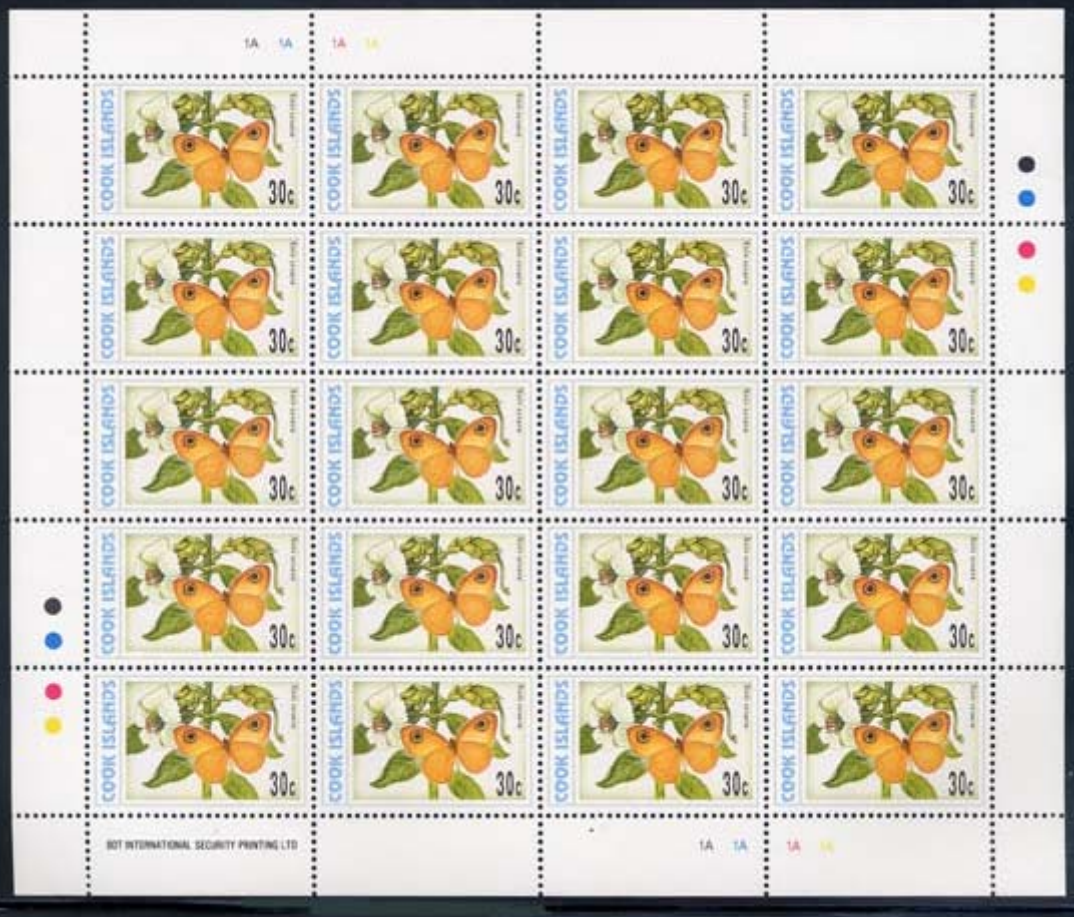
Lepidoptera : Nymphalidae : Satyrinae : Xois sesara .