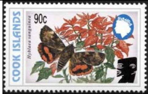
Lepidoptera : Noctuidae : Hyblaes sanguinea .