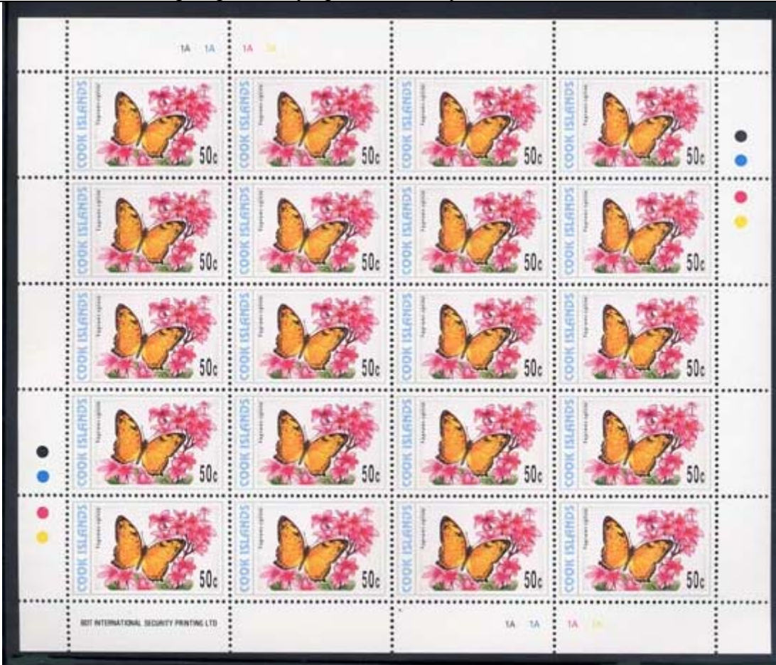
Lepidoptera : Nymphalidae : Vagrans egista .