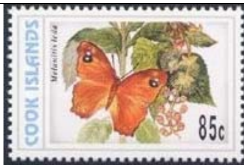
Lepidoptera : Nymphalidae : Satyrinae : Melanitis leda (12 de Noviembre).