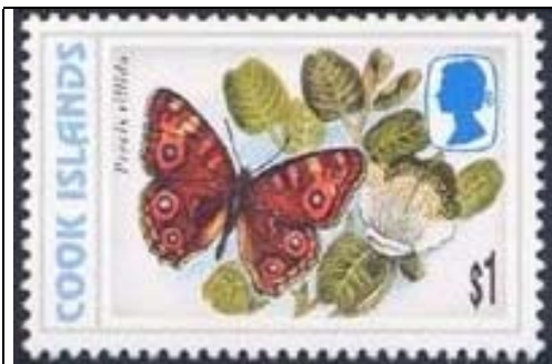
Lepidoptera : Nymphalidae : Precis villida (12 de Noviembre).