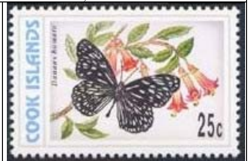
Lepidoptera : Nymphalidae : Danainae : Danaus hamata (22 de Octubre).