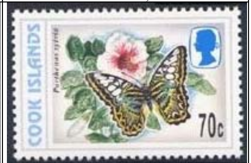
Lepidoptera : Nymphalidae : Parthenos sylvia (22 de Octubre).