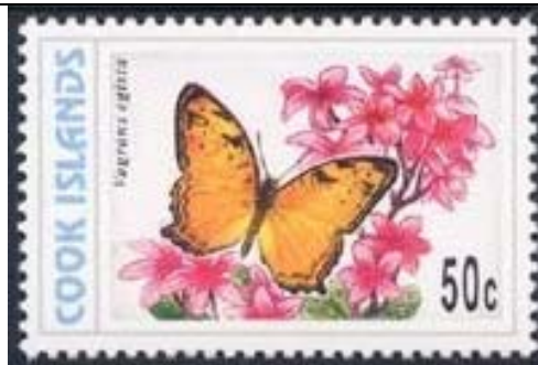
Lepidoptera : Nymphalidae : Vagrans egista (22 de Octubre).