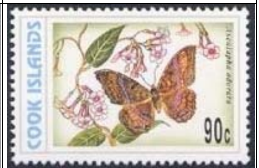
Lepidoptera : Noctuidae : Ascalapha odorata (12 de Noviembre).