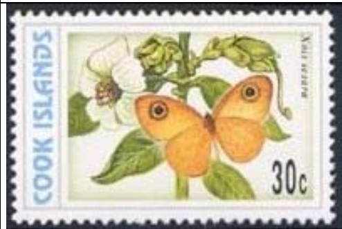
Lepidoptera : Nymphalidae : Satyrinae : Xois sesara (22 de Octubre).