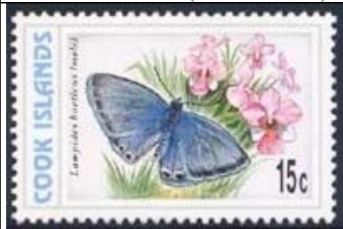
Lepidoptera : Lycaenidae : Lampides boeticus (macho) (22 de Octubre).