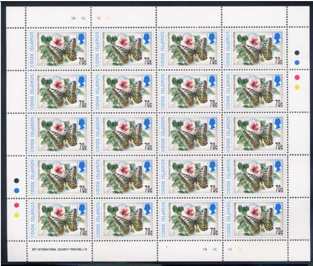
Lepidoptera : Nymphalidae : Parthenos sylvia .