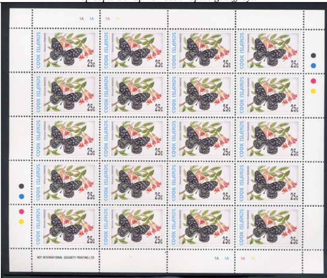
Lepidoptera : Nymphalidae : Danaidae : Danaus hamata .