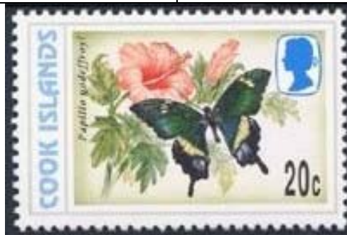
Lepidoptera : Papilionidae : Papilio godeffroyi (22 de Octubre).