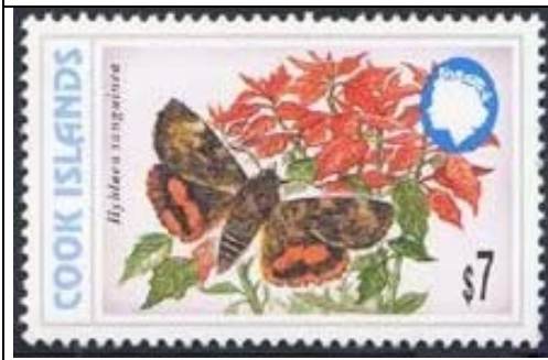
Lepidoptera : Noctuidae : Hyblaea sanguinea (18 de Septiembre 1998).