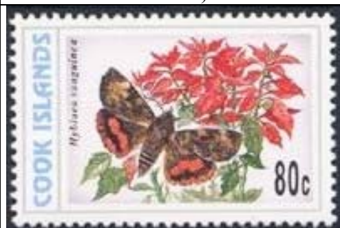
Lepidoptera : Noctuidae : Hyblaes sanguinea (12 de Noviembre).