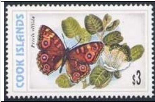
Lepidoptera : Nymphalidae : Precis villida (11 de Marzo 1998).