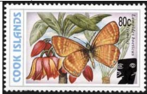
Lepidoptera : Lycaenidae : Lampides boeticus .