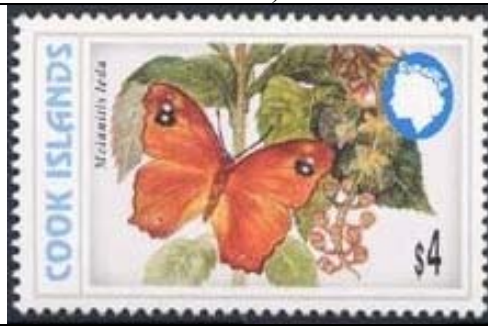
Lepidoptera : Nymphalidae : Satyrinae : Melanitis leda (19 de Junio 1998).