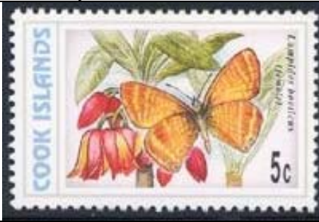
Lepidoptera : Lycaenidae : Lampides boeticus (hembra) (22 de Octubre).

1997-1998 : Mariposas (20 valores) (Scott 1215 – 1226 H). Emitidos 5c, 10c, 15c, 20c, 25c, 30c, 50c y 70c el 22-X-1997; los 80c, 85c, 90c y 1$ el 12-XI-1997; los 1.5$, 2$ y 3$ el 11-III-1998; los 4$ y 5$ el 19-VI-1998; los 7$ y 10$ el 18-IX-1998 y el 15$ el 13-XI-1998.