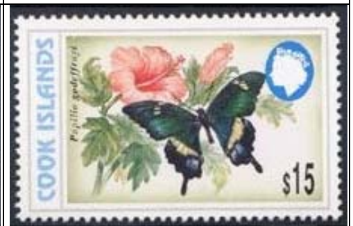
Lepidoptera : Papilionidae : Papilio godeffroyi (13 de Noviembre 1998).