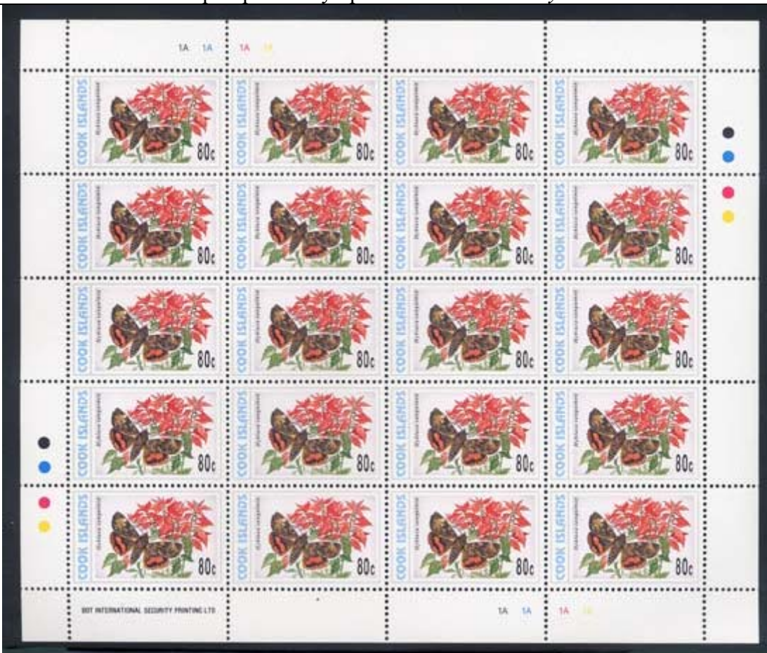
Lepidoptera : Noctuidae : Hyblaea sanguinea .