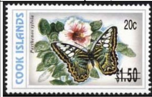
Lepidoptera : Nymphalidae : Parthenos sylvia .

2003 June 30 : Mariposas (serie de 1997-1998) con sobresello de cambio de valor (6 valores) (Scott : 1259-1264).