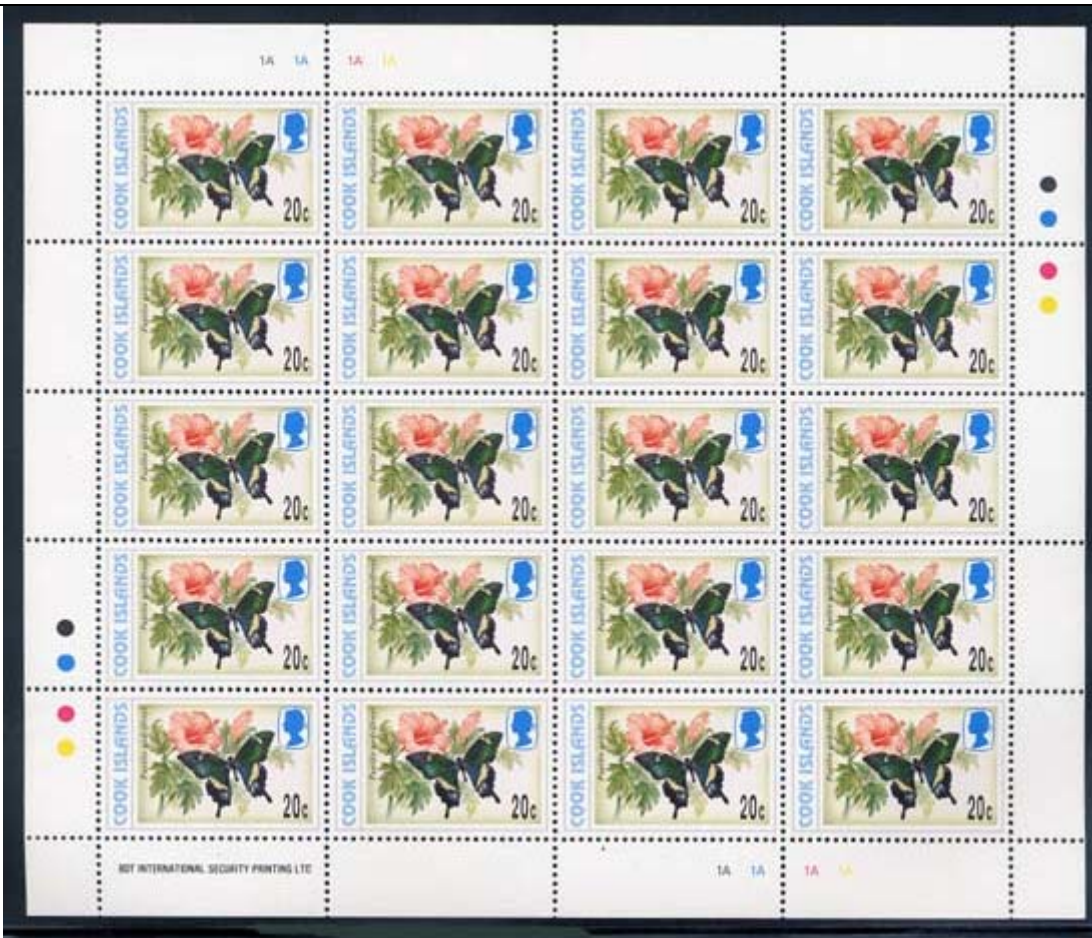
Lepidoptera : Papilionidae : Papilio godeffroyi .