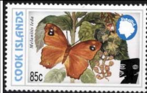
Lepidoptera : Nymphalidae : Melanitis leda .