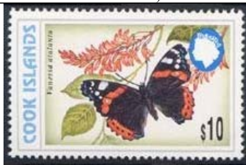
Lepidoptera : Nymphalidae : Vanessa atalanta (18 de Septiembre 1998).