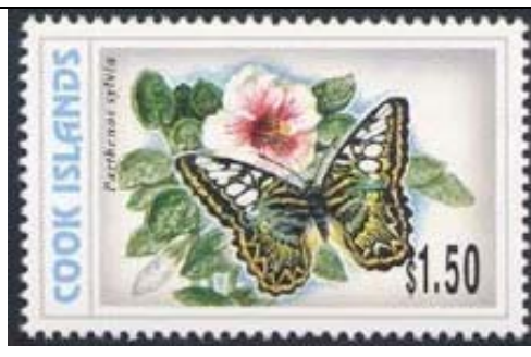
Lepidoptera : Nymphalidae : Parthenos sylvia (11 de Marzo 1998).