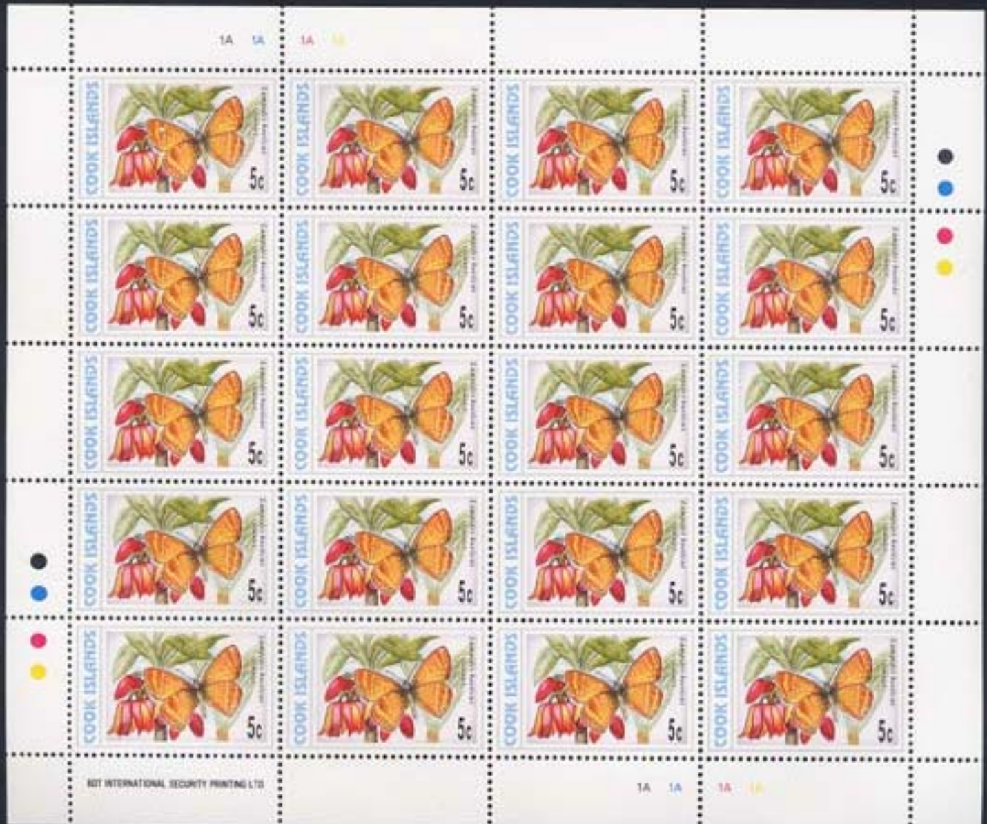
Lepidoptera : Lycaenidae : Lampides boeticus (hembra).

1997-1998 : Idem, Mariposas, hojas enteras (20 valores) (Scott 1215 – 1226 H).