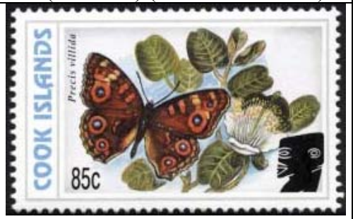
Lepidoptera : Nymphalidae : Precis villida .