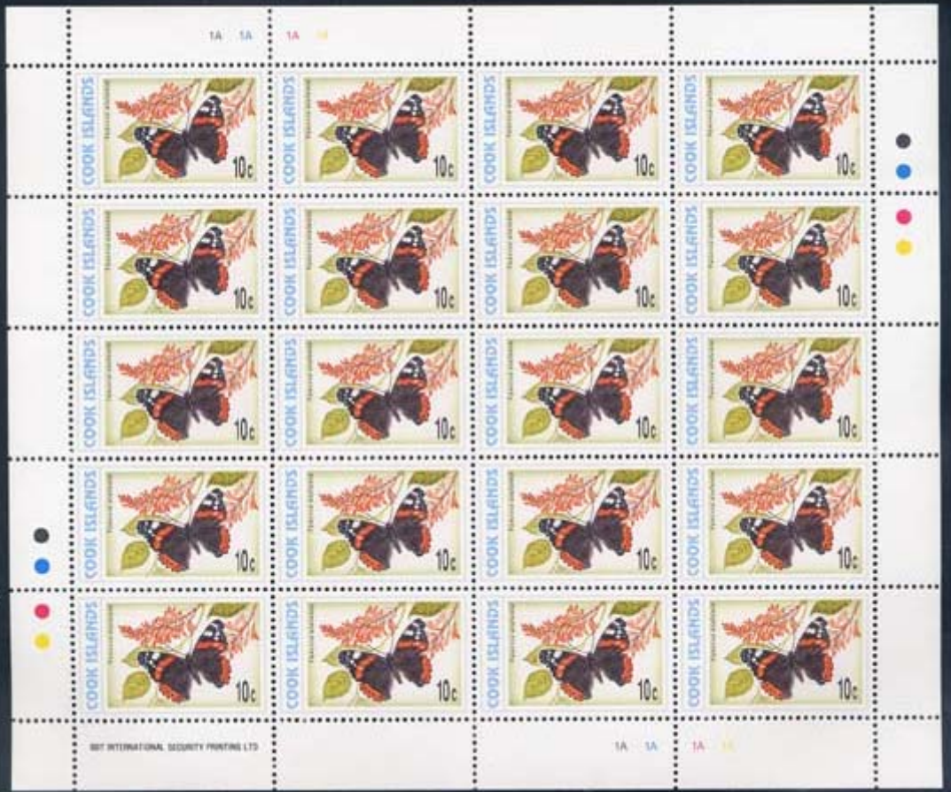
Lepidoptera : Nymphalidae : Vanessa atalanta .