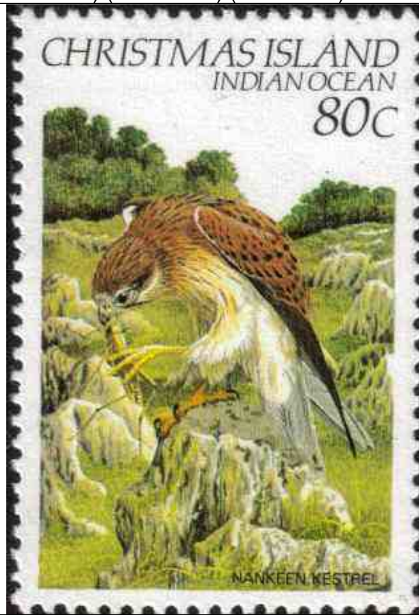
Ave rapace (Nankeen Kestrel) comiendo un Orthoptera : Acrididae.

1983 Febrero 21 : Aves (1 de 4 valores) (Y & T : xxx) (Scott : 129).