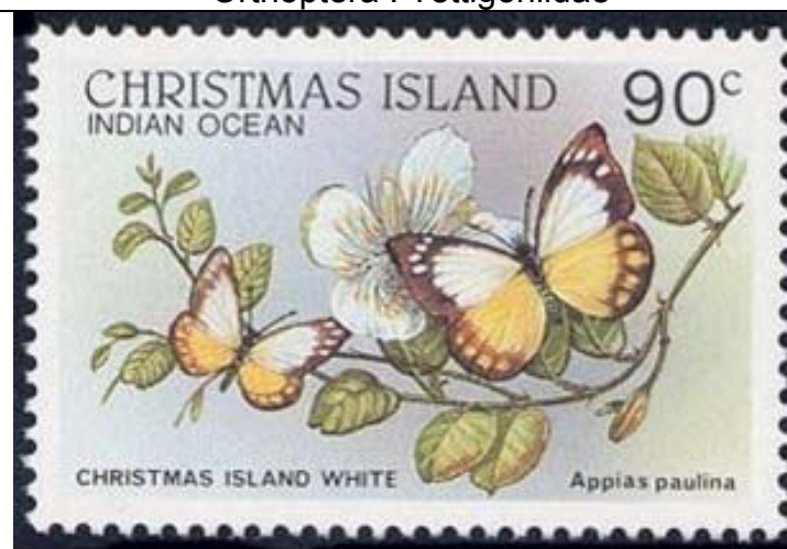
Lepidoptera : Pieridae : Appias paulina .