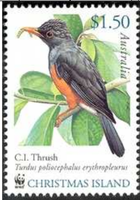
Aves ( Turdus poliocephalus erythropleurus ) comiendo una larva (Lepidoptera).

2002 Mayo 1 : Aves (1 de 3 valores impresos en hojas de 50 sellos) (Y & T : xxx) (Scott : 439).