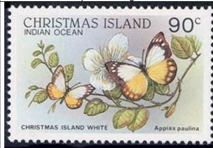
Lepidoptera : Pieridae : Appias paulina .