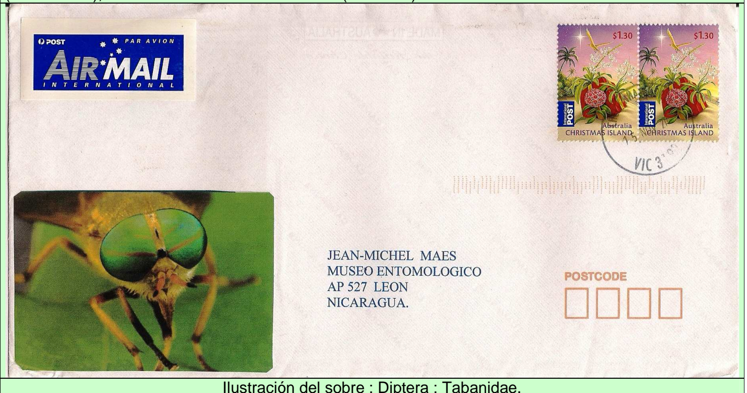
Ilustración del sobre : Diptera : Tabanidae.

2010 Noviembre 15 : Carta ilustrada con Tabano, enviada de Cheltenham, Victoria a León, Nicaragua (13-XII-2010), con sellos de las Islas Christmas (Scott xxx).