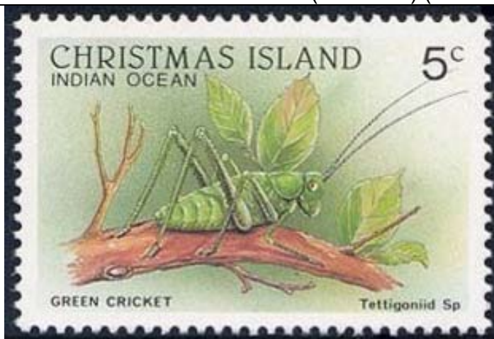
Orthoptera : Tettigoniidae

1988 Marzo 1 : Fauna silvestre (4 valores) (Y & T : xxx) (Scott : 199, 202, 208-209).