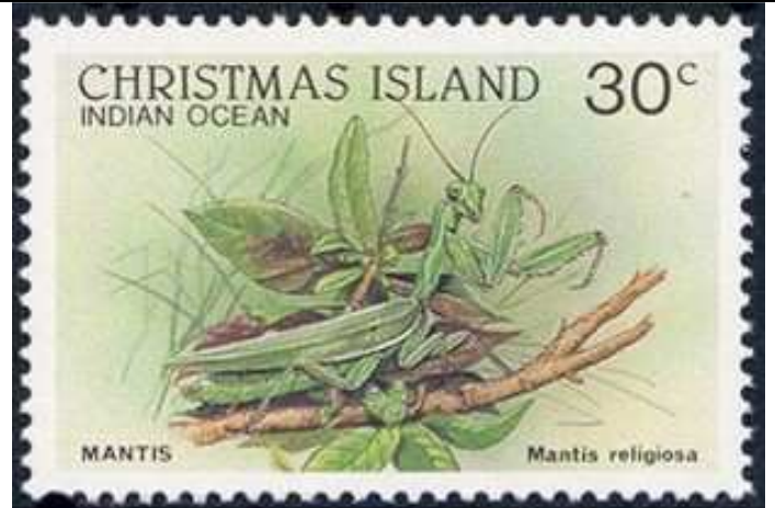
Mantodea : Mantidae : Mantis religiosa .