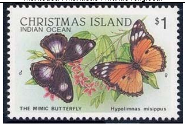
Lepidoptera : Nymphalidae : Hypolimnas misippus .

1988 Marzo 1 : Idem, Fauna silvestre, BF de 16 valores (Y & T : xxx) (Scott : 211 a).