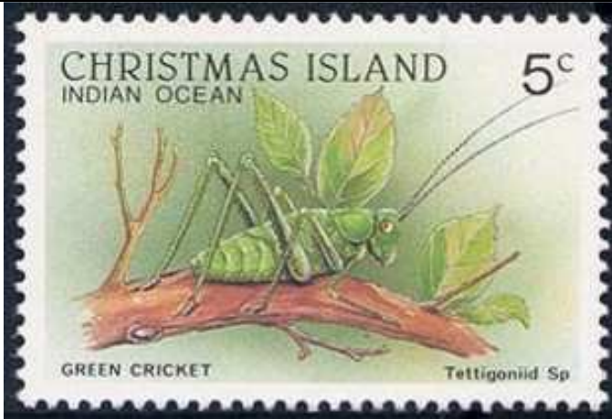
Orthoptera : Tettigoniidae

1988 Marzo 1 : Fauna silvestre (4 valores) (Y & T : xxx) (Scott : 199, 202, 208-209).