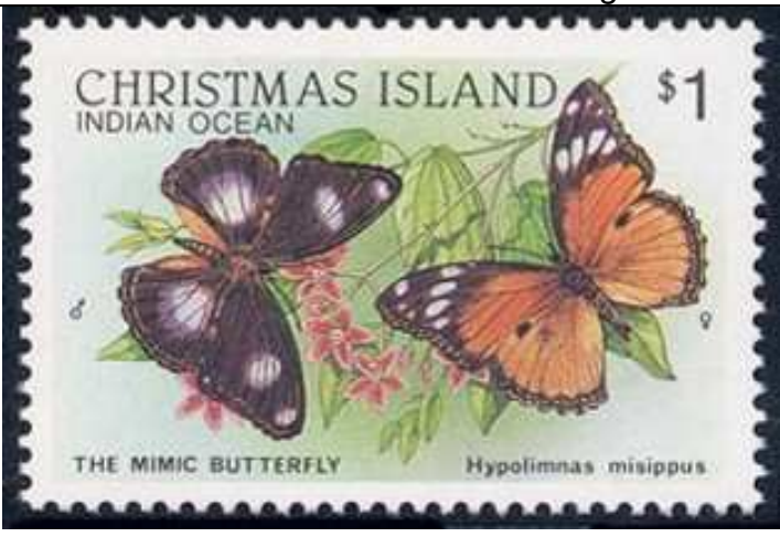
Lepidoptera : Nymphalidae : Hypolimnas misippus .

1988 Marzo 1 : Fauna silvestre, BF de 16 valores (Y & T : xxx) (Scott : 211 a).