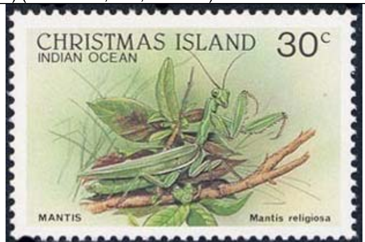
Mantodea : Mantidae : Mantis religiosa .