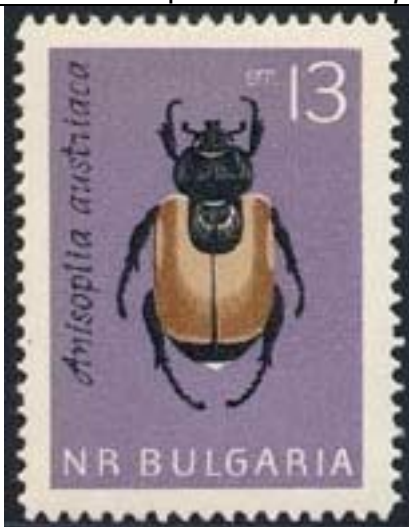
Coleoptera : Scarabaeidae : Melolonthinae : Anisoplia austriaca