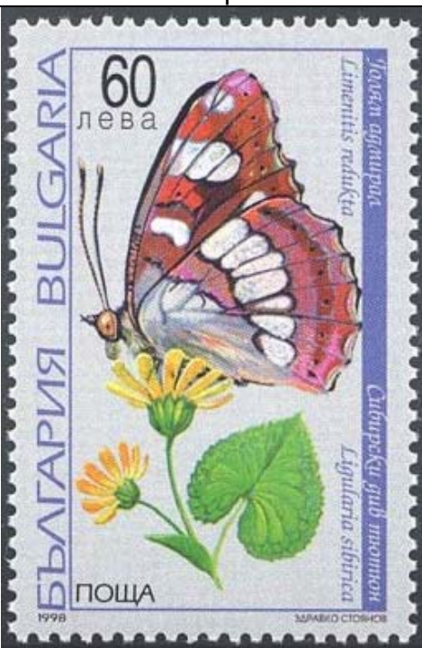
Lepidoptera : Nymphalidae : Limenitis reducta (no es redukta ) sobre Ligularia sibirica .