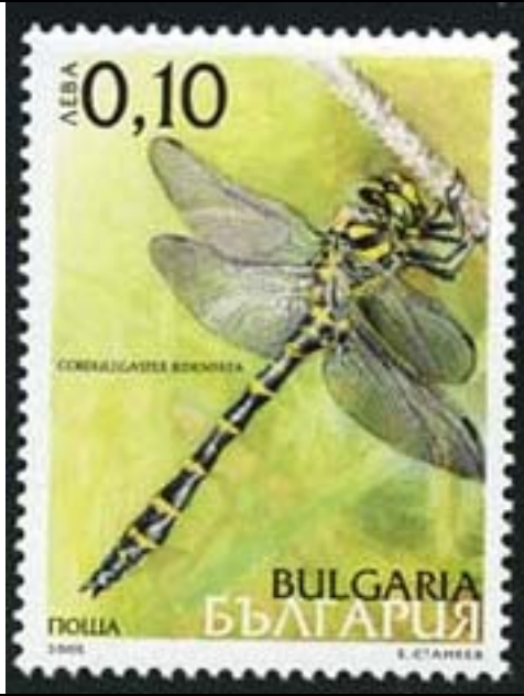
Odonata : Cordulegaster bidentata .

2005 Junio 29 : Odonata (4 valores) (Yvert & Tellier : 4061-4064) (Scott : 4347-4350).