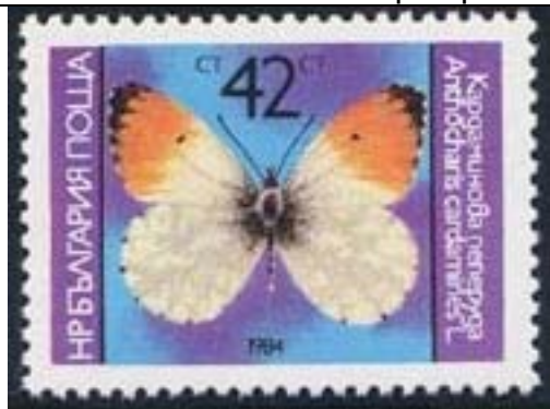
Lepidoptera : Pieridae : Anthocharis cardamines