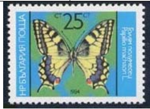
Lepidoptera : Papilionidae : Papilio machaon