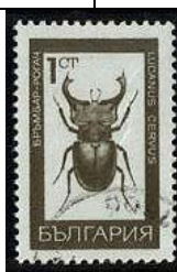
Coleoptera : Lucanidae : Lucanus cervus

1968 Agosto 26 : Idem, Mariposas e insectos, en bloques de 4 estampillas (Scott : 1701-1705).