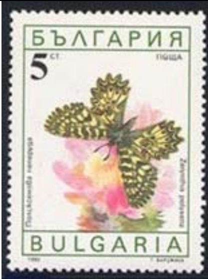
Lepidoptera : Papilionidae : Zerynthia polyxena .

1990 Agosto 8 : Lepidópteros (6 valores emitidos en un BF) (Scott : 3551-3556).