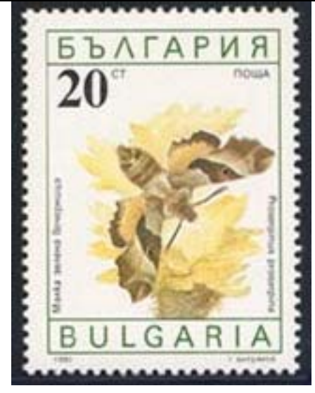
Lepidoptera : Sphingidae : Proserpinus proserpinus .