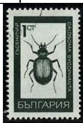
Coleoptera : Carabidae : Calosoma sycophanta

1968 Agosto 26 : Mariposas e insectos (5 valores) (Scott : 1701-1705).