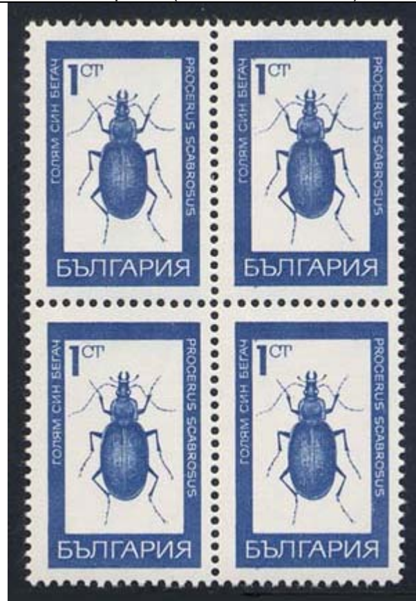
Coleoptera : Carabidae : Procerus scabrosus