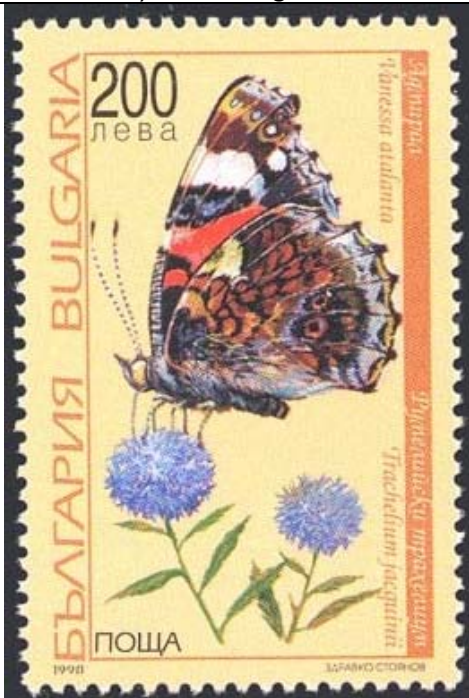
Lepidoptera : Nymphalidae : Vanessa atalanta sobre Trachelium jacquini .