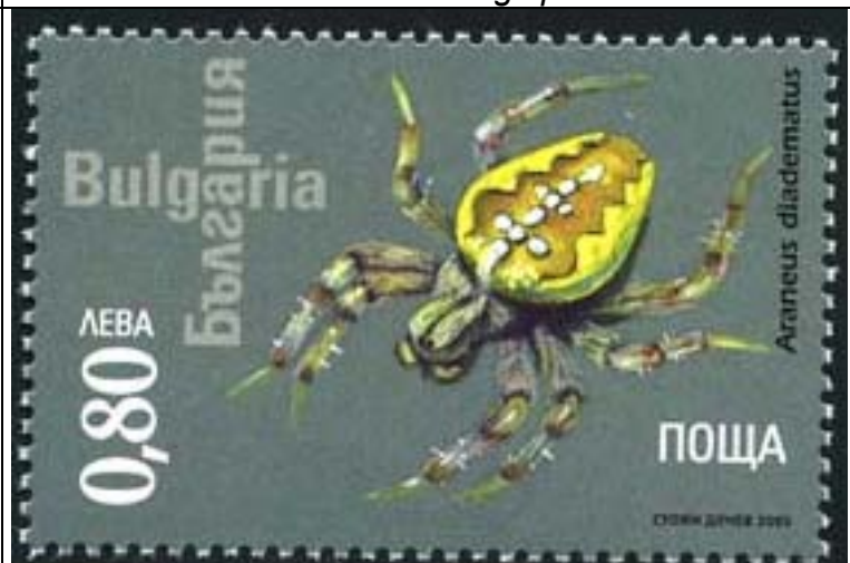
Araneida : Araneidae : Araneus diadematus .