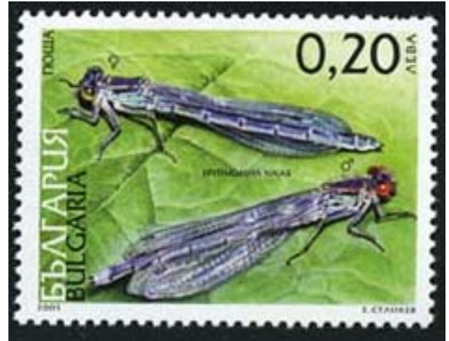
Odonata : Erythromma najas .