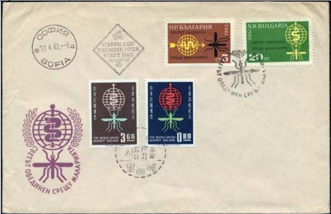
Diptera : Culicidae

1962 April 19 : Idem, El Mundo unido contra la Malaria (Scott : 1218-1219), Primer día de emisión emisión junto con China (Scott : 1342-1343).