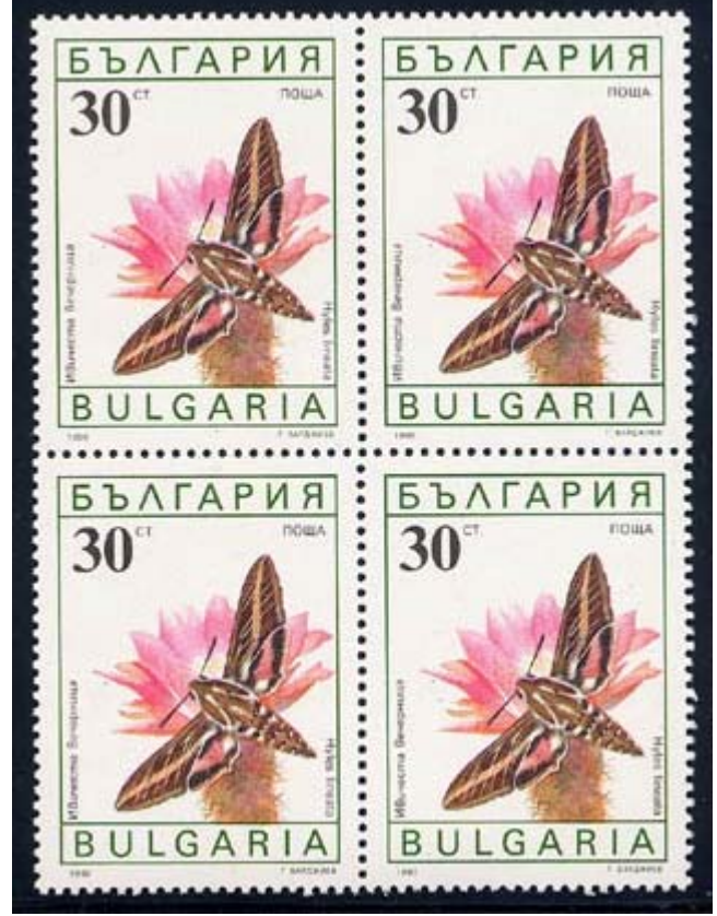
Lepidoptera : Sphingidae : Hyles lineatus .