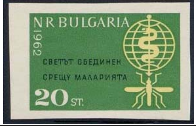
Diptera : Culicidae

1962 April 19 : Idem, El Mundo unido contra la Malaria, no dentado en bloques de 4 (Scott : 1218-1219).