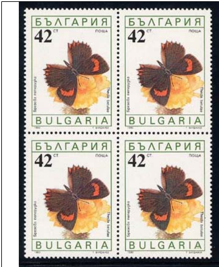
Lepidoptera : Lycaenidae : Thecla betulae .