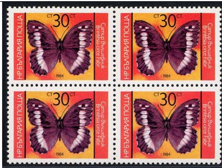
Lepidoptera : Nymphalidae : Brintesia circe