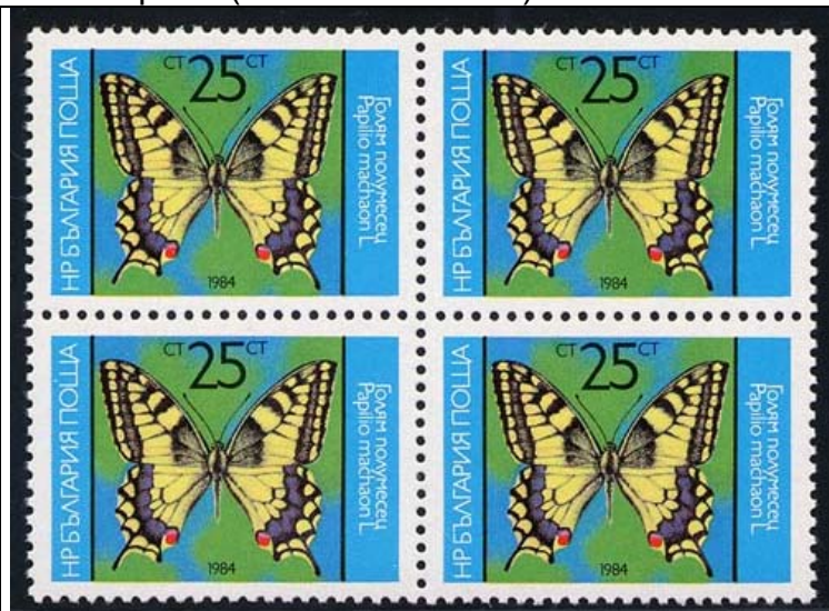
Lepidoptera : Papilionidae : Papilio machaon