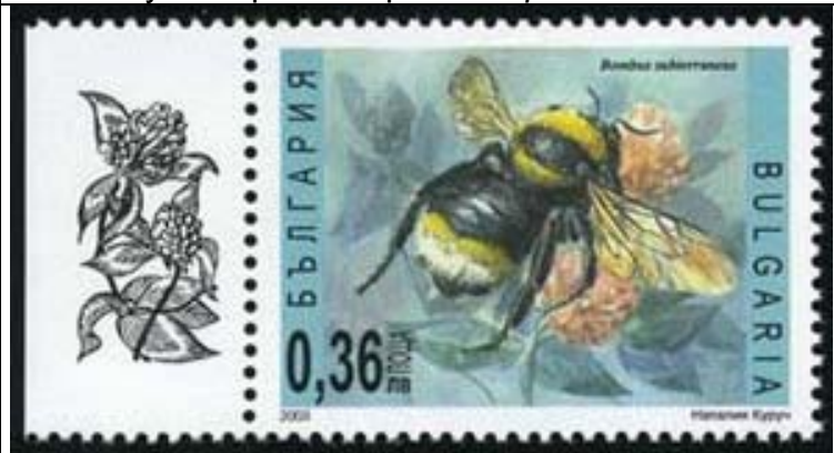
Hymenoptera : Apidae : Bombus subterraneus .