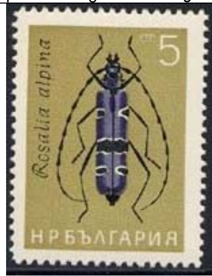
Coleoptera : Cerambycidae : Rosalia alpina