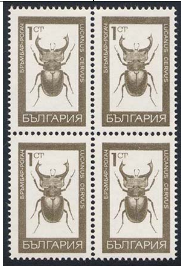
Coleoptera : Lucanidae : Lucanus cervus