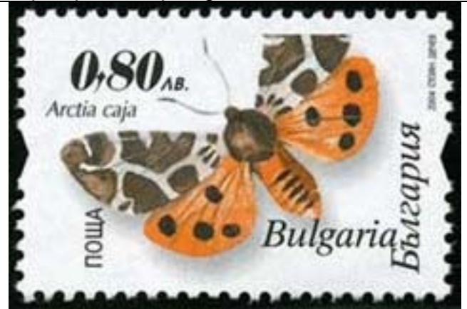
Lepidoptera : Arctiidae : Arctia caja .

2003 Octubre : Idem, Lepidopteros nocturnos, perforaciones nuevas (4 valores) (Scott : 4291-4294).