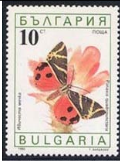
Lepidoptera : Arctiidae : Panaxia quadripunctaria .