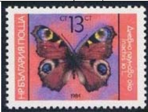
Lepidoptera : Nymphalidae : Inachis io

1984 Diciembre 14 : Mariposas (5 valores + 1 BF) (Scott : 3021-3025 + 3026).