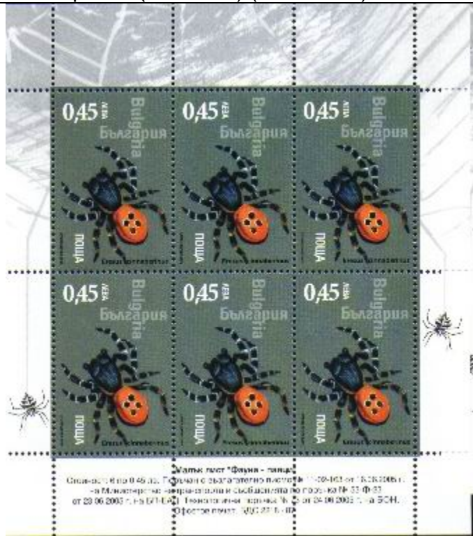
Araneida : Araneidae : Eresus cinnaberinus .

2005 : Idem, Arañas, en hojas completas (4 valores) (Scott : xxx).