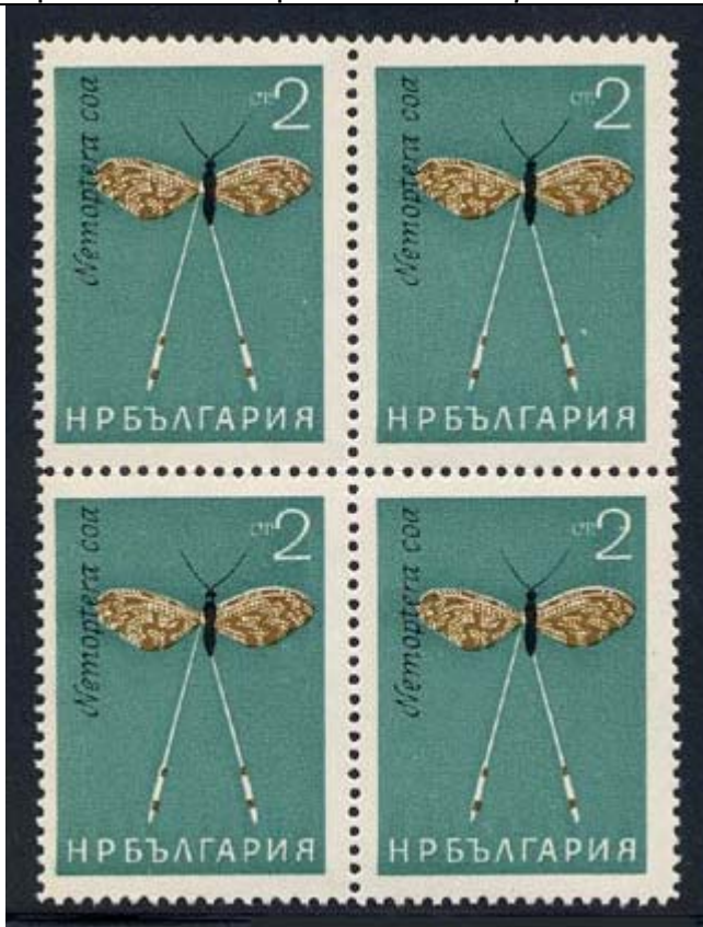
Planipennia : Nemopteridae : Nemoptera coa