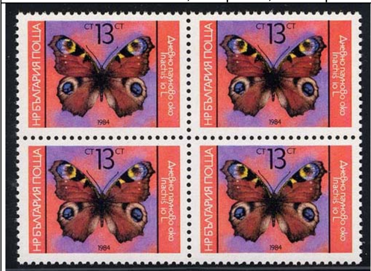
Lepidoptera : Nymphalidae : Inachis io

1984 Diciembre 14 : Idem, Mariposas, en bloques de 4 estampillas (Scott : 3021-3025).