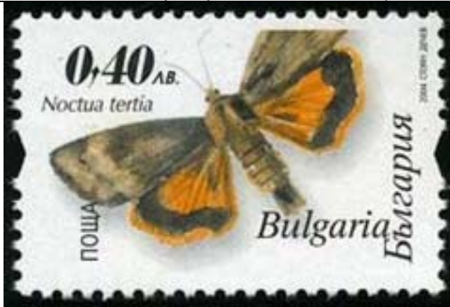
Lepidoptera : Noctuidae : Noctua tertia .

2003 Enero 15 : Lepidopteros nocturnos (4 valores) (Scott : 4291-4294).