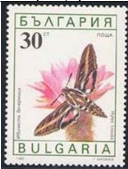
Lepidoptera : Sphingidae : Hyles lineatus .