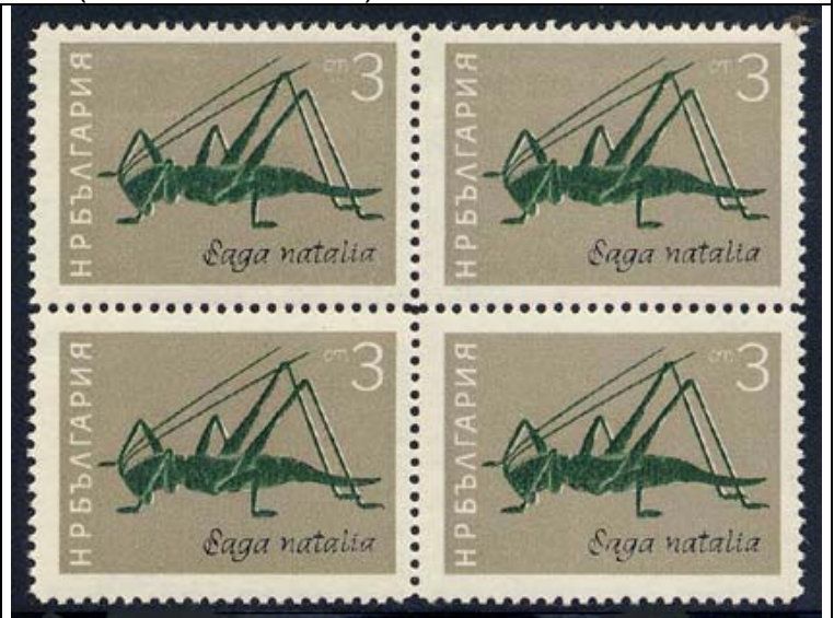
Orthoptera : Tettigoniidae : Saga natalia