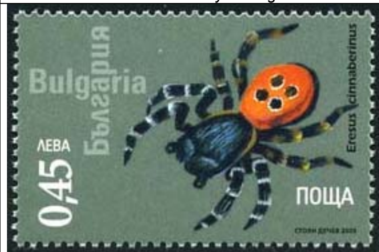
Araneida : Araneidae : Eresus cinnaberinus .