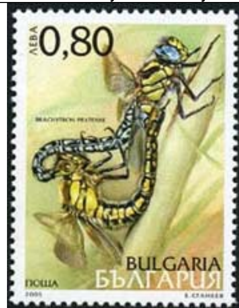
Odonata : Brachytriton pratense .