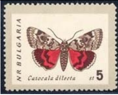
Lepidoptera : Noctuidae : Catocala dilecta