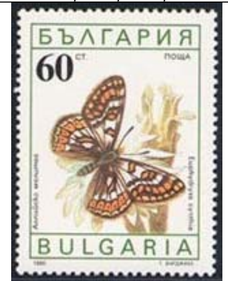
Lepidoptera : Nymphalidae : Euphydryas cynthia .