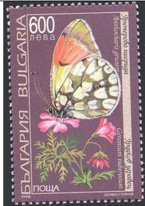
Lepidoptera : Pieridae : Anthocharis gruneri sobre Geranium tuberosum .