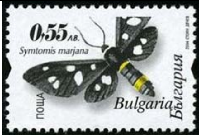
Lepidoptera : Syntomidae : Syntomis marjana (no Syntomis con m).