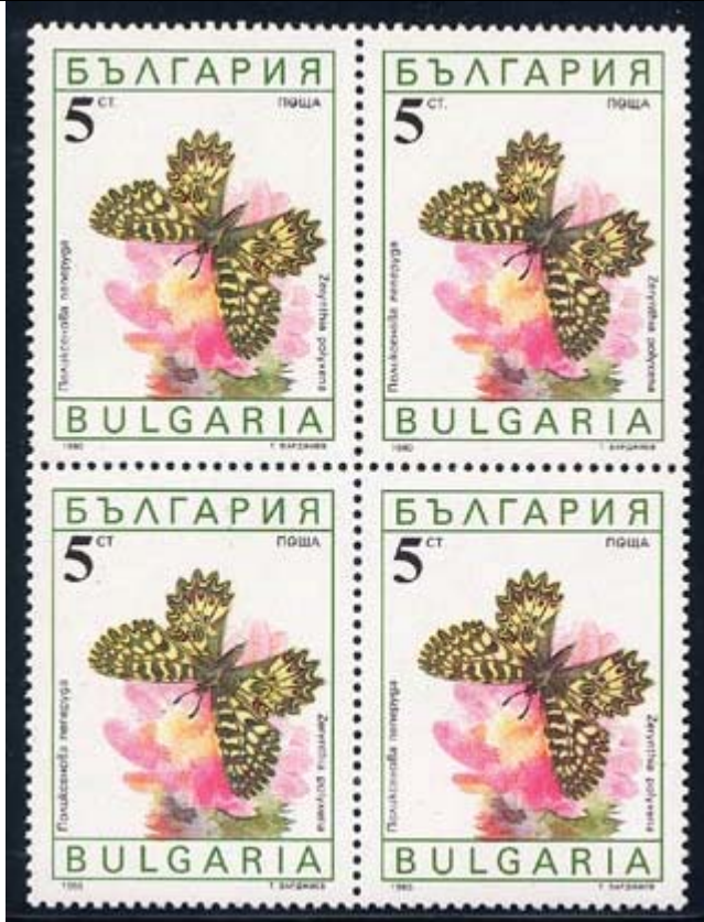
Lepidoptera : Papilionidae : Zerynthia polyxena

1990 Agosto 8 : Idem, Lepidópteros, en bloque de 4 estampillas (Scott : 3551-3556).