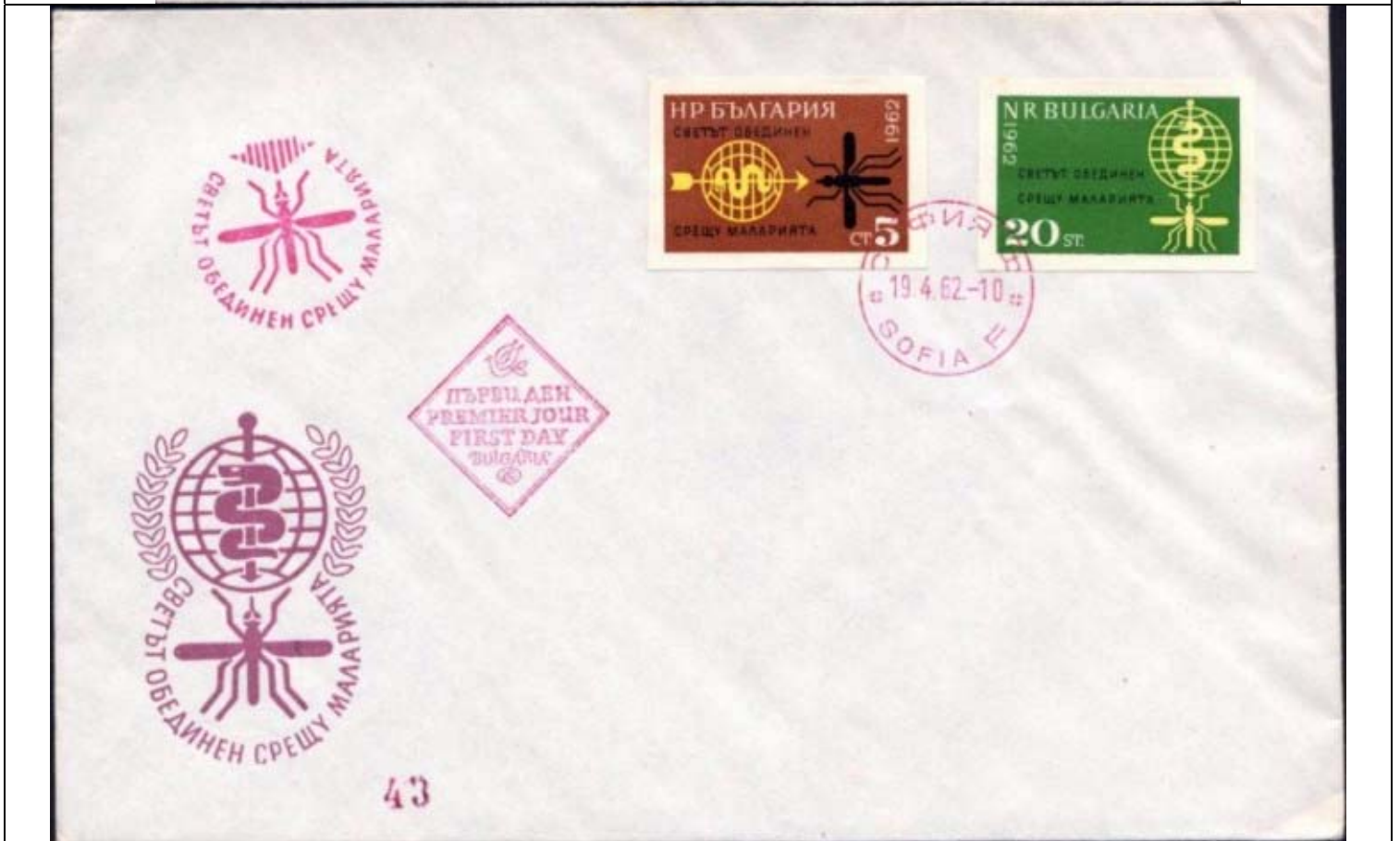
Diptera : Culicidae