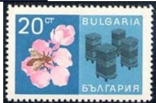
Cultivo de girasol, Apicultura : Hymenoptera : Apidae : Apis mellifera (colmenas).