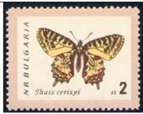
Lepidoptera : Papilionidae : Thais cerisyi