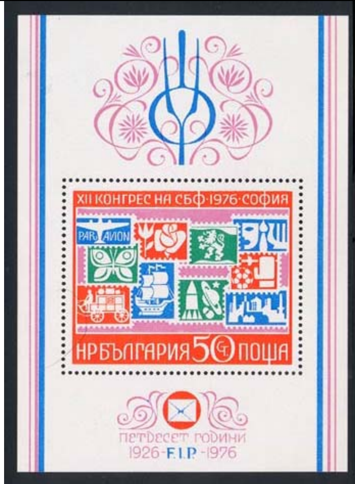
Lepidoptera (Mariposa estilizada).

1976 Junio 5 : 50 Aniversario y 12 Congreso de la Federación Internacional de Filatelia (F.I.P.) (Scott : 2349).