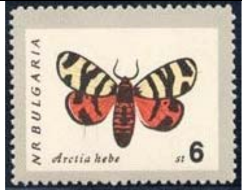
Lepidoptera : Arctiidae : Arctia hebe