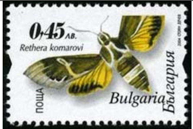
Lepidoptera : Sphingidae : Rethera komarovi .