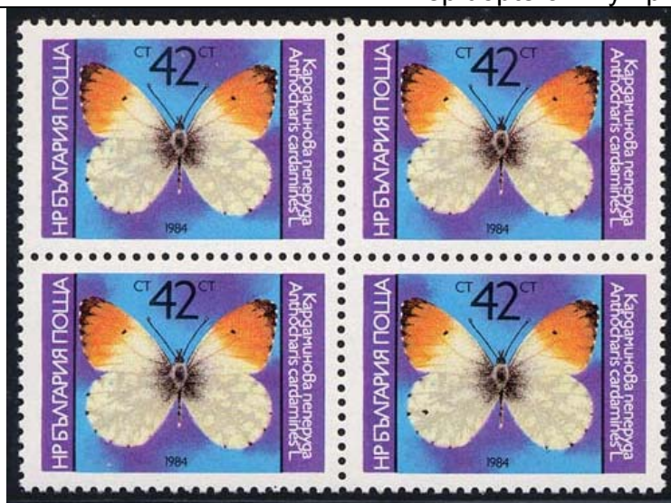
Lepidoptera : Pieridae : Anthocharis cardamines