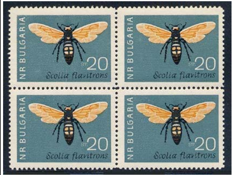
Hymenoptera : Scoliidae : Scolia flavifrons

1964 Mayo 16 : Idem, Insectos, Primer día de circulación (6 valores) (Scott : 1332-1337).