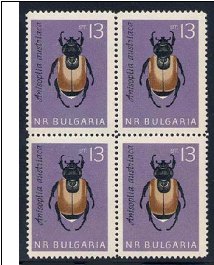
Coleoptera : Scarabaeidae : Melolonthinae : Anisoplia austriaca