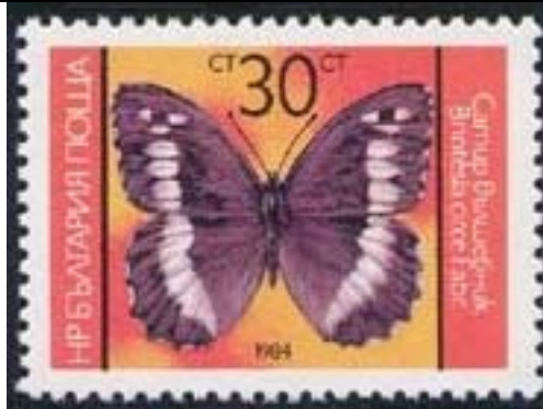
Lepidoptera : Nymphalidae : Brintesia circe