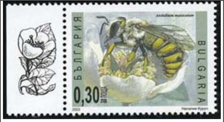
Hymenoptera : Apidae : Anthidium manicatum .