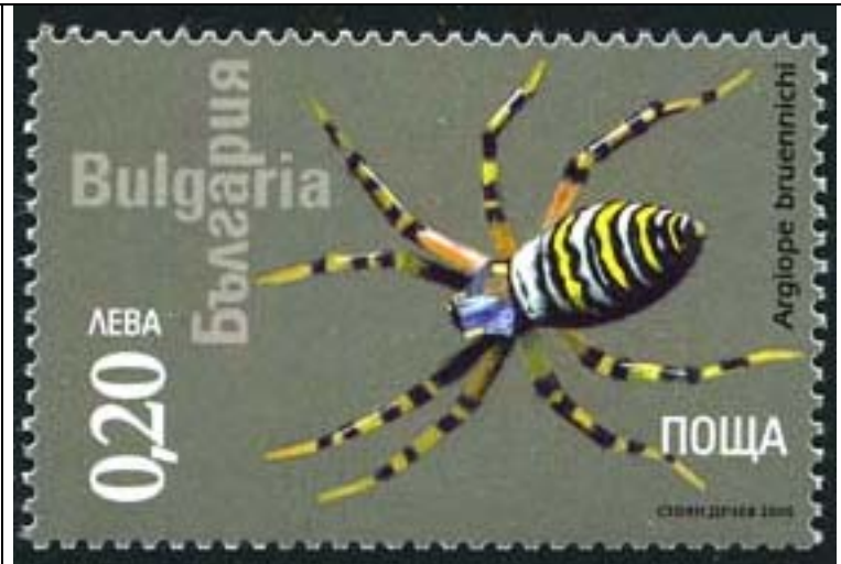
Araneida : Araneidae : Argiope bruennichi .