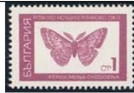
Lepidoptera : Geometridae : Perisomena caecigena