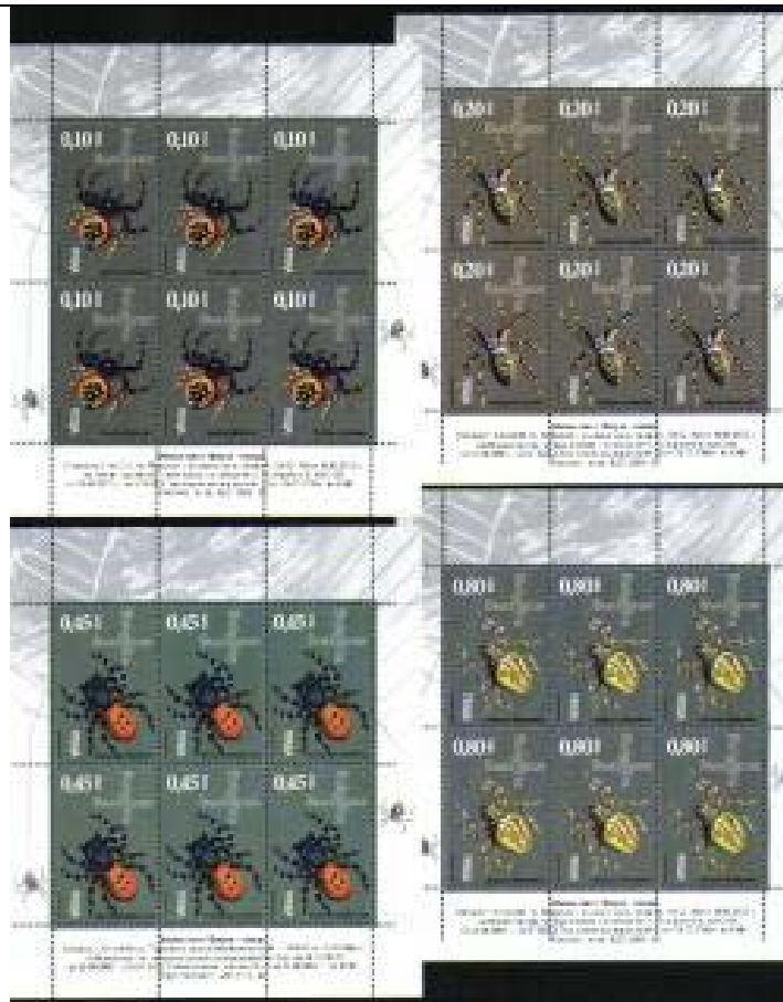
Araneida : Salticidae : Synema globosum + Araneida : Araneidae : Argiope bruennichi + Araneida : Araneidae : Eresus cinnaberinus + Araneida : Araneidae : Araneus diadematus .