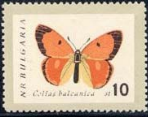
Lepidoptera : Pieridae : Colias balcanica