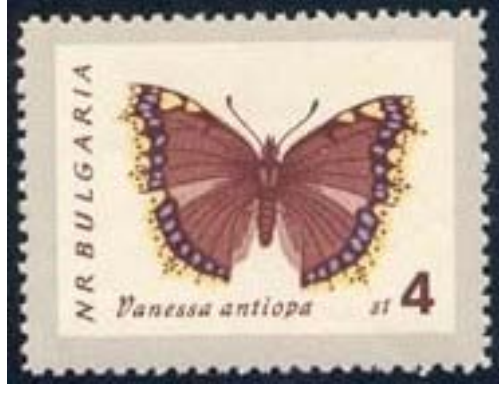
Lepidoptera : Nymphalidae : Nymphalis antiopa