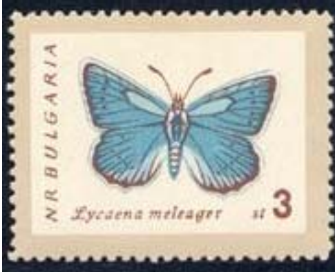
Lepidoptera : Lycaenidae : Lycaena meleager