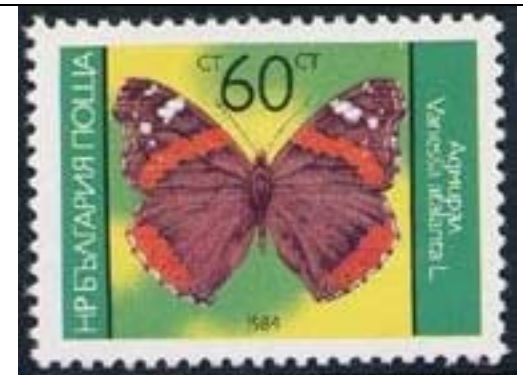
Lepidoptera : Nymphalidae : Vanessa atalanta