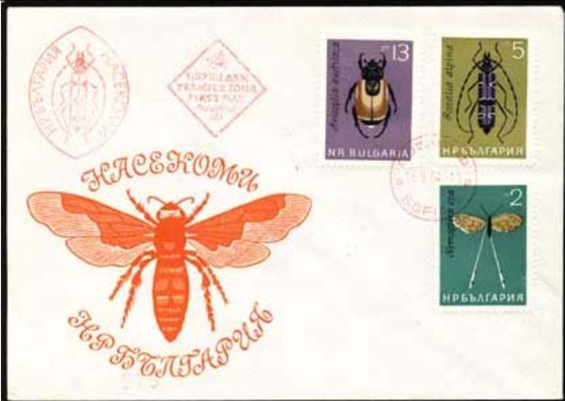
Coleoptera : Scarabaeidae : Melolonthinae : Anisoplia austriaca + Coleoptera : Cerambycidae : Rosalia alpina + Planipennia : Nemopteridae : Nemoptera coa

1964 Mayo 16 : Idem, Insectos, Primer día de circulación (6 valores) (Scott : 1332-1337).