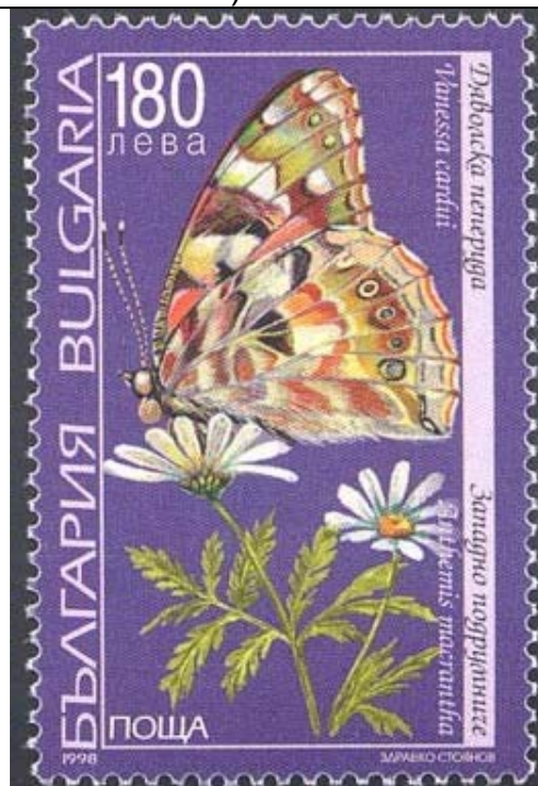
Lepidoptera : Nymphalidae : Cynthia cardui sobre Anthemis macrantha .