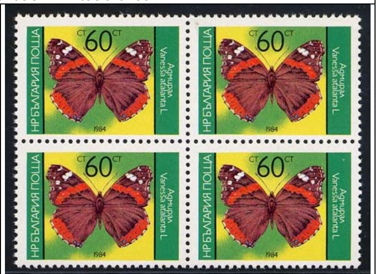
Lepidoptera : Nymphalidae : Vanessa atalanta