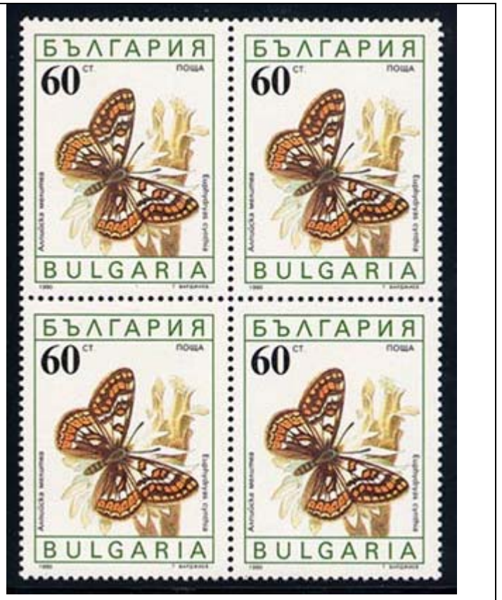
Lepidoptera : Nymphalidae : Euphydryas cynthia .