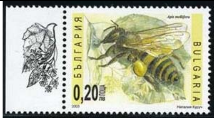
Hymenoptera : Apidae : Apis mellifera .

2003 Junio 17 : Abejas (4 valores) (Scott : 4259-4262).