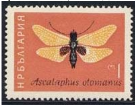
Planipennia : Ascalaphidae : Ascalaphus otomanus

1964 Mayo 16 : Insectos (6 valores) (Scott : 1332-1337).