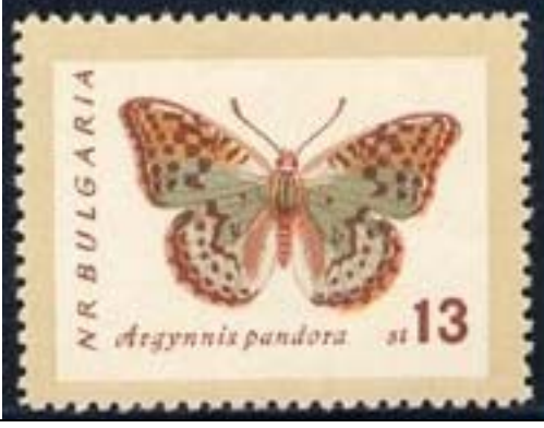
Lepidoptera : Nymphalidae : Argynnis pandora