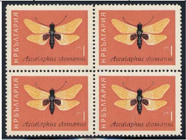
Planipennia : Ascalaphidae : Ascalaphus otomanus

1964 Mayo 16 : Idem, Insectos, bloques de 4 estampillas (Scott : 1332-1337).