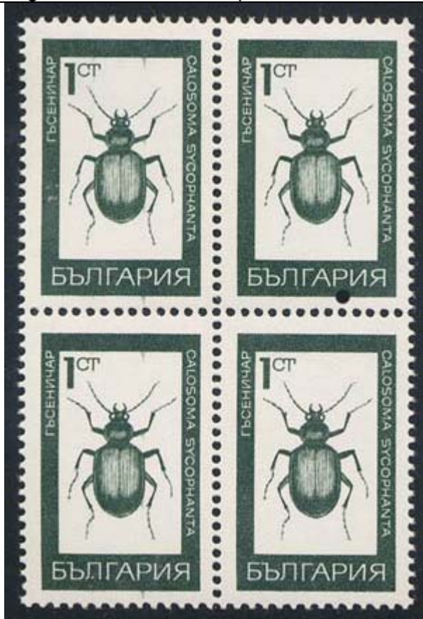
Coleoptera : Carabidae : Calosoma sycophanta

1968 Agosto 26 : Idem, Mariposas e insectos, en bloques de 4 estampillas (Scott : 1701-1705).