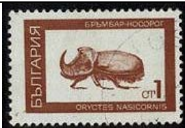
Coleoptera : Scarabaeidae : Dynastinae : Oryctes nasicornis