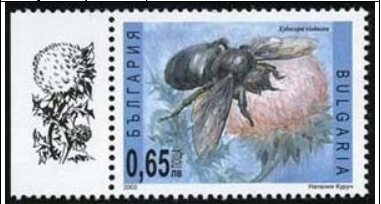
Hymenoptera : Anthophoridae : Xylocopa violacea .