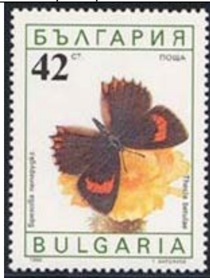
Lepidoptera : Lycaenidae : Thecla betulae .