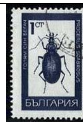
Coleoptera : Carabidae : Procerus scabrosus