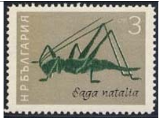
Orthoptera : Tettigoniidae : Saga natalia