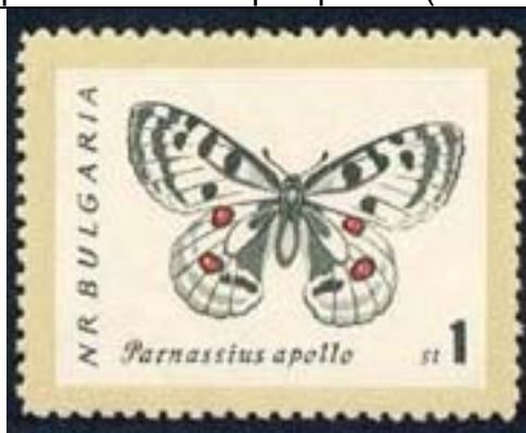
Lepidoptera : Papilionidae : Parnassius apollo

1962 Septiembre 13 : Lepidópteros (Scott : 1238-1245).