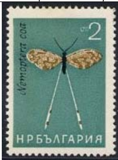
Planipennia : Nemopteridae : Nemoptera coa