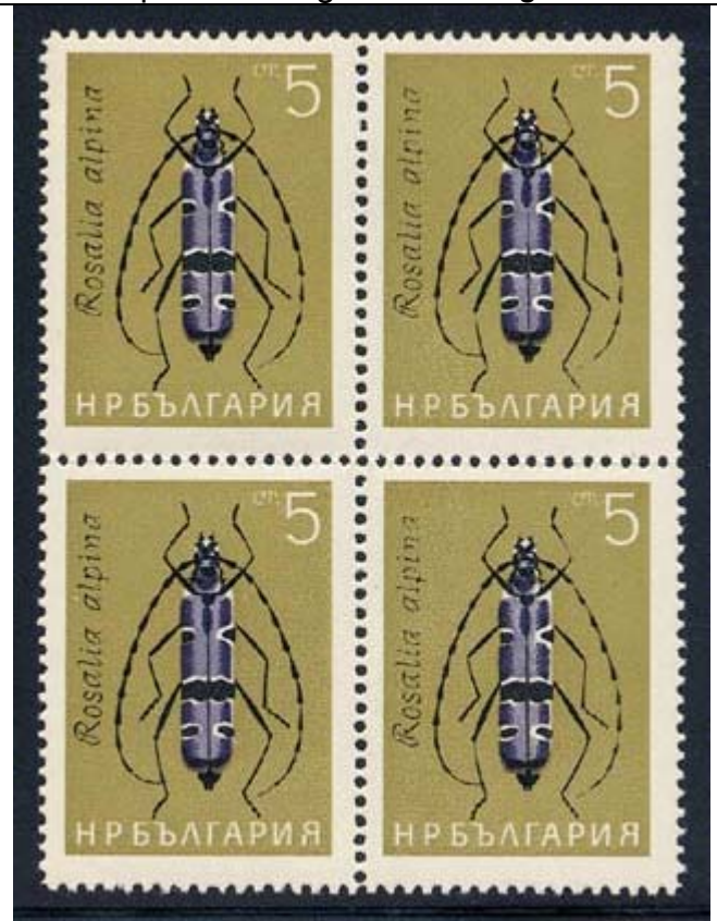
Coleoptera : Cerambycidae : Rosalia alpina