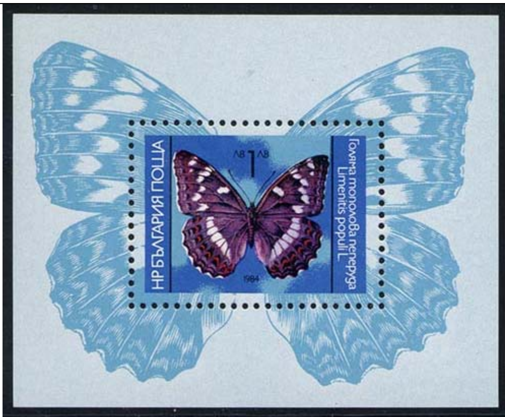
Lepidoptera : Nymphalidae : Limenitis populi

1984 Diciembre 14 : Idem, Mariposas, en bloques de 4 estampillas (Scott : 3021-3025).