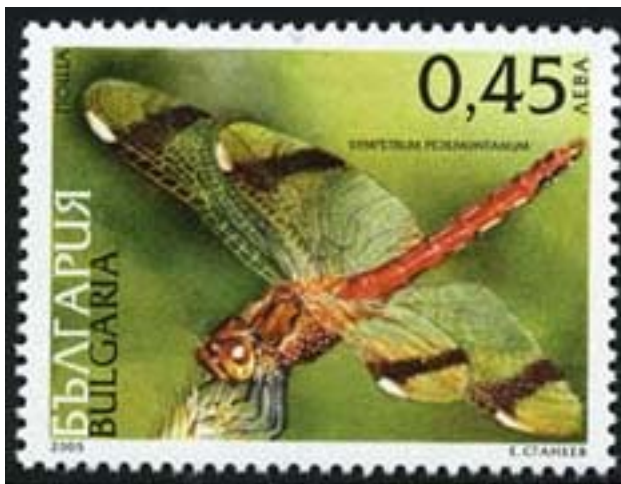
Odonata : Sympetrum pedemontanum .