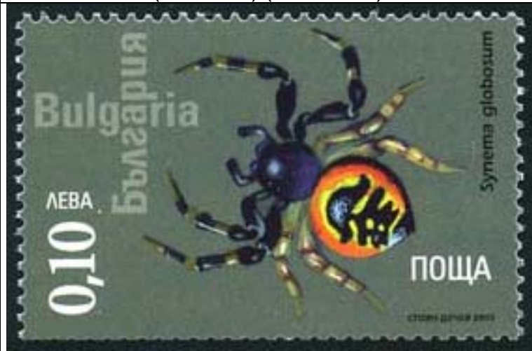
Araneida : Salticidae : Synema globosum .

2005 : Arañas (4 valores) (Scott : xxx).