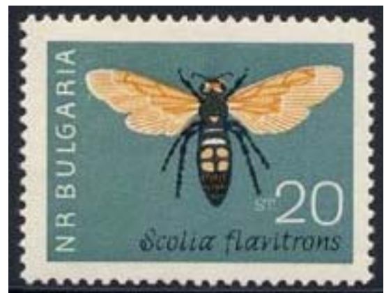
Hymenoptera : Scoliidae : Scolia flavifrons (no se escribe flavifrons con t)