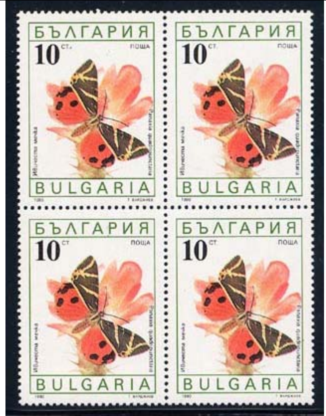
Lepidoptera : Arctiidae : Panaxia quadripunctaria .