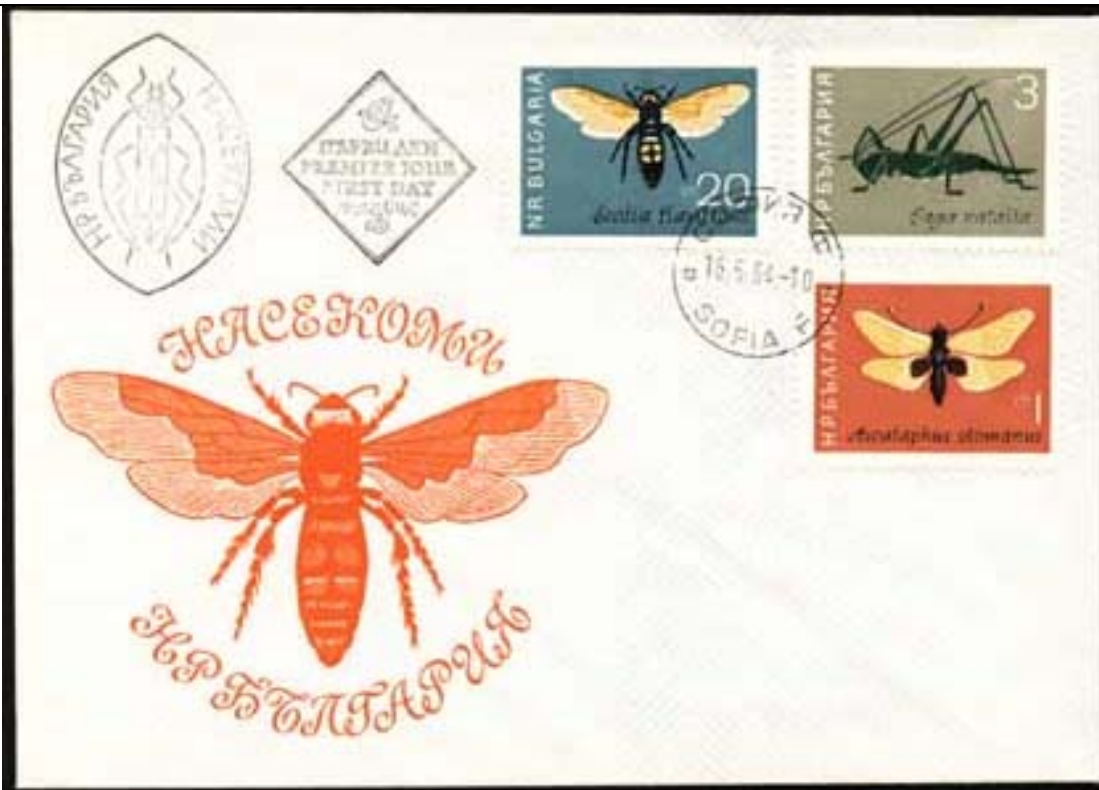
Hymenoptera : Scoliidae : Scolia flavifrons (no se escribe flavitrans con t) + Orthoptera : Tettigoniidae : Saga natalia + Planipennia : Ascalaphidae : Ascalaphus othmanus .

1967 Julio 15 y 24 : Agricultura (3 de 12 valores) (Scott : 1602, 1608-1609).