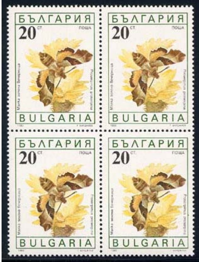
Lepidoptera : Sphingidae : Proserpinus proserpinus .