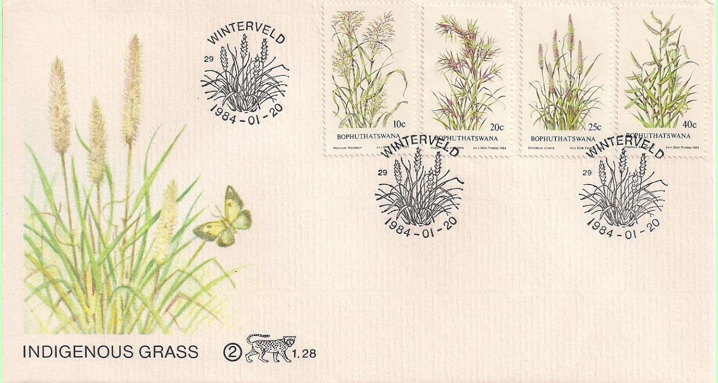
Ilustración del sobre : Lepidoptera : Pieridae : Eurema sp

1984 Enero 20 : Hierbas, primer día de circulación (Scott : 116-119), cancelado en Winterveld.