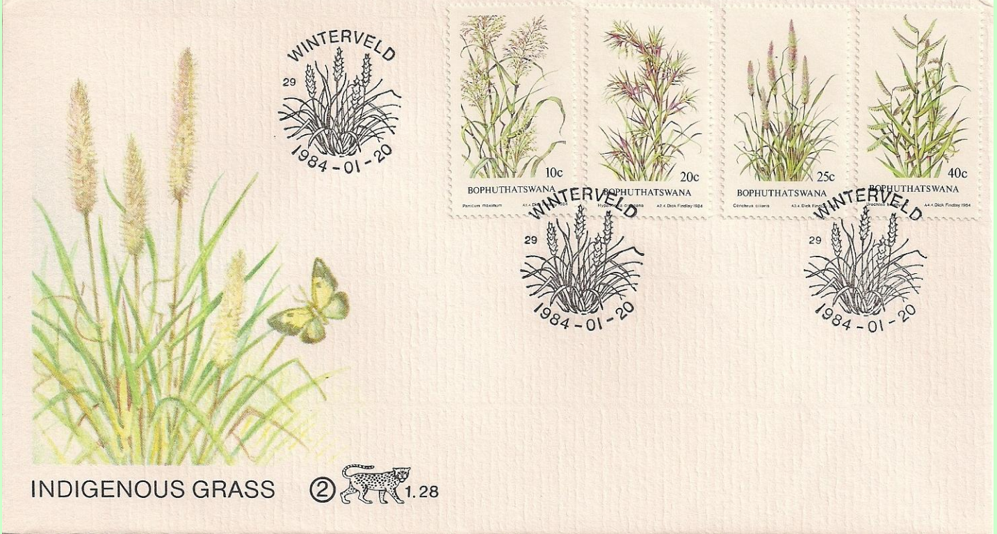
Ilustración del sobre : Lepidoptera : Pieridae : Eurema sp

1984 Enero 20 : Hierbas, primer día de circulación (Scott : 116-119), cancelado en Winterveld.