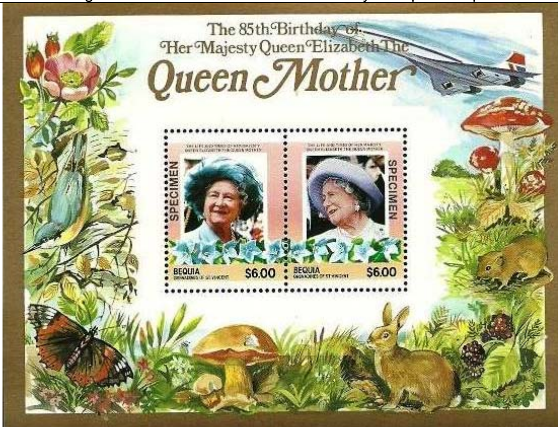
Ilustración en margen del HF: Lepidoptera : Nymphalidae.

Ilustración en margen del BF: Odonata : Aeschnidae + Hymenoptera : Apidae : Bombus sp.