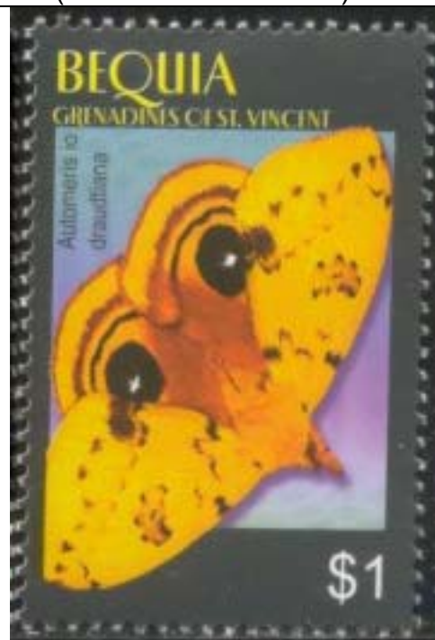
Lepidoptera : Saturniidae : Automeris io draudtiana .