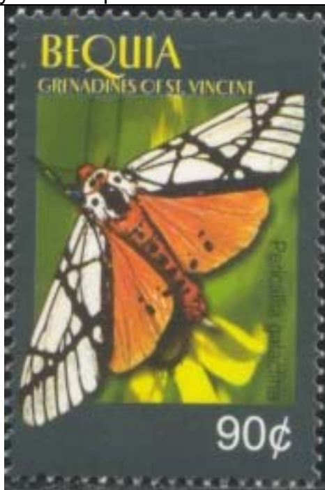
Lepidoptera : Arctiidae : Pericallia galactina .

2005 July 26 : Mariposas nocturnas del Caribe, 4 valores + 1 HF (Scott : 361-364 + 365).