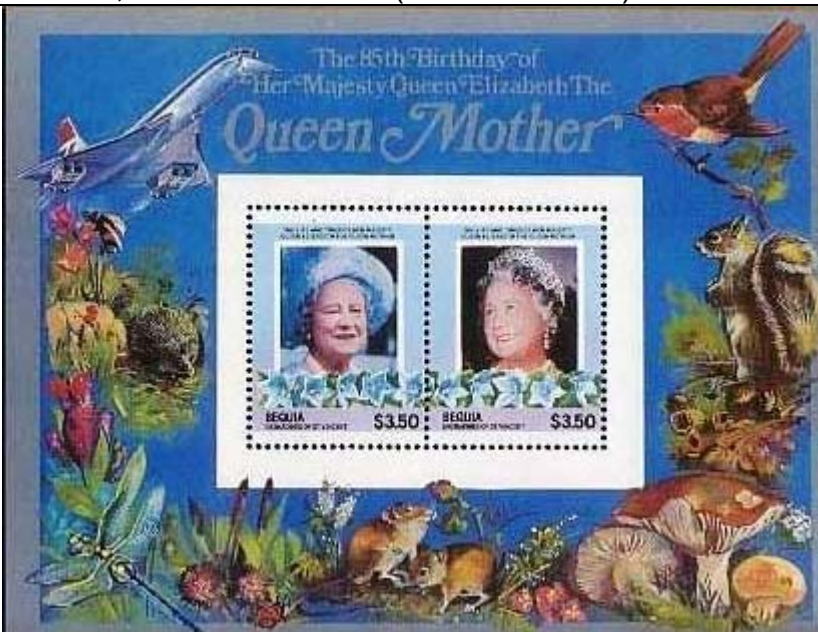
Ilustración en margen del BF: Odonata : Aeschnidae + Hymenoptera : Apidae : Bombus sp.

1985 Agosto 29 : Reina Madre, 2 BF de 2 valores (Scott : 211-212).