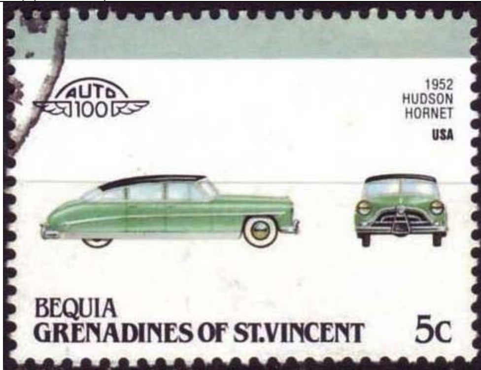
Carro Hudson Hornet (avispa) (Hymenoptera : Vespidae).

1987 Julio 22 : Carros, emitidos en pares, uno con el carro de frente y de perfil, el otro con el carro en acción (1 de 8 pares) (Scott : 89).