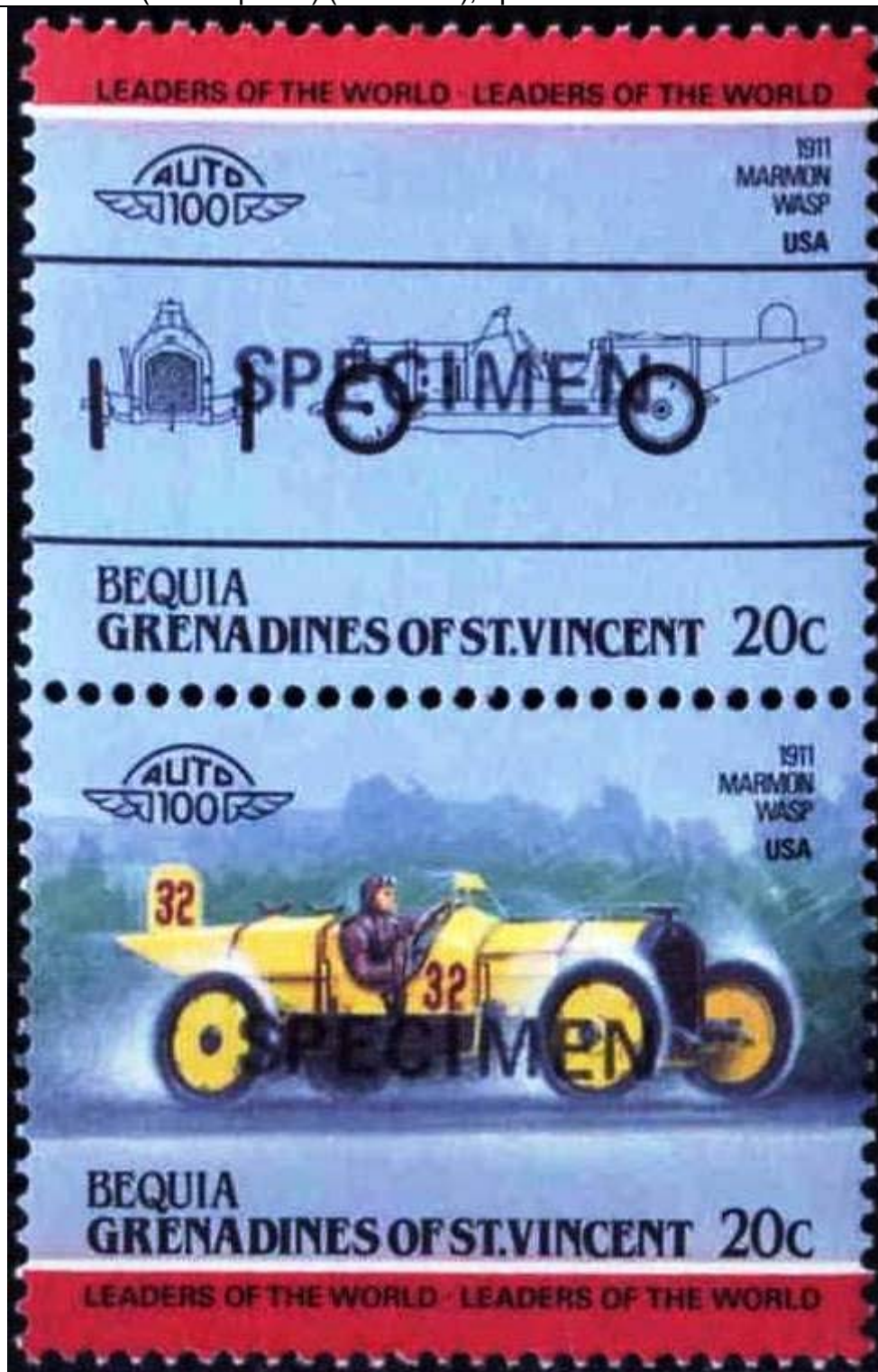
Carro Marmon Wasp (avispa) (Hymenoptera : Vespidae).

1985 Diciembre 19 : Carros (1 de 8 pares) (Scott : 91), specimen.