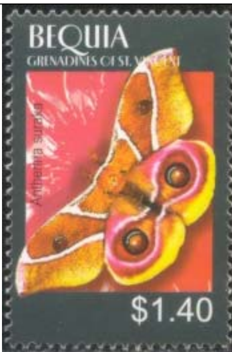
Lepidoptera : Saturniidae : Antherea suraka .