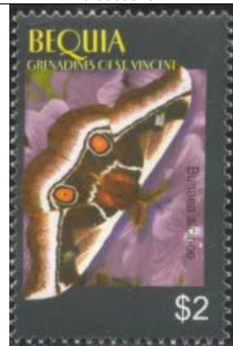
Lepidoptera : Saturniidae : Bunaea alcinoe . (Esta especie es de Africa).