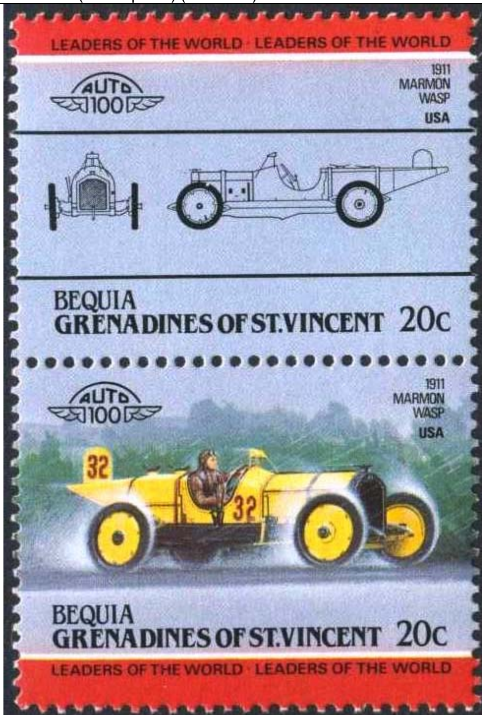
Carro Marmon Wasp (avispa) (Hymenoptera : Vespidae).