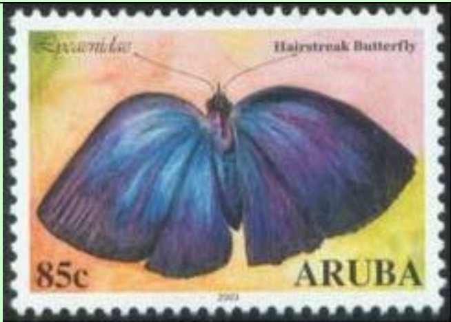
Lepidoptera : Lycaenidae.