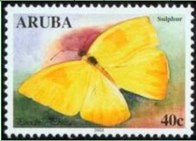
Lepidoptera : Pieridae : Phoebis philea .

2003 Julio 31 : Mariposas (Scott : 233-236)