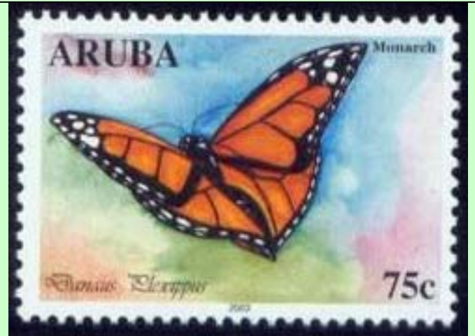
Lepidoptera : Nymphalidae : Danainae : Danaus plexippus .