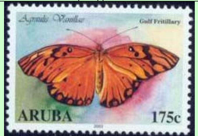
Lepidoptera : Nymphalidae : Heliconinae : Agraulis vanillae .