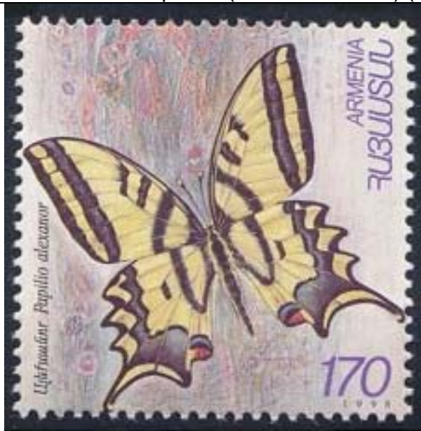
Lepidoptera : Papilionidae : Papilio alexanor .

1998 Junio 26 : Mariposas (Michel: 337-338) (Scott : 579-580).