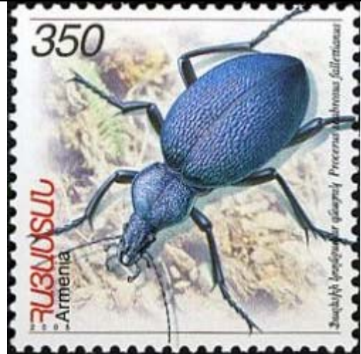
Coleoptera : Carabidae : Procerus scabrosus fallettianus .