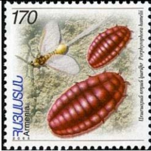
Homoptera : Coccidae : Porphyrophora hamelii .

2006 Marzo 28 : Insectos (Y & T : 489/490) (Scott : xxx).