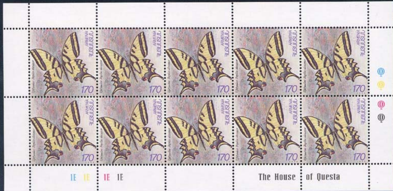
Lepidoptera : Papilionidae : Papilio alexanor .

1998 Junio 26 : Mariposas, hojas enteras (Scott : 579-580).