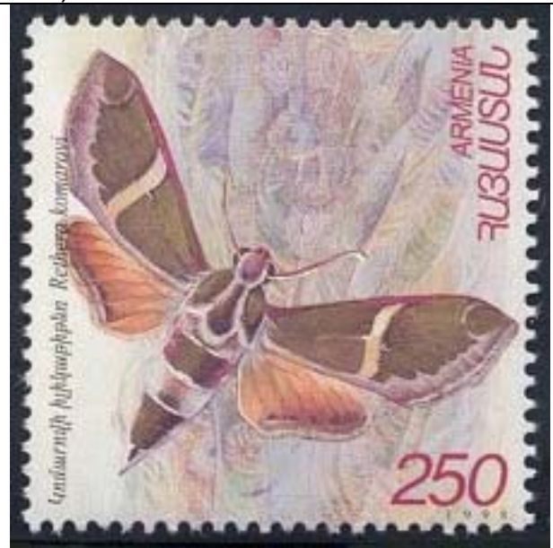
Lepidoptera : Sphingidae : Rethera komarovi .