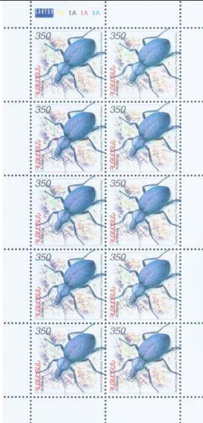
Coleoptera : Carabidae : Procerus scabrosus fallettianus .