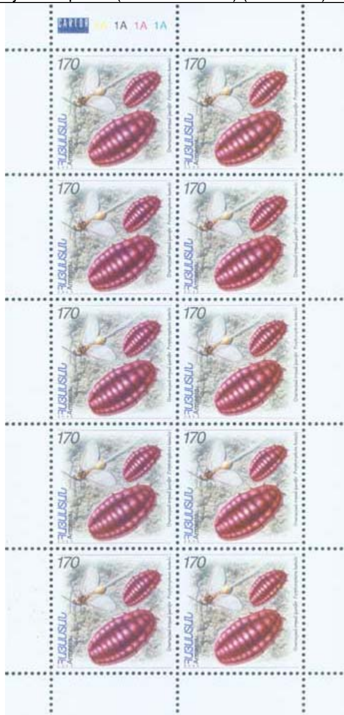
Homoptera : Coccidae : Porphyrophora hamelii .

2006 Marzo 28 : Insectos, hojas completas (Y & T : 489/490) (Scott : xxx).