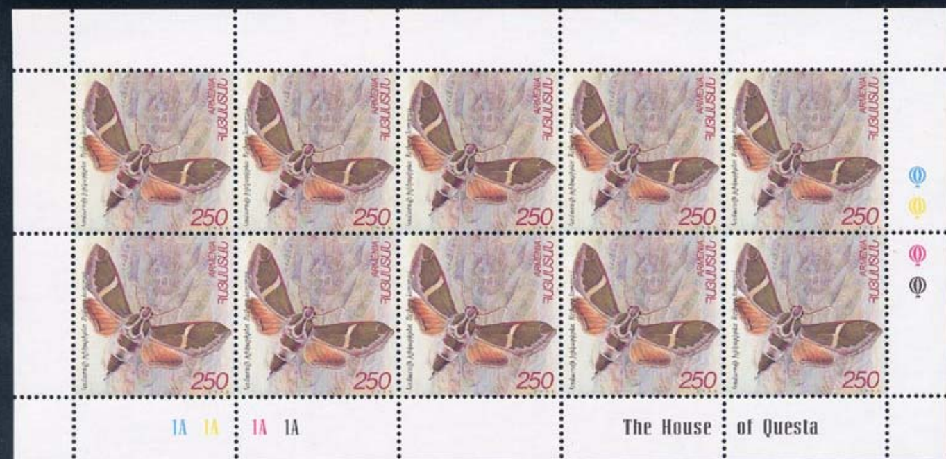
Lepidoptera : Spingidae : Rethera komarovi .