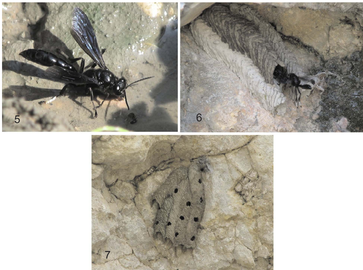
Figure 5-7. Aspectos de la historia natural de T. mexicanum . 5) Hembra recolectando fango para la construcción del nido. 6) Hembra llegando al nido con fango, mientras el macho espera en la entrada, donde la ayudará en la construcción. 7) Nido tubular que muestra los orificios de emergencia de los adultos al nacer.

Acrónimos: York University, Departamento de Biología (YU); Museo Nacional de Historia Natural de Cuba (MNHNCu); colección de Jesús E. Marcano (Instituto de Investigaciones Botánicas y Zoológicas, Dr. Rafael María Moscoso, Universidad Autónoma de Santo Domingo, República Dominicana) (CM); Canadian National Collection of Insects and Related Arthropods, Ottawa (CNC); y colección del autor (JAG). Las arañas están depositadas en el MNHNCu.