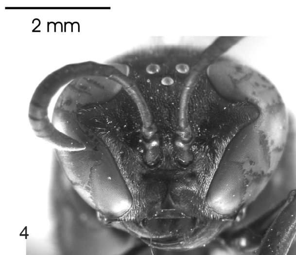
Figure 1-4. Trypoxylon mexicanum . 1) Vista lateral de la hembra. 2) Tarsos de la pata posterior de la hembra. Cabeza en vista frontal: 3) Hembra. 4) Macho. Figures 2 y 3 con la misma escala.