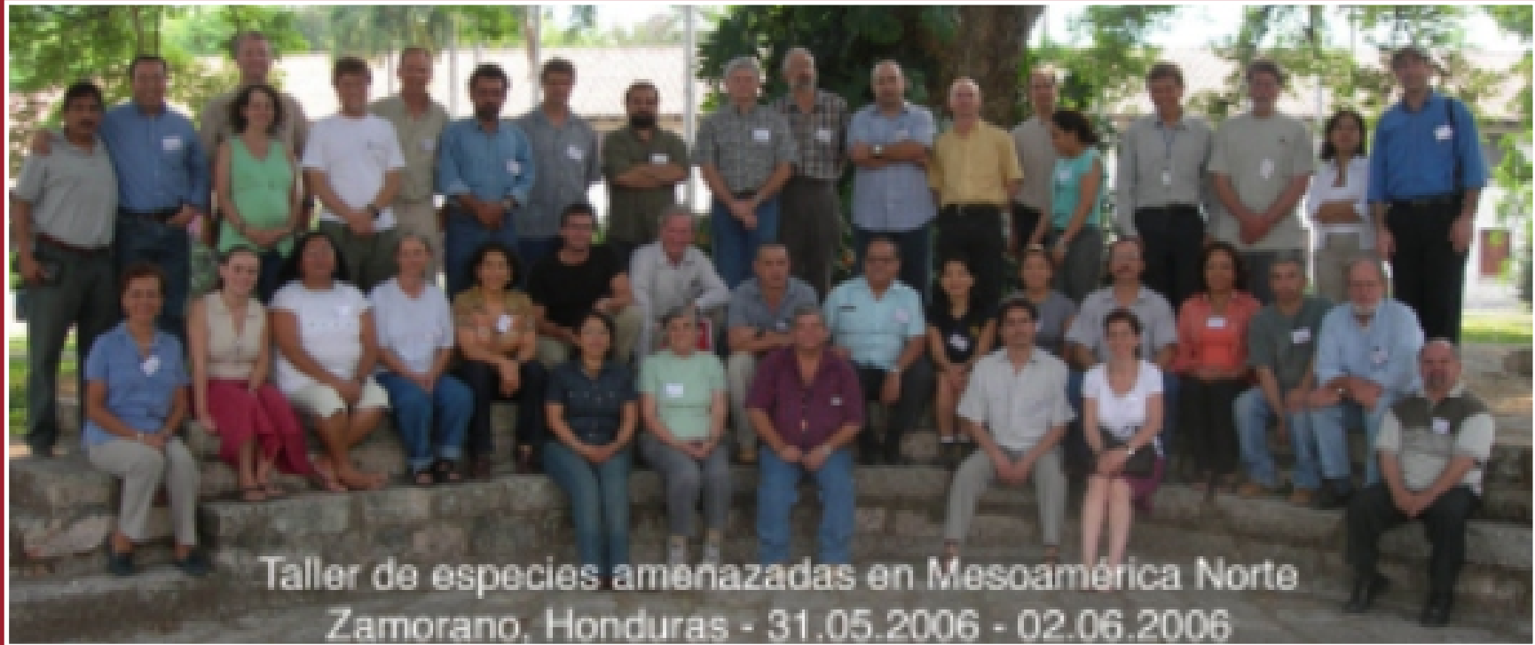
Taller de especies amenazadas en Mesoamérica Norte Zamorano, Honduras - 31.05.2006 - 02.06.2006