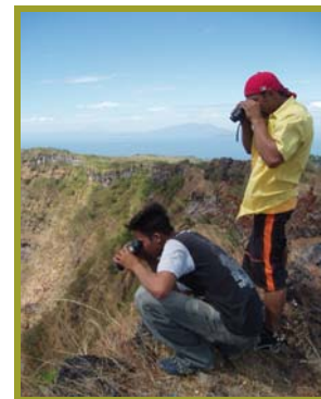
Sobre la cima de Volcán Cosigüina

población sufre altos niveles de pobreza extrema. Según el Mapa de Pobreza de Nicaragua, se estima que el 80% de la población general sobrevive con menos de US $2 al día, lo que significa que muchas personas no tienen otra alternativa que depender directamente de los recursos naturales que los rodean para su subsistencia.