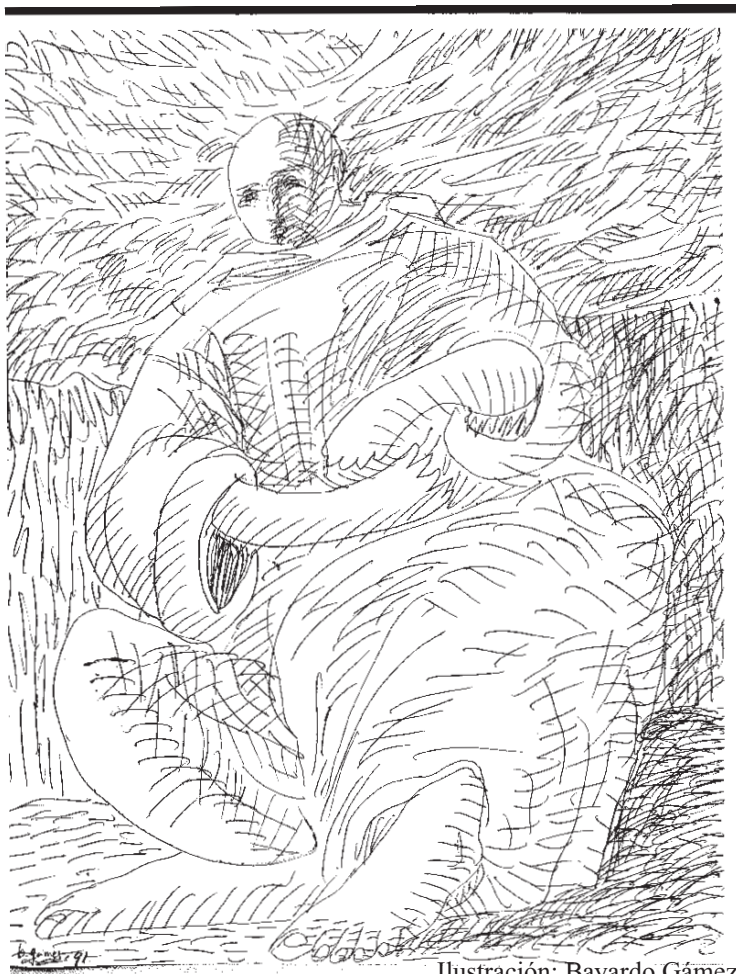
Ilustración: Bayardo Gámez.

Número 2 -Parroquia de León- Noviembre- Diciembre del 2005