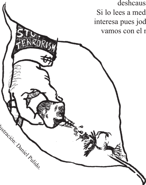
Ilustración: Daniel Pulido.