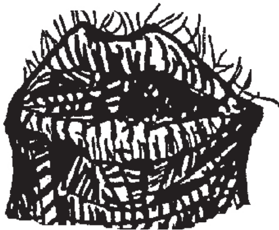
Ilustración; Daniel Pulido.