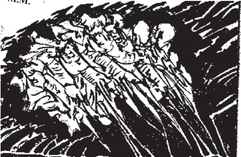
Ilustración: Bayardo Gámez.

Respuesta a Adivinanza del número anterior: Cocodrilo