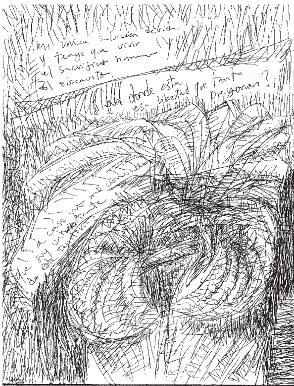
Ilustración: Bayardo Gámez.