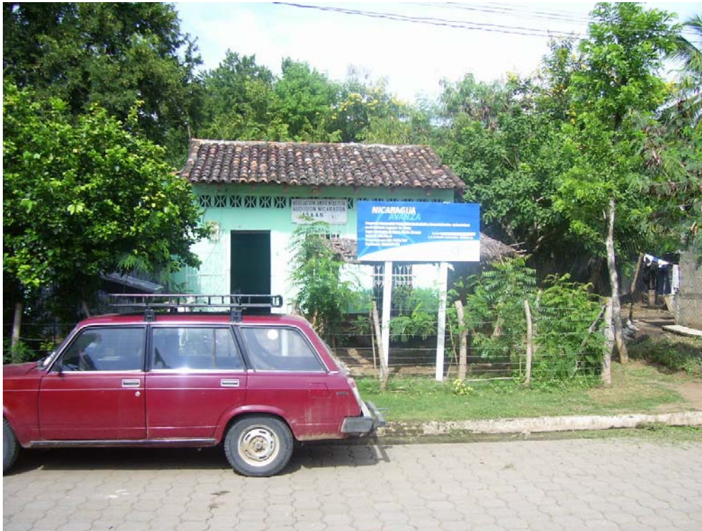
Oficinas de Audubon Nicaragua en Tisma