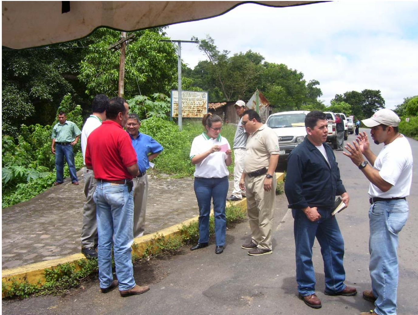
Actividad coordinada por MARENA Jinotega y patrocinada por Audubon Nicaragua.