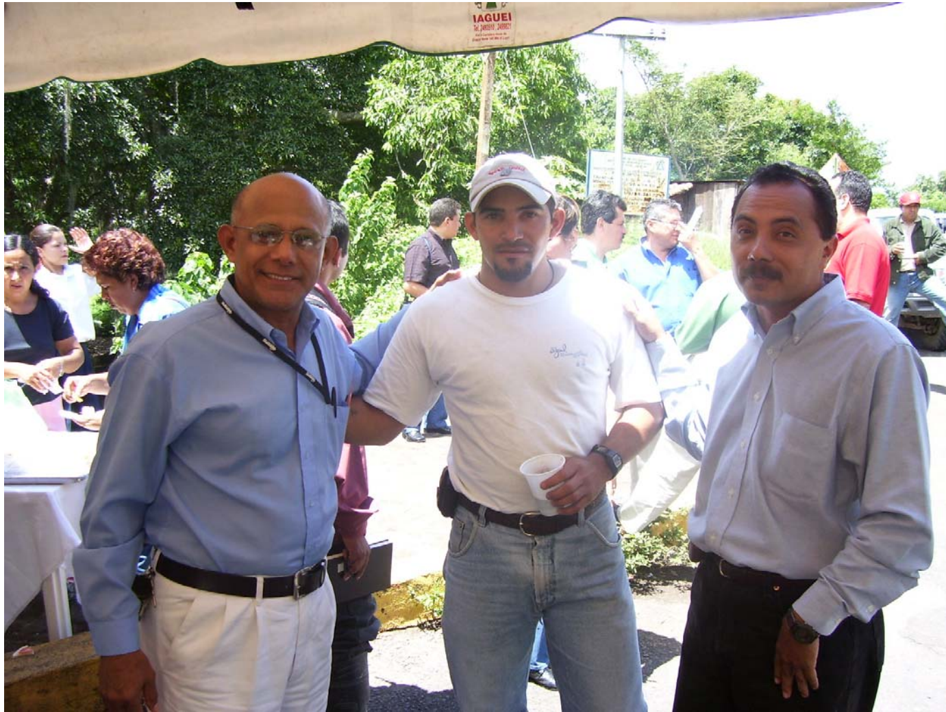
MARENA Central, Miembro del equipo MARENA Jinotega y GTH-NIC.