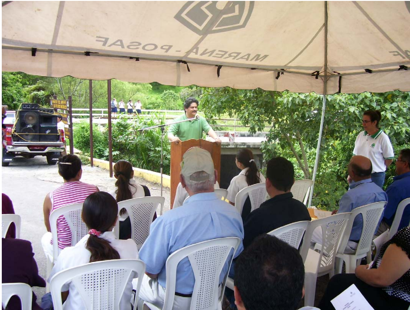
Discurso del Señor Alcalde (Alcaldía municipal de Jinotega)