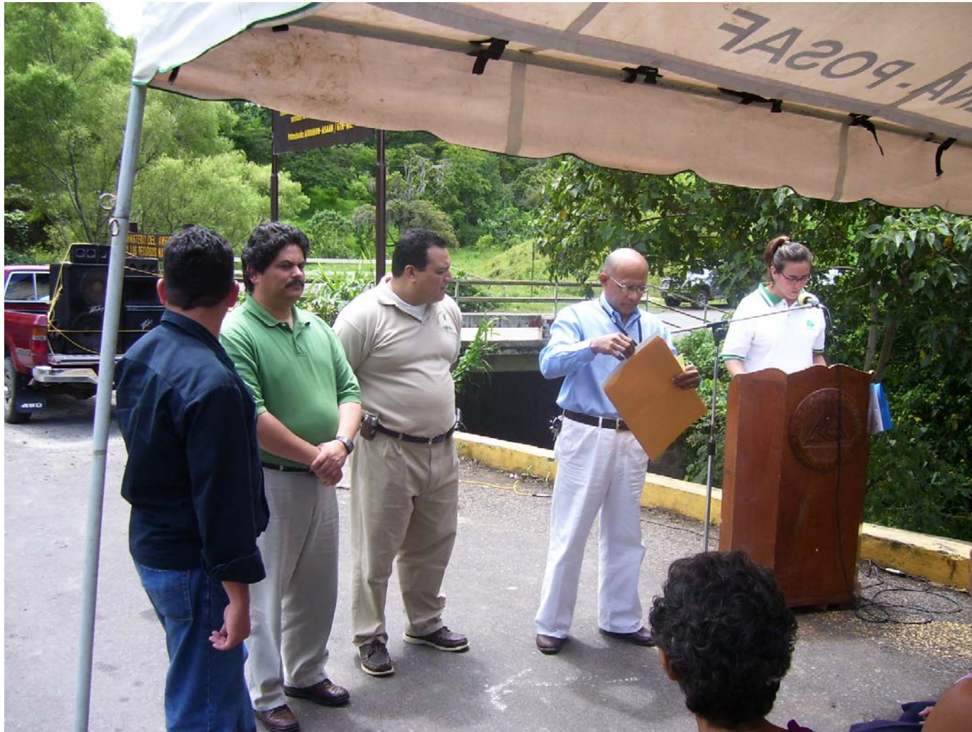
Autoridades de HIDROGESA, Alcaldía Municipal, MARENA Jinotega, MARENA Central.