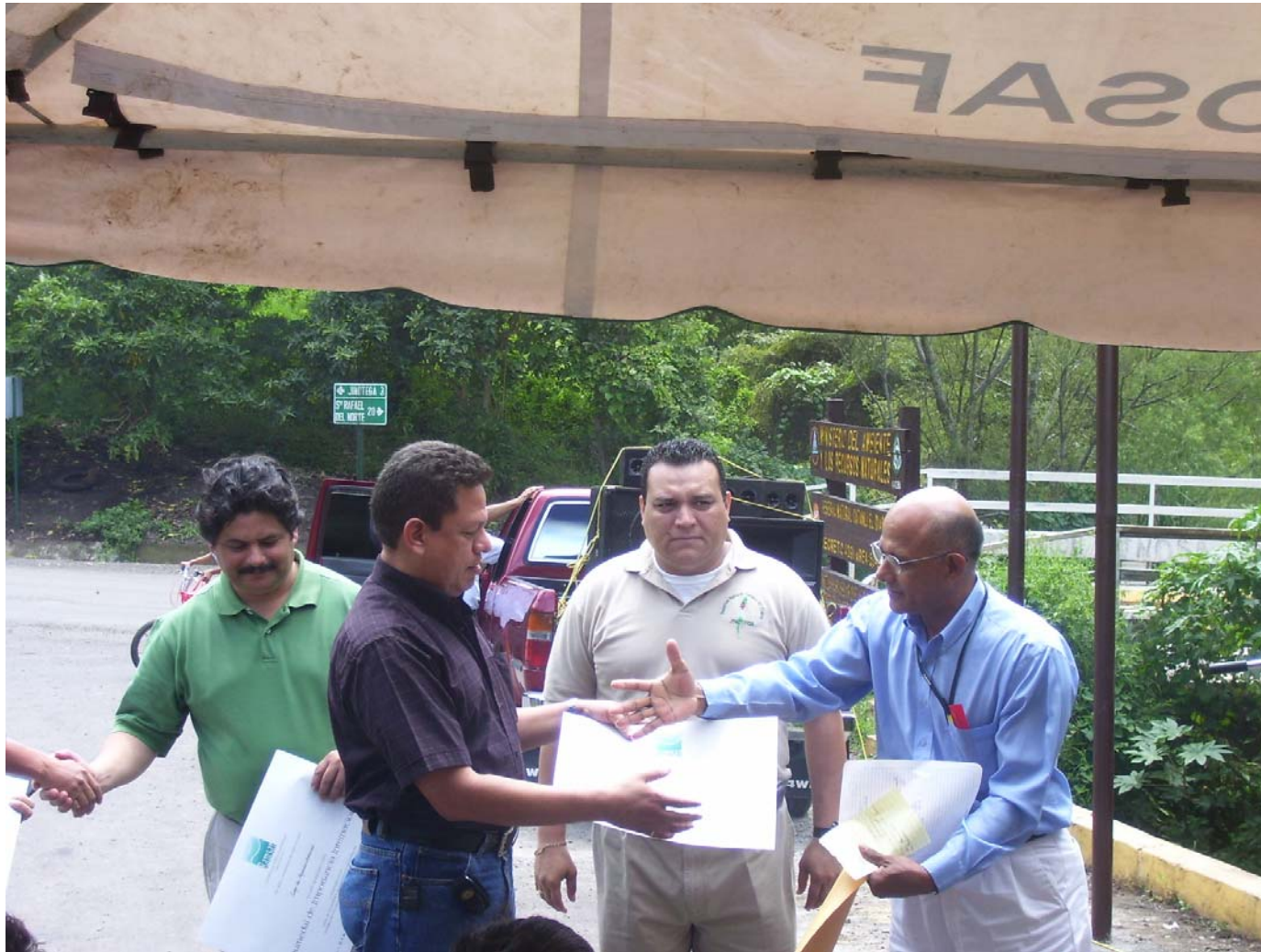
Autoridades del MARENA haciendo entrega de Certificados (Sitio RAMSAR) a: Audubon-NIC, HIDROGESA Alcaldía Municipal y MARENA Jinotega.