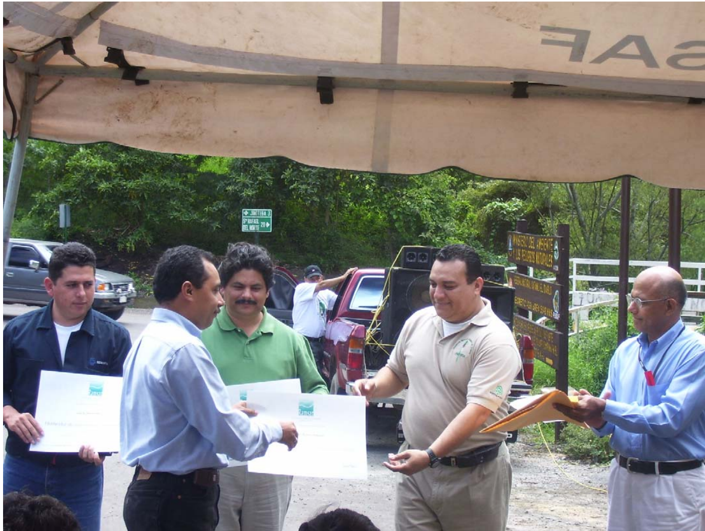
GTH-NIC recibe de MARENA Central Certificado de Sitio RAMSAR Lago Apanas-Asturias.