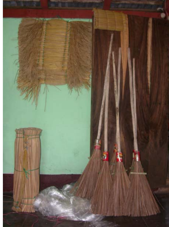
Productos elaborados por lugareños