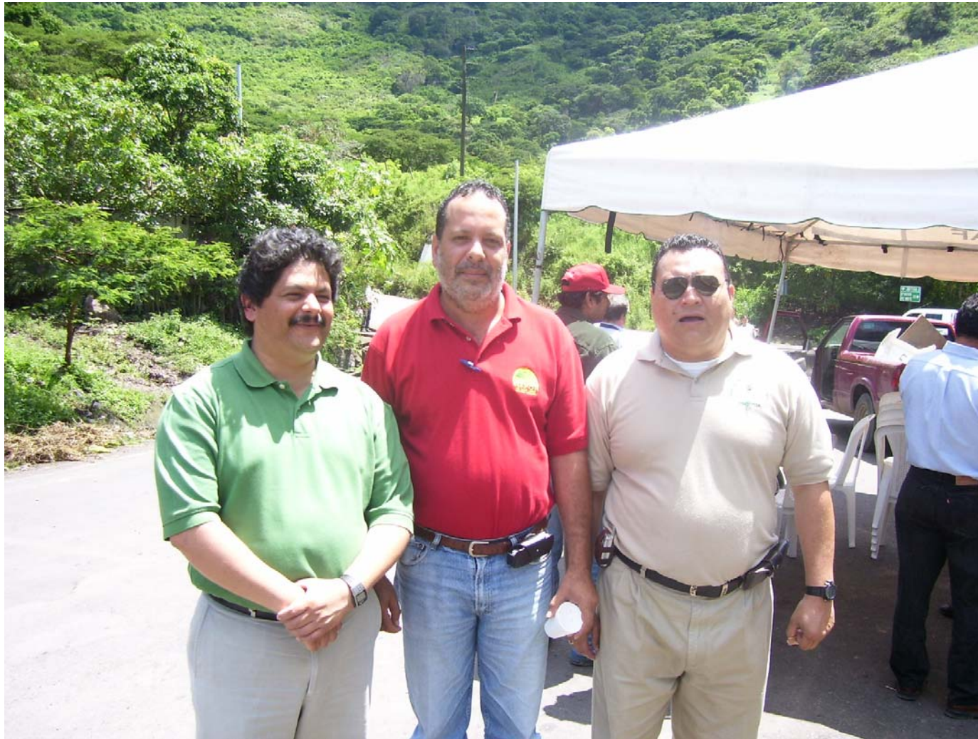
Presentes en la actividad de izquierda a derecha: el Señor Alcalde de Jinotega, Representante de INAFOR y Delegado de MARENA Jinotega.