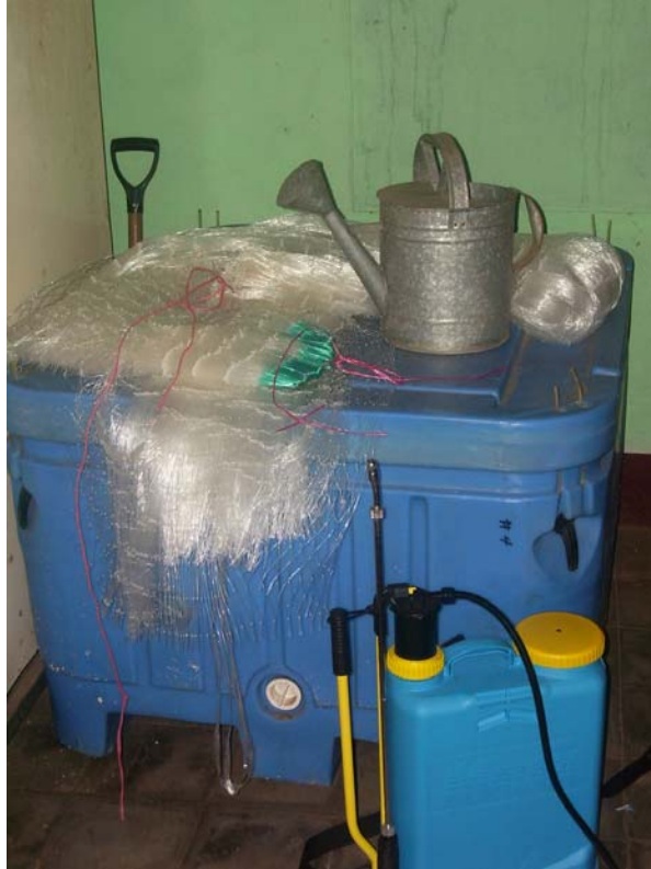
Equipos para trabajos donados.