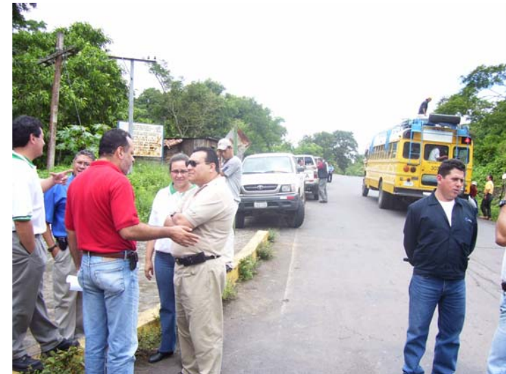
Inauguración del Rotulo Sitio RAMSAR Jinotega